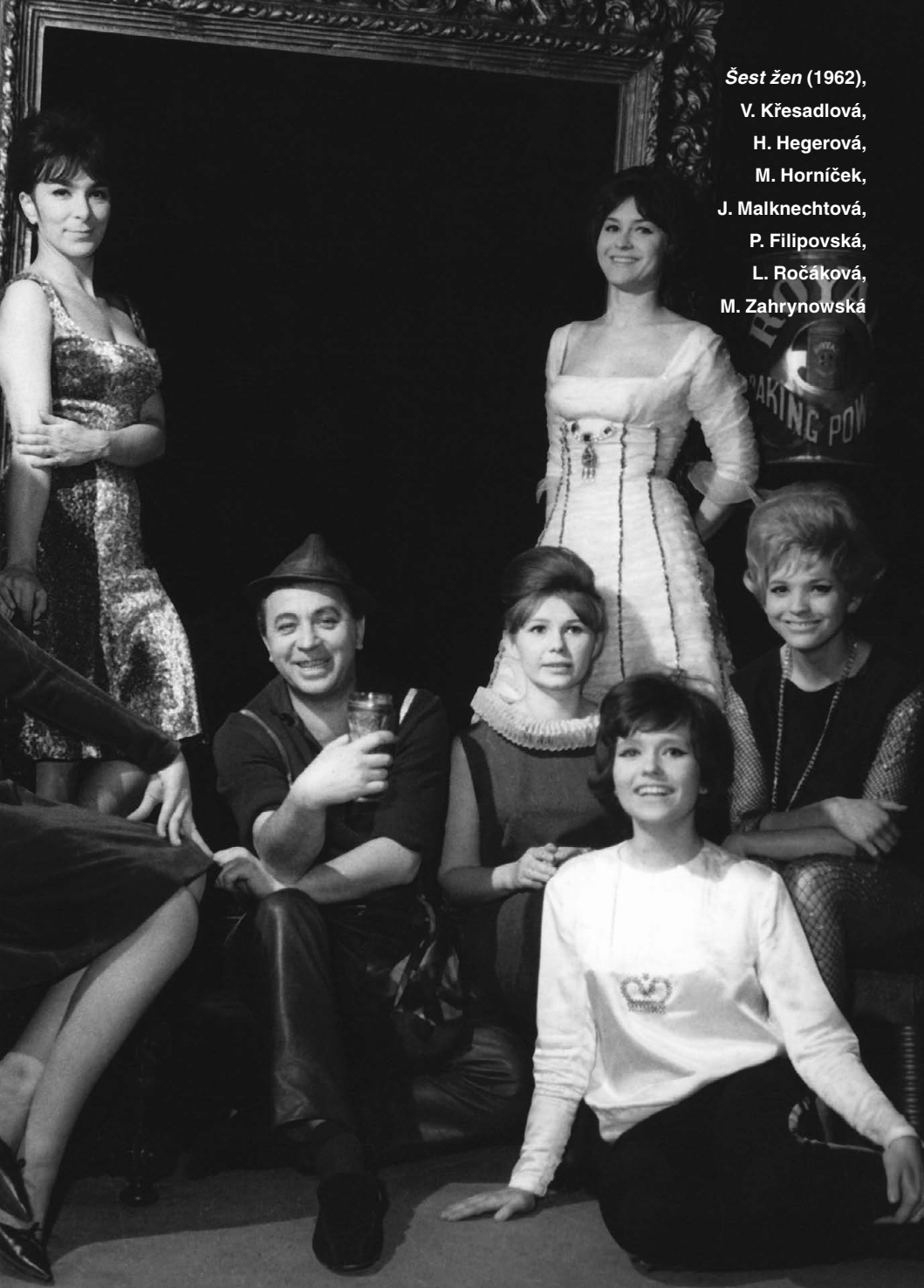
Šest žen (1962), V. Křesadlová, H. Hegerová, M. Horníček, J. Malknechtová, P. Filipovská, L. Ročáková, M. Zahrynowská