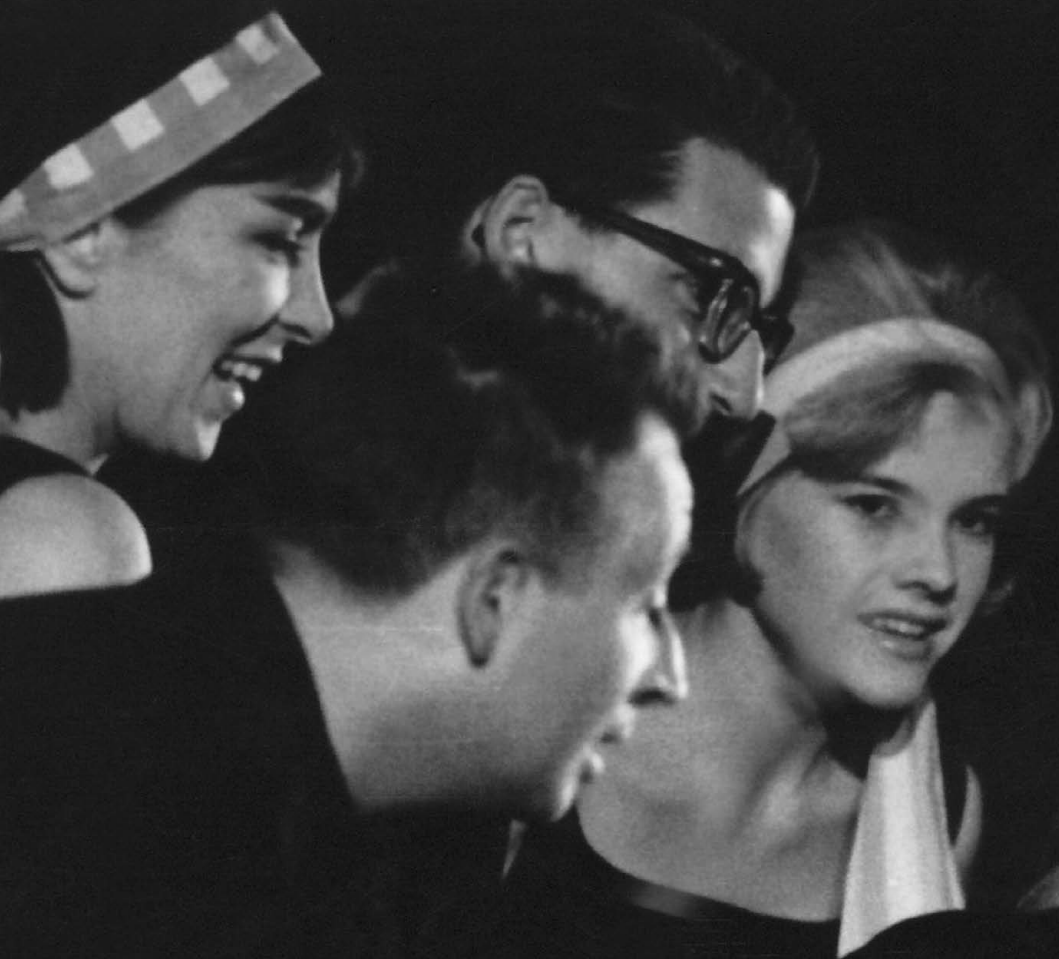
Zuzana je zase sama doma (1961), H. Hegerová, V. Maurer, K. Štědrý, E. Pilarová, V. Štekl, W. Matuška a H. Lukasová