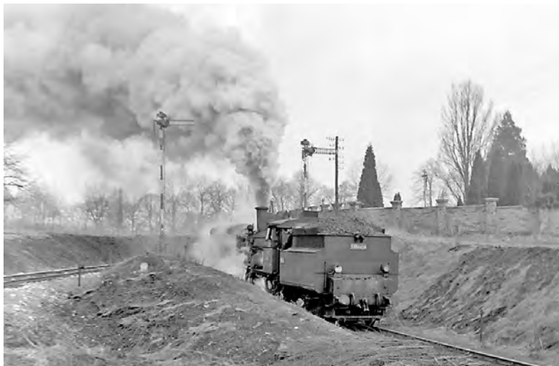
Vlak jede krajinou, já jedu za jinou... V tomto případě snad za jinou romantikou? (Vítězný snímek ze soutěže Foto roku 2011 Beroun.)

Příroda byla vskutku životelkou lidí s nekonečnými možnostmi. Lesní včely byly zdrojem medu a vosku, lesní plodiny zaměstnávaly potravináře, stejně tak jako zvěř. Dokonce řeky a potoky si vyžadovaly profesi hlídače vod. Dbal na mechanickou čistotu toků, aby ulomené větve či poražené kmeny neucpávaly jezy, stavidla a další vodní zařízení. A kolik lidí potřebovala doprava