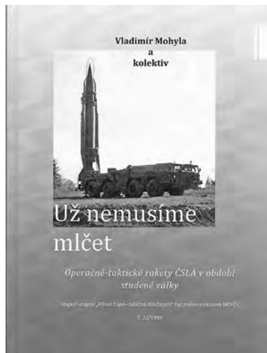
Už nemusíme mlčet

Ale hranice jsou od toho, aby se překračovaly. Tím spíše, že tomuto zeměpisnému ohraničení neodpovídají nějaké hraniční patníky, sloupky a jiná označení. Tak i v našem vyprávění je budeme překračovat, ocitneme se třeba v části Českého krasu, Berounska, Křivoklátska či Karlštejnska. Vždyť i geologové tvrdí, že toto vymezení Brd je z jejich pohledu nepřesné, protože neodpovídá složení hornin. Brdy mají celkem deset vrcholů vyšších než 800 metrů. Právě tyto vrcholy byly cílem mnoha kmenů, které krajem putovaly a stavěly si na nich svá opevněná sídla. Také se sem uchylovali mniši a poustevníci a vůbec se k nim řadí řada záhad a legend, protože jejich skály skrývají četné jeskyně, prohloubeniny a další tajuplná místa. Ostatně, kdo touží po podobném dobrodružství z legend, nechť se vypraví třeba na vrchol Plešivce. Nebo alespoň do obou muzeí ve Všeradicích – toho na obecním úřadě a soukromého M. D. Rettigové. Nemýlíte se, jde o muzeum nazvané po naší nejslavnější kuchařce.