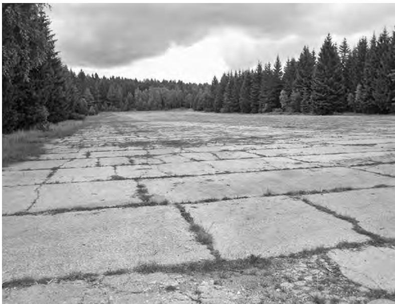
Letiště Hejlák. Mezi posledními tu přistáli Američané.

Nyní by tu ovšem nemohla jako poustevnice žít. Na Hejláku je vojenská pozorovatelná, odkud vojáci kontrolují, kam dopadají dělostřelecké náboje na cvičnou plochu Jordán. Asi čtyři sta metrů od ní byla letištní plocha, kterou využívali za války Němci. Dnes plocha slouží jako seřadiště vojenské techniky.