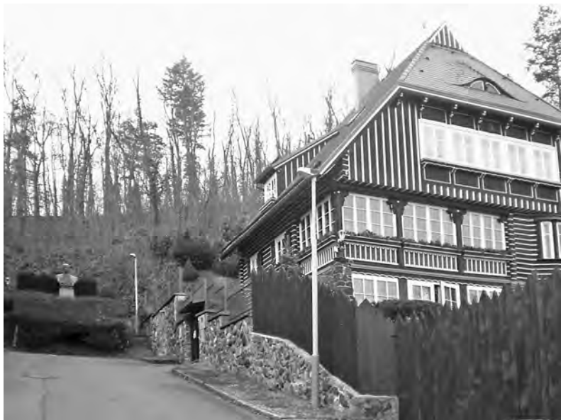
Vožniakova vila, vlevo od ní busta Vladislava Vančury

vilách by se dalo říci, že to jsou první domy Brd, proto se o nich zmiňuji. O něco níž, v téže podbrdské ulici, bydlíval zbraslavský rodák Jaromír Vejvoda, jehož píseň Škoda lásky dodnes připomíná hospoda s tímto jménem na rohu další ulice. Pár desítek metrů a tolik slávy!