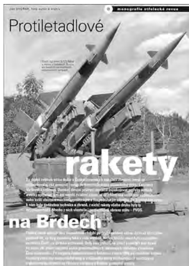
Protiletadlové rakety na Brdech

na Závisti poblíž Zbraslavi. Ale ty dva kopce, na nichž vybudovali své oppidum po obou stranách Břežanského údolí, které také dělí vlastní pražské území od nepražského, již k Brdům nepatří. Škoda, Brdy se mohly pochlubit největším keltským sídlištěm ve střední a snad v celé Evropě. Vždyť tu za dvojími obrannými valy žilo několik tisíc stálých usídlenců a ještě tu bylo místo pro