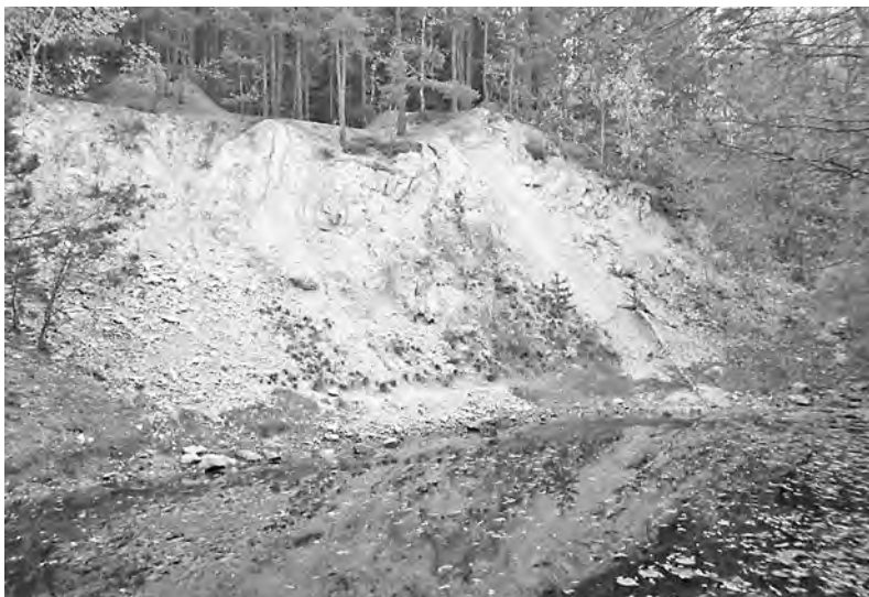
V Brdech si vždy dalo těžit nejen dříví

Mnohem důležitější bylo, že se flus v draslárnách vypaloval v žáru 800 °C, aby z něj nakonec zbyla hydroskopická krystalická látka zvaná potaš, salajka či draslo. Flusárny a draslárny se většinou spojovaly v jeden podnik a draslo dodávali především do skláren, ale také k výrobě střelného prachu. Touto výrobou se nejvíce proslavilo Křivoklátsko, uvádí se v již citovaném článku. Jenže v 19. století se lidé naučili vyrábět flus z melasy, což bylo podstatně levnější, a tak tyto výrobní postupně zanikaly. Stejně jako jiné, které vytlačila chemie.