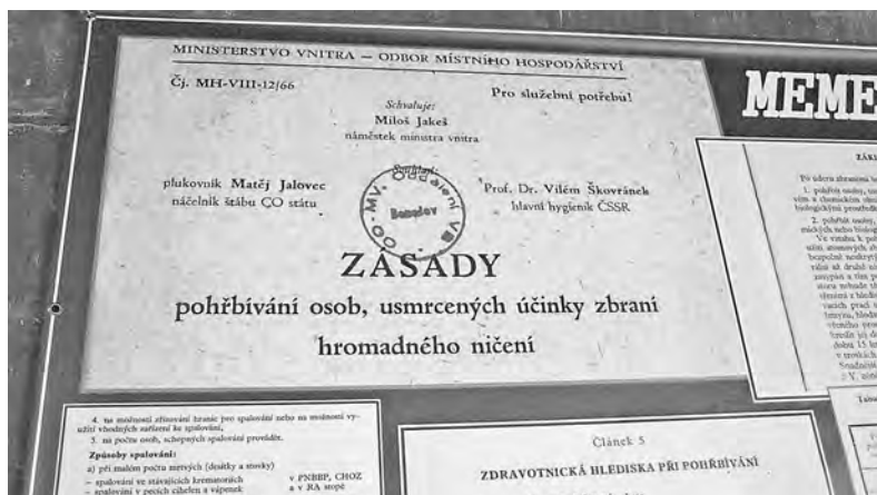
Miloš Jakeš pohřbil víc než osoby – celý režim

Nejsme v márnici, jak by se snad mohlo zdát z těchto dokumentů. Kolem nás šumí brdské lesy, nad námi svítí slunce, nic