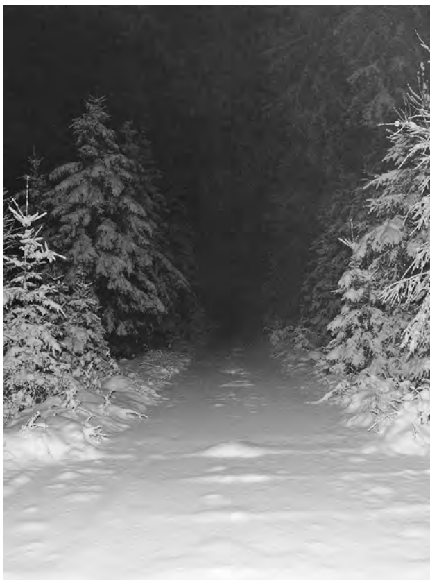
Noční příkrov ještě zvyšuje tajemno těchto hvozdů

těch, kteří zachytili slovem a fotografiemi celý kraj, je příliš mnoho. V příbramské knihovně Jana Drdy je celý oddíl věnovaný regionální literatuře, která představuje Brdy plné tajemna, pověstí a legend, pohádek, přírodních krás, nerostného bohatství a všeho, nač si jen vzpomenete. Dokonce i vojenství je tu zastoupeno, zvláště publikacemi vydanými československou či českou armádou – od první republiky po dnešní dny.