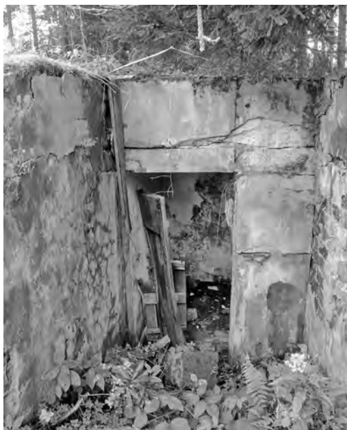
Tento bunkr nezanechali dávní předkové, ale jen ti o generaci starší.

Usadili se tu a na vyvýšených místech budovali svá hradištní opevnění, například po Keltech obsadili Plešivec. Kraj nakonec ovládl jeden ze slovanských kmenů, který se po svém předkovi nazýval Buzovici či Buzici. Později se rozdělil na dvacet až třicet dalších rodů, například Lvové z Rožmitálu. Budojí tvrze či hrádky Březnice, Třemšín, Valdek, Ostrý a další.