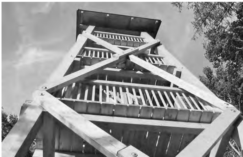
Bezručova vyhlídka u Kopřivnice. Ale nikoliv na Moravě, a také Bezruč ji ani nestavěl, ani na ni nelezl.

Na druhé straně se proti tomu stále silněji začali bouřit místní obyvatelé. Obávali se, že tím ztratí zdroje své obživy; jen menší část doufala, že v prostoru nalezne novou práci. Také většina starostů a obecních zastupitelstev byla proti, jen část čekala odškodnění především ve formě nové vodovodní a kanalizační sítě. Protestovali zejména milovníci přírody, ale i učenci, spisovatelé a vůbec umělci. K nim se přidávala široká veřejnost. Noviny tím žily, zejména v Českém deníku , Národních listech a dalších se objevovaly stále častěji polemické články. Mnohé byly klamně či