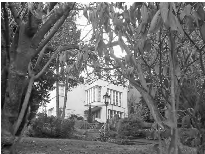
Zde žil Vladislav Vančura

Naproti Vančurovic vile, ve velkém dřevěném domě se zahradou obehnanou dřevěnými kůly ve tvaru totemu, bydlel můj kamarád ze školních let Jaroslav Vožniak, později proslavený malíř, ilustrátor, grafik a sochař – také se například podílel na vnitřní výzdobě našeho montrealského pavilonu. O obou