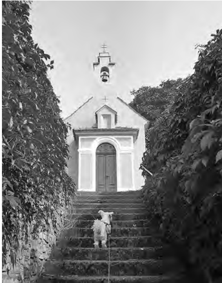
Kaplička v osadě Koda (obec Tetín). Jde si bišonka Adélka pro rozžřešení?

Zato se postupně vytvářel nový zákon. Z počátku se to dělo tajně, teprve postupně se podle kusých novinových zpráv veřejnost dozvídala o tom, že část Brd jim bude nepřístupná. Jak velká část? Kolik půdy vyvlastnit, kolik vesnic bude třeba vystěhovat, aby se tu zacvičovali dělostřelci, letci i pěšáci, zkoušely se nové zbraně a půda se tu zorala výbuchy stovek granátů a pum?