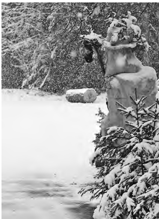
Duch Brd Fabián střeží lesy i pod sněhovou příkrývkou

v jeho dvacátých letech Brdy staly kolébkou skautského a trampského hnutí. Jistě to není žádná osobitá kultura ani lidské plemeno, ale svým způsobem jde o zvláštní kastu lidí se vztahem k přírodě. Proto tu najdete i dnes pozůstatky prvních skautských a trampských osad či alespoň jiné stopy jejich pobytu. Jejich zvláštností byla totiž úprava ohniště, které po táboráku nečistili od popela, ale naopak ho nechali vrstvit, třeba až do metrové výše. Proslavená Vodní pětka naposledy tábořila u padrťských rybníků v létě 1939, poté její členové pomáhali založit odbojovou Zpravodajskou brigádu.