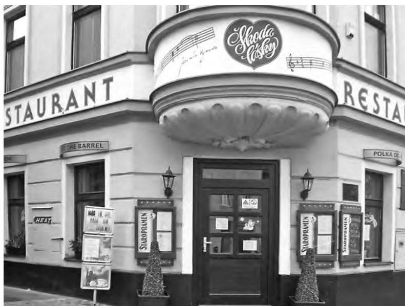
Restaurace se vzpomínkou na Jaromíra Vejvodu

Tehdy, když sem od východu postupovaly slovanské kmeny, aby vytlačily germánské Bóje (to ještě zcela jistě netušily, že jejich potomci za mnoho tisíc let se sem v noci přikradou po kolejích do Rožmitálu pod Třemšínem a do Jinců), tu však kopce pokrývaly neprostupné pralesy nebo naopak mokřady a močály. Slované se sem dostávali koryty říček a údolími.