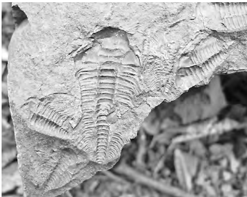
Tento trilobit po stráni Vinice už nedolezl, zkameněl

V dávných časech tu ani bory nešuměly, ale místo Brd se rozkládalo veliké sladkovodní jezero. Když se různými pohyby půdy spojilo s mořem, rozmohl se v něm život. Z mnoha druhů živočichů se však proslavil jeden, do jisté míry předchůdce dnešního raka, který stále ještě obývá některé čistší vodní toky. Tehdy, před 570 miliony let, však žádný ekologický problém