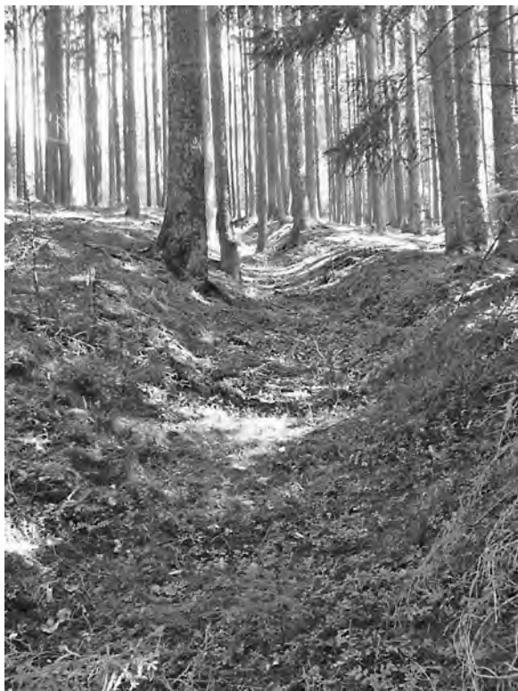
Středověká úvozová cesta pro dehtařský areál, 13.–14. století, Strašice

ujímali popeláři, kteří ho dodávali flusárníkům. Ti neměli vůbec nic společného s lidmi, kteří kolem sebe neslušně plivají, ale flusárenství bylo velice pracným řemeslem. Když se totiž popel vyloužil ve vodě a přecedil, vznikl louh. To je velmi silná alkalická žíravina, s níž se dá nejen prát prádlo, ale především dalším odpařováním se dá z něho vyrobit flus. Tuto tmavou hmotu potřebovali mydláři, ale také rolníci, kteří věděli, že když se popel několikrát přecedí a usuší na slunci, je z něj výborné hnojivo.