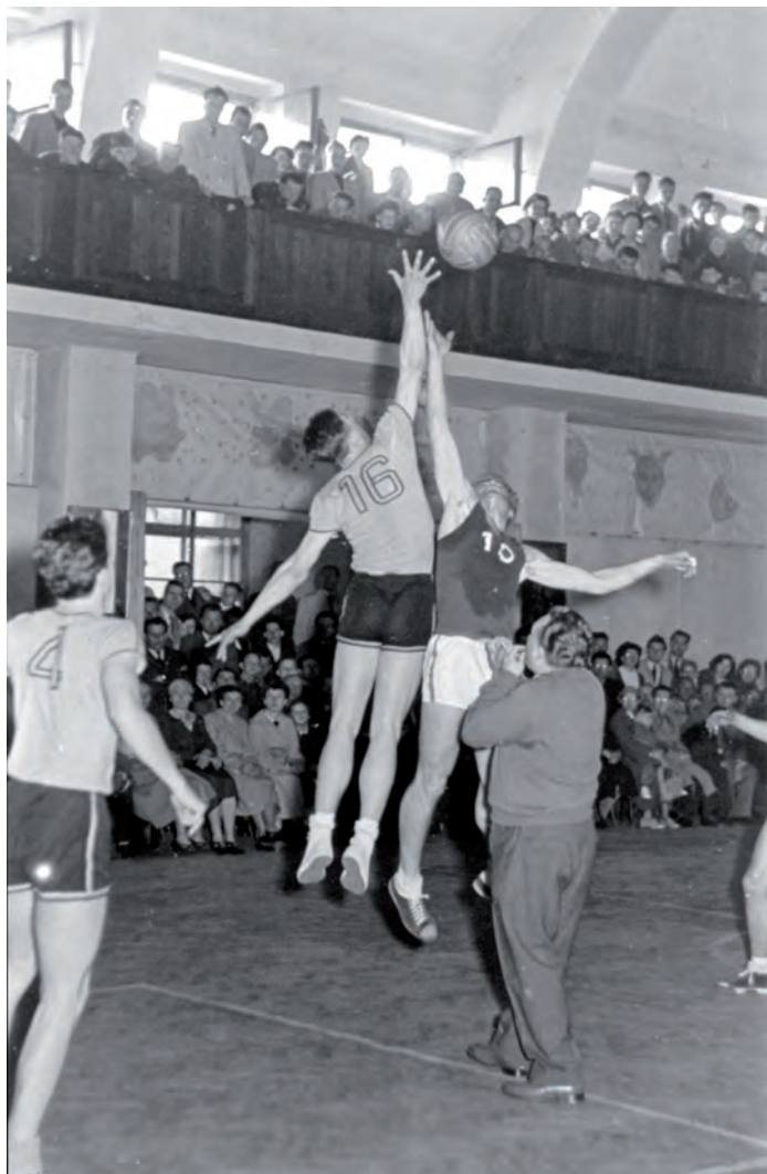
V poválečné době basketbal v Nymburce často plnil hlediště do posledního místa.

Už v roce 1933 došlo i na první mezinárodní konfrontaci. V našlapané sokolovně Nymburk hostil mužstvo z Terstu, které zvítězilo 28:16. Rok nato se fanoušci dočkali dvojitého drtivého vítězství nad rumunským mistrem z Bukurešti a v pětatřicátém, kdy se prvními mistry Evropy stali Lotyšši (Československo bralo bronz), Nymburk doma jen o osm bodů podlehl nadupanému celku Rigy.