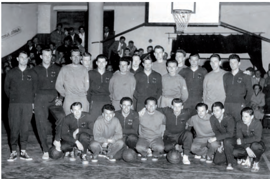
Společné foto nymburských hráčů (ve světlém) s reprezentací NSR v roce 1957; mezinárodní střetnutí tehdy sledovalo 800 lidí!