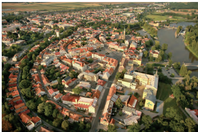
Letecký pohled na historické centrum Nymburka