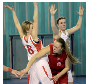
Momentka z prestižního polabského derby: neprodyšná nymburská obrana nedává dýchat soupeře z Poděbrad