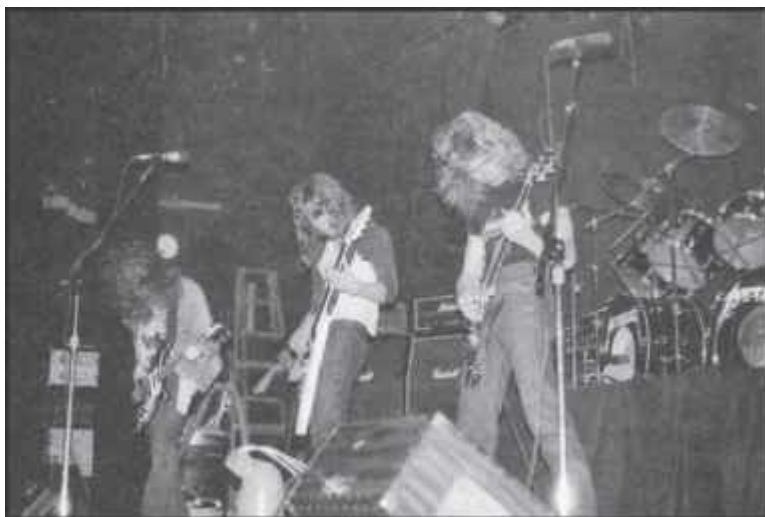
Metallica, zvuková zkouška před koncertem v San Francisku, březen 1983.