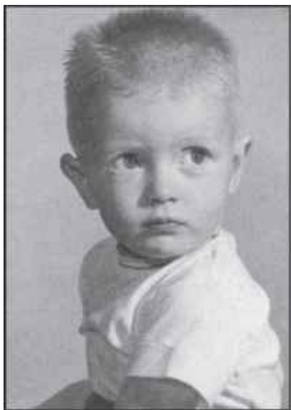
David Scott Mustaine, narozený 13. září 1961.

byl alkoholik, já jsem se rozhodl věřit, že kvůli tomu nebyl zlým člověkem. Slabým člověkem, to ano, a také se dopouštěl špatností. Ale mám na něho i jiné vzpomínky. Vzpomínky na milého člověka, který kouřil dýmku, četl noviny a před spaním si mě vždycky zavolal, abych mu dal pusku na dobrou noc.