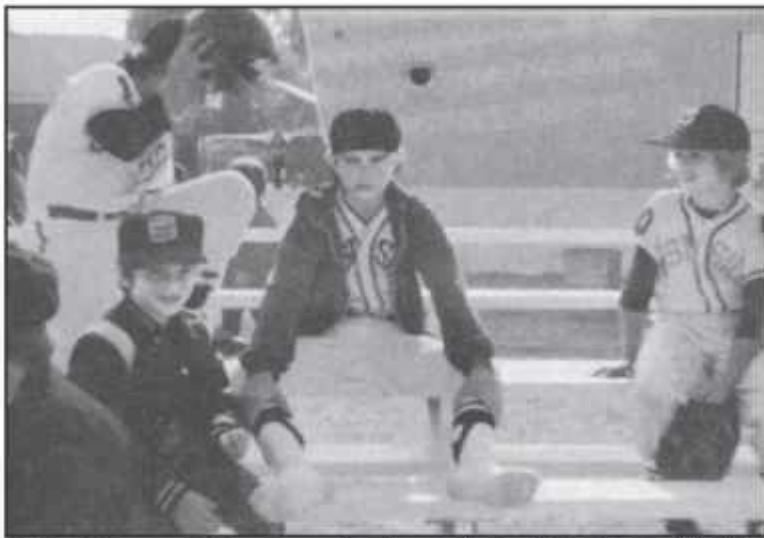
Ještě než jsem se stal teenagerem, bavilo mě vrhat na lidi upřený pohled jako na téhle fotce – to jsme právě s týmem vyhráli nějaký zápas Little League.

Nechtěl jsem se chovat jako arogantní pitomec, to vůbec ne. Byl jsem jen vyčerpaný a vůbec jsem neměl náladu hrát na nové pozici, nechtěl jsem se to učit za pochodu, snášet přitom ostudu a pak ještě šlapat celou cestu domů sklíčený a otrávený. Tak jsem šel hrát a pustil jsem soupeři několik oběhů. A to, jak se později ukázalo, byl jeden z mých posledních baseballových zápasů.