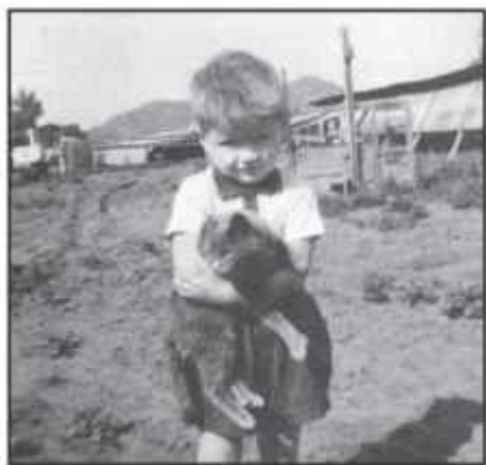
Nesnáším kočky. Tahle byla určitě na cestě do drtičky na dřevo.

Co člověk udělá , když je osamělým dítětem, klukem obklopeným ženami, bez otce, dokonce i být jen bez otcovské postavy? Vymýšlí si, vytváří svůj vlastní vesmír. Hodně jsem si hrál s plastovými modely – miniaturními figurkami Jacka Dempseyho a Gena Tunneyho, jejichž soupeření na podlaze mého pokoje propukalo každou noc, s maličkými americkými vojáčky, kteří útočili na pláže v Normandii nebo se vylodovali na Iwo Jimě. Divné, že? Ale tenhle konkrétní svět, svět v mé vlastní hlavě, byl tím nejbezpečnějším místem, které jsem znal. Nerad bych teď působil jako oběť, protože tak jsem se nikdy necítil. Považuju se za někoho, kdo přežil. Pravdou ovšem je, že každý, kdo něco přežije, musí také něčemu odolat, a v tom jsem nebyl výjimkou.