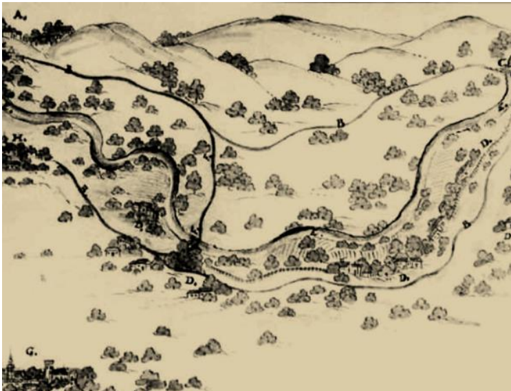
Moravská Ostrava v roce 1699

Není znám autor nejstarší dochované „mapy“ Ostravy, víme, že je z roku 1699 a znázorňuje (tuš a akvarel) dosti neuměle dominanty Moravské Ostravy – kostel sv. Václava, radnici a městské hradby (dole vlevo). Na mapě můžeme dále rozeznat vinoucí se řeku Odru, osady Novou Ves, Zábřeh nad Odrou, Svinov a Čertovu Lhotku (pozdější Mariánské Hory).