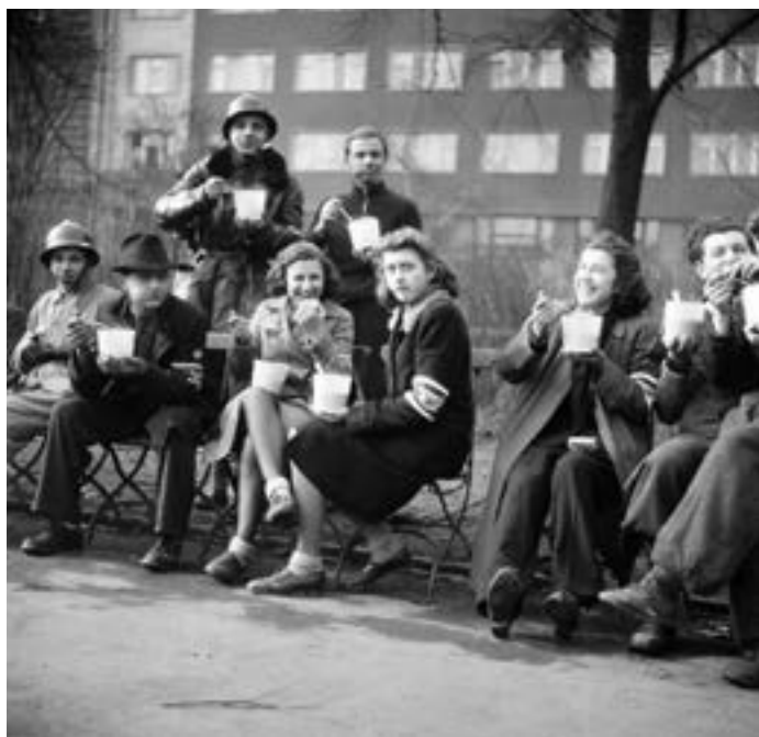
Následky náletu na Prahu 14. 2. 1945 pomáhala odstraňovat i mládež z Kuratoria pro výchovu dětí a mládeže a tzv. oddílů Zvláštního zasazení. Fotografie vznikla na Karlově náměstí při polední přestávce.

Následující stránky se tedy budou zabývat změnami módních linií, střihů, technickými novinkami v materiálech či typu oděvu, ale dotknou se i dějinných událostí, životního stylu a každodenní životní reality v Protektorátu Čechy a Morava.