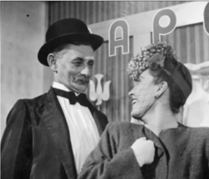
Vlasta Burian a Zita Kabátová před výlohou firmy Papež ve filmu Zlaté dno režiséra Vladimíra Slavínského, 1942.

Pražské korso začínalo u Národního divadla a kolem ulice Na Perštýně pokračovalo Národní třídou směrem ke Zlatému kříži na spodním okraji Václavského náměstí. Tam začínaly německé Příkopy, kam sice pronikli Češi otevřením společenského kulturního střediska v paláci Sylva-Taroucca, 24 které ale i tak zůstávaly německým centrem uprostřed Prahy. Národní třída se jmenovala Národní, protože byla právě „národní“. I proto tak záleželo okupantům na jejím přejmenování na třídu Viktoria v duchu německé propagandy o vítězství. I poté zde však zůstalo české středisko Prahy a byla zde i sídla hlavních modelových domů. Stačilo na Jungmannově náměstí nepokračovat na Zlatý kříž, ale zahrnout do Jungmannovy ulice a trasa procházky se stala i trasou módní, která byla mnohem rozsáhlejší a pestřejší než je dnešní ulice Pařížská. Většina obchodů a módních podniků navíc patřila českým vlastníkům.