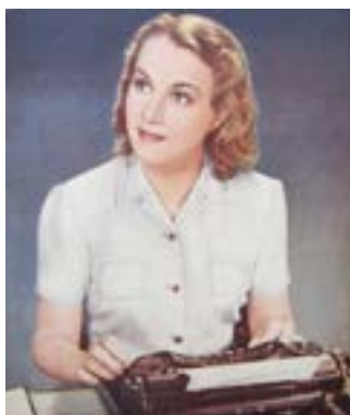
Adina Mandlová jako úřednice ve filmu Dva týdny štěstí režiséra Vladimíra Slavinského, 1940.

Sekretářky v kanceláři Národního souručenství, říjen 1942. Ženy nemohly do této politické organizace vstoupit, ale mohly pro ni pracovat.