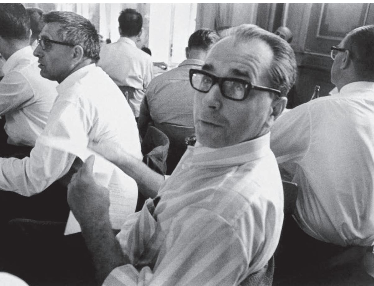
Jiří Kolář, 1967.