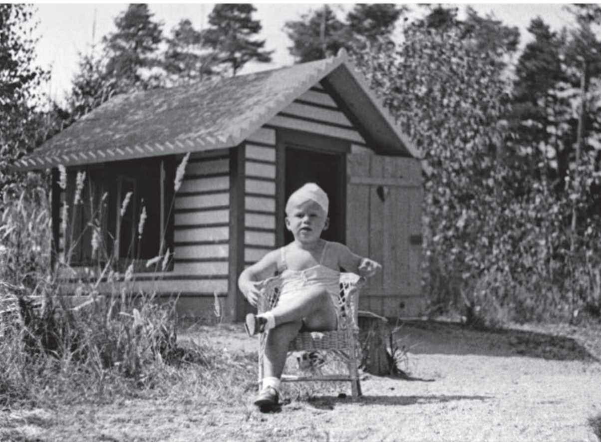
Václav Havel před svým srubem na Havlově, začátek čtyřicátých let.