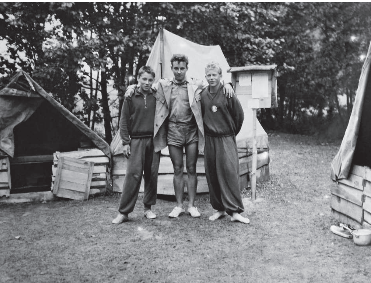
Václav Havel (vpravo) s kamarády na letním táboře, přelom čtyřicátých a padesátých let.