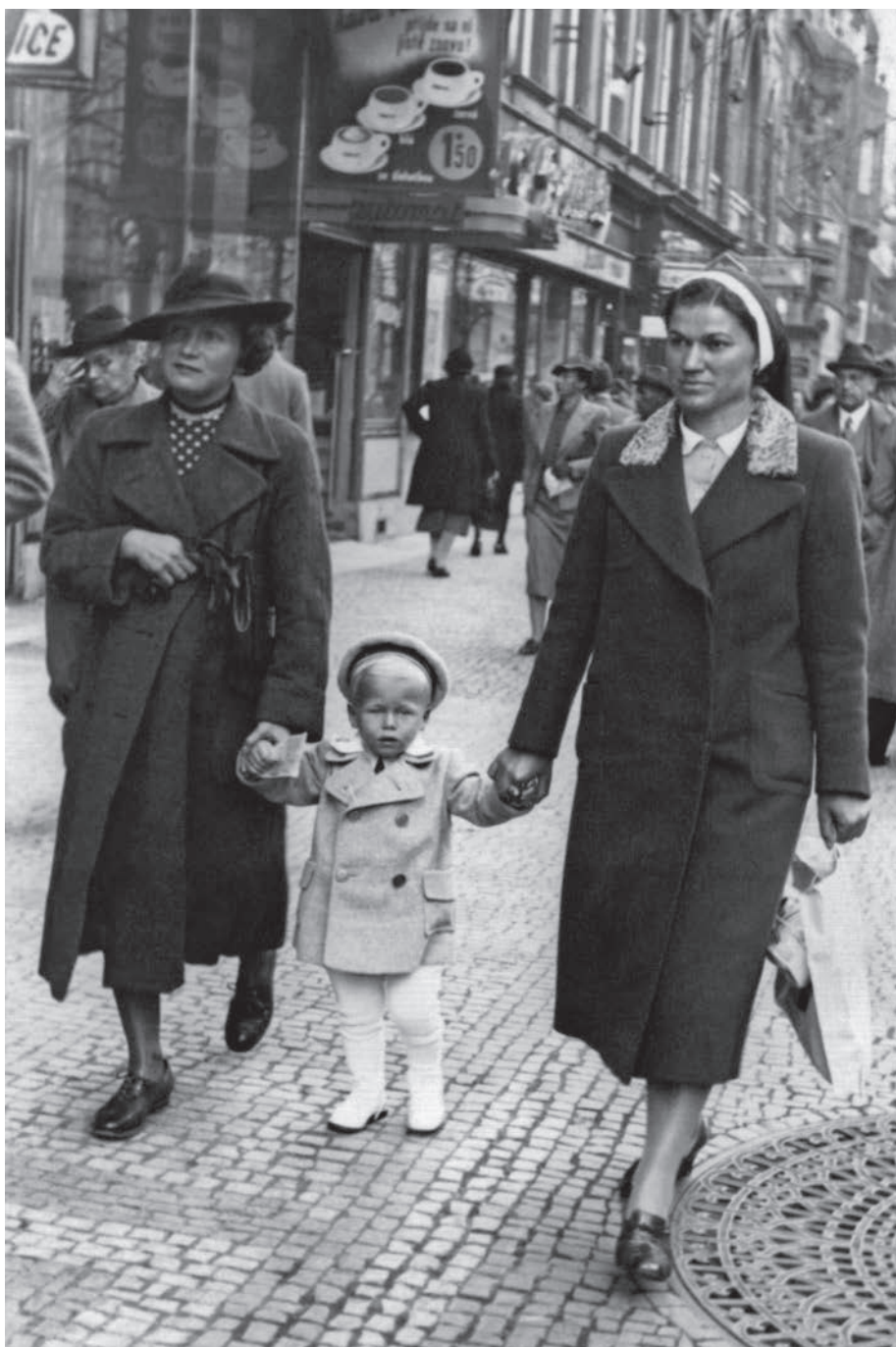
Václav Havel s maminkou a guvernantkou na Václavském náměstí, říjen 1938.