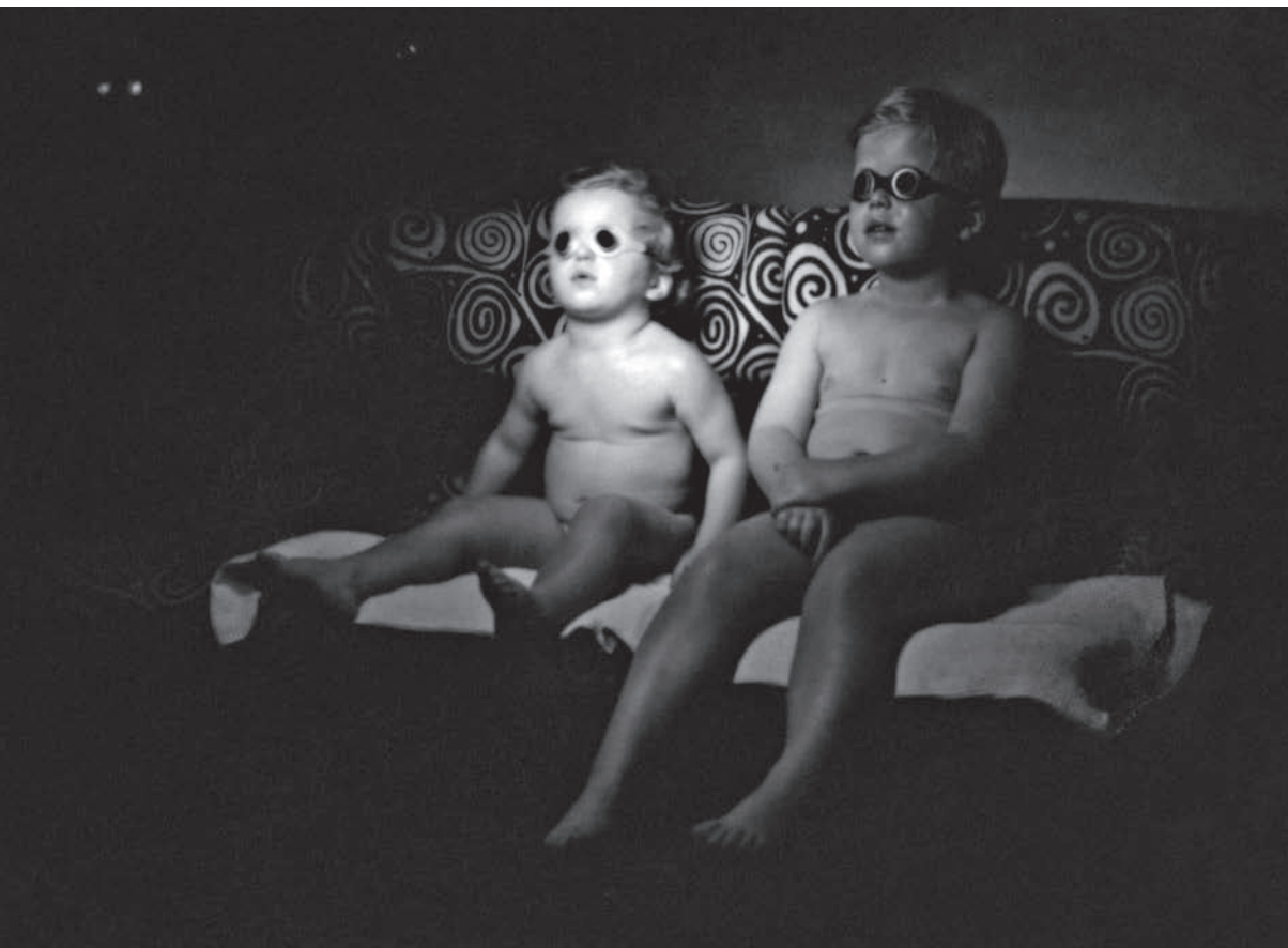
Bratři Havlové se opalují na horském sluníčku, začátek čtyřicátých let.