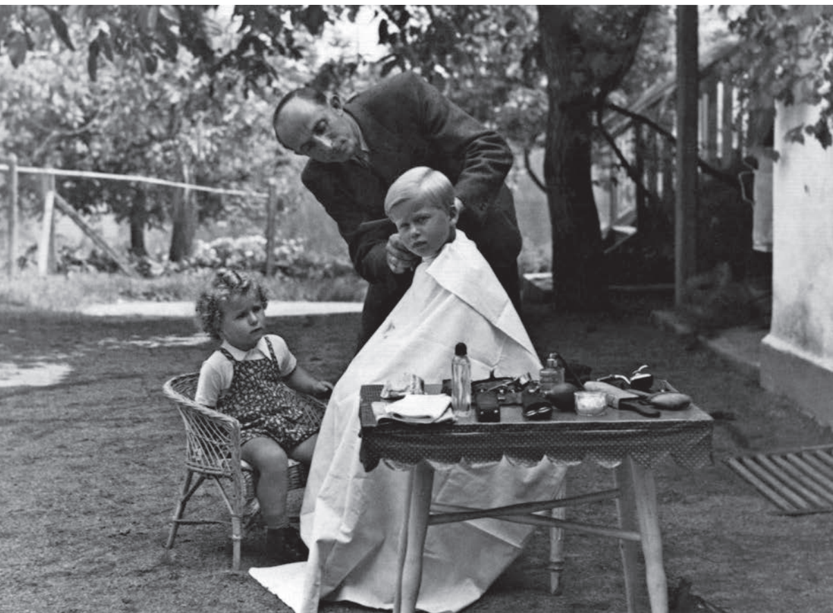
Václav Havel v kadeřnickém křesle. Vlevo sedí bratr Ivan, začátek čtyřicátých let.