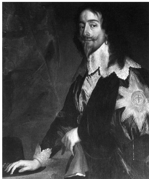
Král Karel I.

Panovníkův ukvapený krok se od počátku jevil jako velká chyba; Koruna se totiž ocitla na pokraji bankrotu. Vzhledem k tomu, že Karel I. nehodlal ukončit válku se Španělskem, musel činit zoufalá opatření, aby finanční krizi odvrátil. V mnoha ohledech se přitom jednalo o kroky, které překračovaly „hranu zákona“. Největší odpor vyvolávaly tzv. nucené půjčky (Forced Loans). V roce 1627 Karel I. ve snaze pomoci francouzským hugenotům vyhlásil válku Francii, což byl s ohledem