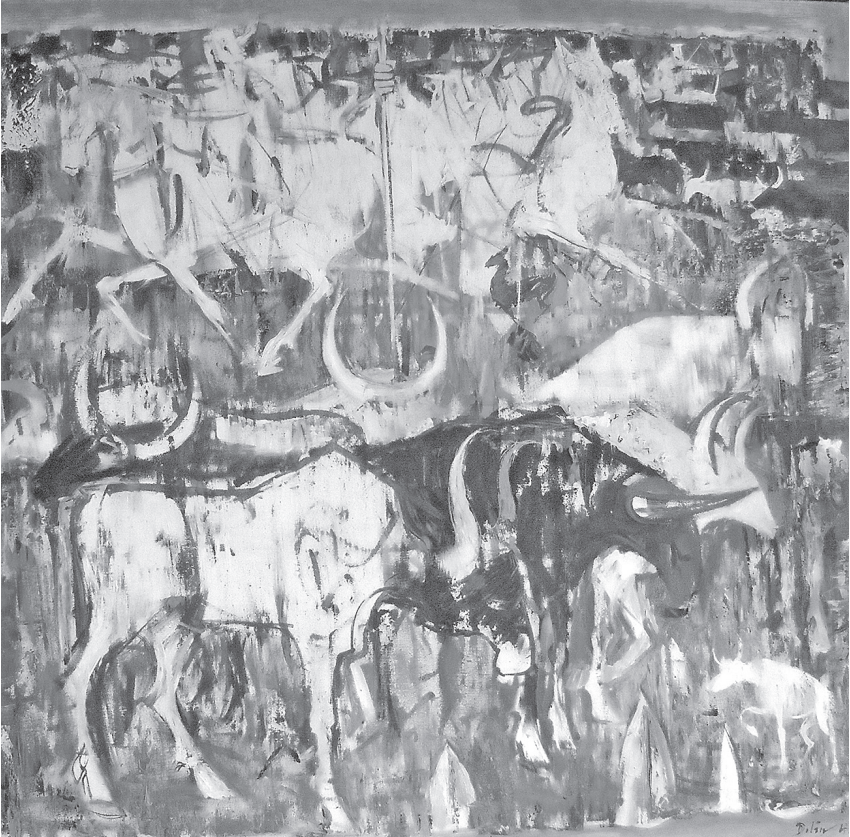
Juraj Dolán: Neolitická Libye