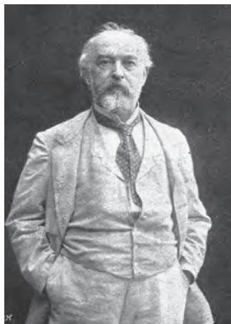
Portrét Františka Adolfa Šuberta, autora dramatu Jan Výrava .