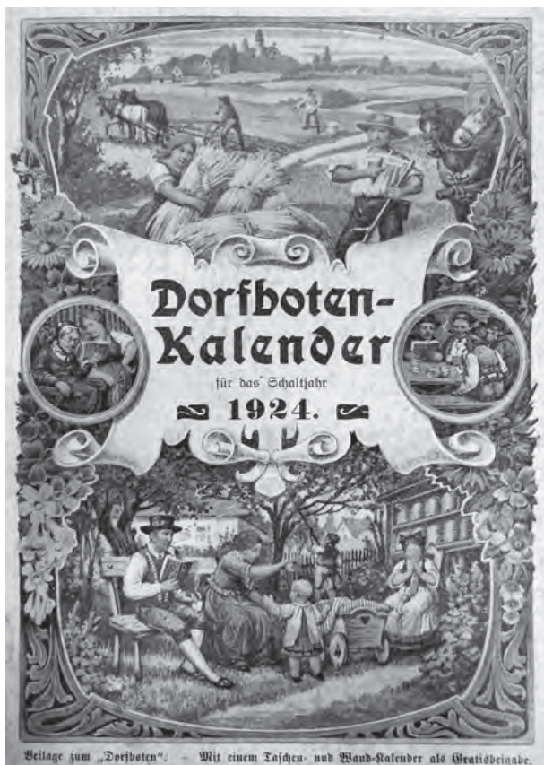
Venkovská idyla z titulní strany publikace Dorfboten-Kalender 1924.