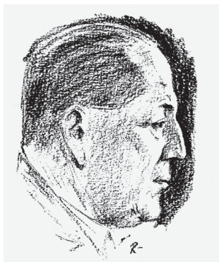
Portrét představitele českého literárního agrarismu Jaroslava Marchy ze sborníku Básníci selství , Praha 1932.

titulů drobných spisů politických a hospodářských. Jeho tvorba byla, jak jinak, zaměřena na venkov, život na vesnici určovaný agrárním a křesťanským rokem. Symptomaticky kladl klidný venkov do kontrapozice ke zkaženému městu, kritizoval tendenci mladé generace odcházet z venkova do města. 23