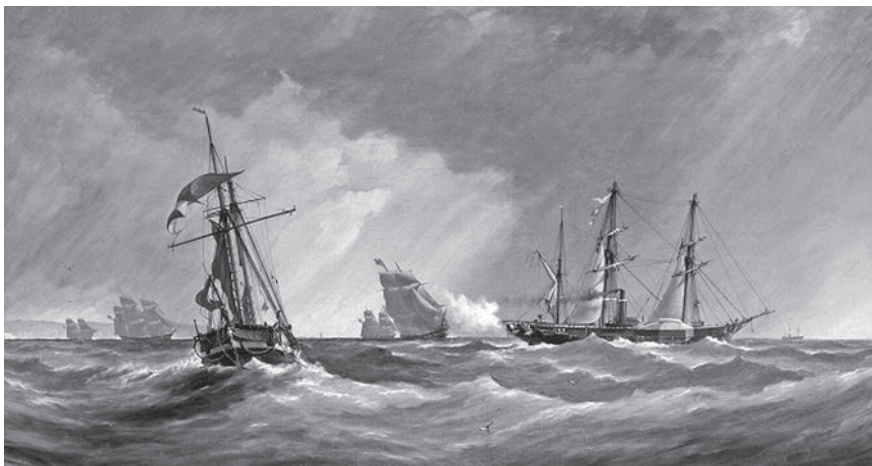
HMS Fury přivezla Stratforda do Konstantinopole

Stratford si takřka okamžitě prohlédl dvě na sobě nezávislé části ruské nóty. Ta, o kterou se v podstatě nezajímal, se týkala svatých míst. O tom, kdo má přednost, zda katolíci nebo pravoslavní ve chrámu Panny Marie, či kdo bude mít v držení klíče od něho nebo kdo opraví kupoli nad svatým hrobem se dalo dlouze diskutovat, ale pro následující vývoj podstatná nebyla.