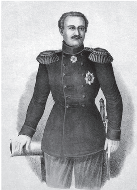
Generál P. A. Dannenberg

Co vlastně způsobilo ruský ústup? Kníže Gorčakov ve svém hlášení rozkaz vysvětlil: „Generál Dannenberg vida, že nejsme schopni dobýt místa bráněná nepřítelem, která se navíc nacházejí přímo pod ochranou