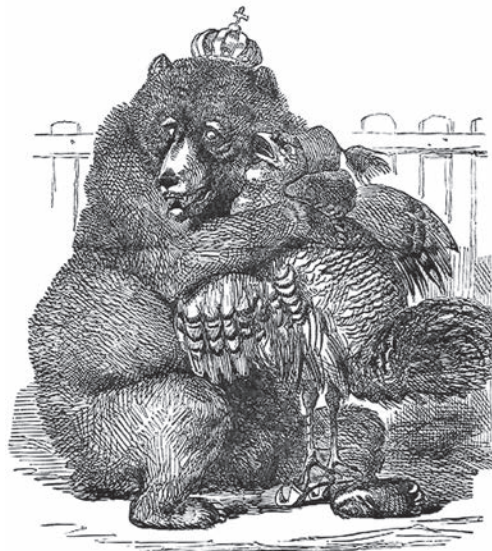
Turecký krocan v objetí ruského medvěda

Nejdříve vysvětlil car svůj postoj k francouzskému králi těmito slovy: „Ludvík Filip je pro Evropu požehnáním, s tím upřímně souhlasím. Ale já nikdy nebudu jeho přítelem... Vždyť aby si získal svou pozici a udržel se v ní, pokusil se podkopat naopak mou jako ruského vládce a to mu nikdy nezapomenu.“