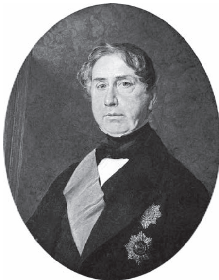
Diplomat George H. Seymour

„Určitě vás seznámili s plány a sny, kterým se oddávala Kateřina Veliká,“ začal rozhovor car poté, co srdečně přivítal Seymoura v Zimním paláci. „Ty platí stále, až do dnešních dob... I když jsem zdědil obrovská území, nezdědil jsem tyto sny, přesněji záměry, pokud byste je tak chtěl nazývat. Naopak, moje země je tak rozsáhlá, takže díky těmto šťastným okolnostem by v každém případě bylo asi nerozumné si přát více území nebo moci než vlastním. Naopak, asi budu první, který bude tvrdit, že pro naši zemi by možná jediné nebezpečí vyplynulo z rozšíření impéria, které je už tak příliš velké.“