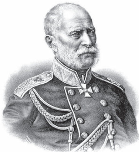
Kníže A. S. Menšikov na litografii A. S. Borela

Jeho Jasnost kníže Alexandr Sergejevič Menšikov patřil mezi „schopné“ sběratele titulů a prebend. Narodil se 26. srpna 1787 a zemřel 2. května 1869. Funkcí za svůj bohatý život nastřádal požehnaně. Byl generál, admirál, co se nikdy neplavil po mořích. Dvacet let, od roku 1836 až do roku 1855, byl ministrem námořnictva ruského impéria. Po celou dobu působení jen dokázal vynikajícím způsobem hrát na nervy zkušeným námořníkům svou absolutní neznalostí námořnického „řemesla“. Takřka souběžně v letech 1831 až 1855 vykonával funkci generálního gubernátora Finska, ale nikdy se o zemi, ve které měl zastupovat Rusko, nijak nezajímal. Jeho vztah k Finsku tak trochu připomínal „turistu ve vlastní zemi“.