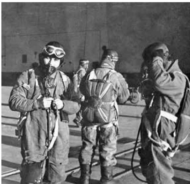
Příprava čs. pilotů k letu na základně v Chartres

slabým pilotem. Později, po příjezdu do Anglie, tyto skutečnosti nahlásil i svým nadřízeným. To mohl být následně i důvod toho, proč Přeučil na britských ostrovech nebyl zařazen k operačním jednotkám. Výsledkem jeho kázeňských problémů ve Francii bylo přeřazení od letectva k Náhradnímu tělesu v Agde, k němuž došlo 4. června 1940. 38 Přes tyto výhrady k jeho služební činnosti byl již k 1. květnu 1940 povýšen na četaře. 39