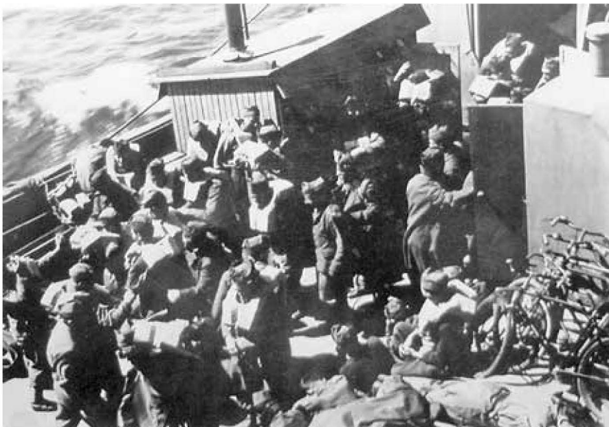
Evakuace čs. jednotek z Francie v červnu 1940

„Podepsaní v připojeném seznamu prohlašují dobrovolně, bez jakéhokoliv nátlaku, při dobrém vědomí a na svou čest, že setrvají v boji