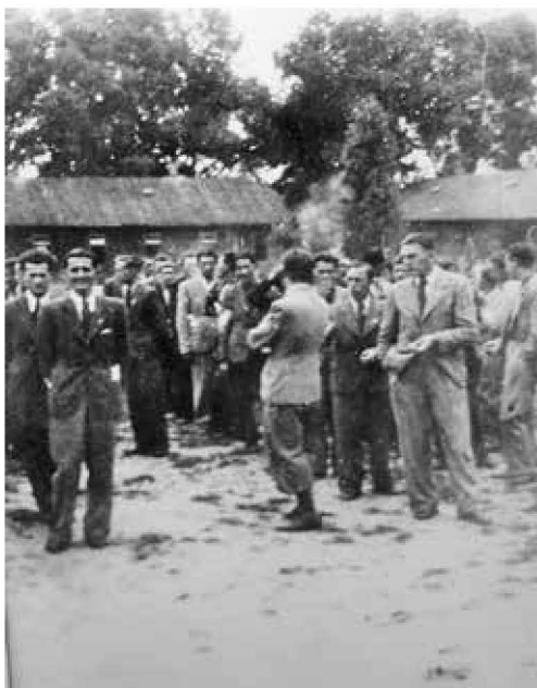
Příslušníci čs. vojenské jednotky v Malých Bronowicích u Krakova, 28. července 1939

byl jen pouhý pozdrav a že v dopise žádné informace neposílal, jiná, také poválečná svědectví ze zdrojů pražského gestapa (J. Chalupského) potvrzují, že v šifrované formě poslal na obyčejné pohlednici konkrétní údaje o počtu letců v bronowickém táboře. Pohlednice s pozdravy poslal také rodičům, nejprve z Krakova, poté z Gdyně na cestě na Západ a konečně třetí už z Francie.