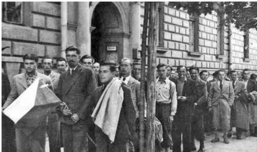
Dobrovolníci, kteří uprchli z protektorátu do Polska, před čs. konzulátem v Krakově

Aby se předešlo podobným komplikacím, musel při následujících transportech podepsat každý odjíždějící již v Krakově závazek tohoto znění: „Zavazuji se, že po příjezdu do Francie vstoupím do cizinecké legie, jestliže z jakýchkoliv důvodů nebude možno mne zařadit do jiné části vojska. Současně беру na vědomí, že jestliže tento závazek nedodržím, budu odeslán přes německou hranici domů.“ 18 Stav vojenské skupiny však nově příchozími rychle narůstal a transporty do Francie tak musely pokračovat i nadále.