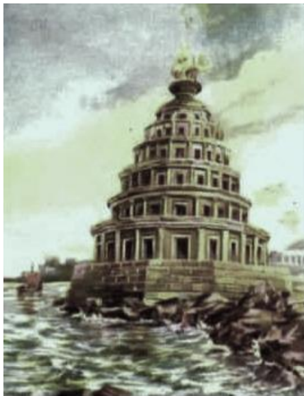
Maják na ostrově Faros, jeden ze sedmi divů světa

naproti alexandrijského přístavu, který byl řazen mezi sedm divů světa. Vzhledem k velmi zajímavé strategické poloze, prožilo město během staletí velmi složitou historii. Po nacionalistické revoluci v roce 1952 a svržení monarchie nechal prezident Násir ze země vyhnat Brity a Francouze a zkonfiskoval jejich majetek. Státisíce jich opustily město a s nimi i Řekové, Arméni a Židé. Postupně se však úbytek obyvatelstva zacelil a dnes Alexandrie je velkoměstem s více než pěti miliony obyvatel. Zaniklou atmosféru koloniálního města dnes připomíná jen architektura.