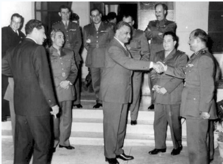
Gamál Abd an-Násir se dohodl se Syrskou delegací o vytvoření federace

cí půjček), hospodářsky (např. přítomností odborníků z východního bloku), ale i vojensky (zbrojními dodávkami). Významný byl podíl Československa na dodávkách zbraní a vojenských, ale i jiných odborníků. SSSR investovala mimo jiné výstavbu Asuánské přehrady, čímž ovšem sledovalo politické cíle .