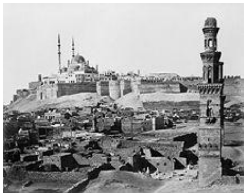
Citadela vybudovaná v letech 1176-1183