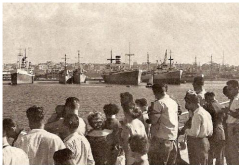
Námořní přístav v Alexandrii

Jenže, čím více jsem jich obdarovával sladkostmi či různými drobnostmi, tím to bylo horší. Řídily se zásadou, že když někdo jim podá prst, mohou získat celou ruku. Ostatně, byly velmi roztomilé. Jenže, do Alexandrie jsem přijel, abych ji trochu poznal, ne abych studoval mentalitu arabských dětí. Unaven tímto doprovodem, zatoužil jsem na jednom místě u pobřežního opevnění vykoupat se v moři. Ale jak to udělat, abych nepřišel o celý svůj skromný majetek? Měl jsem však štěstí. Přiběhl jeden arabský voják a slíbil, že mi věci pohlídá. Potom zase já jemu. Uvěřil jsem mu a tak se nám podařilo oběma, že jsme se vykoupali. Děti nyní seděly kolem nás dvou, nedutaly a ani se nehnuly. Byl to asi pro ně nepředstavitelný zážitek.