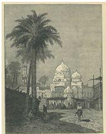
Fustat, mešita a tržiště

Káhira je hlavní město Egypta a největší město v Africe a v arabském světě. Pro svou převahu islámské architektury je také přezdíváno „Město tisíce minaretů“. Již dlouhou dobu je centrem regionu politického a kulturního života. Dnešní Káhira byla založena na území několika důležitých osad někdy ke konci prvního tisíciletí našeho letopočtu. Z nich nejvýznamnější byly Memphis, ústřední bod starověkého Egypta, pevnostní tvrz Babylon postavená Římany a Fustat, dlouhou dobu regionální centrum Islámu. S populací kolem sedmi mili-