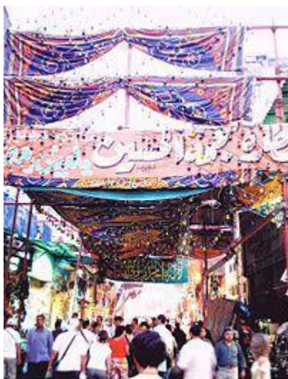
Bazar Khan - e- Khalili