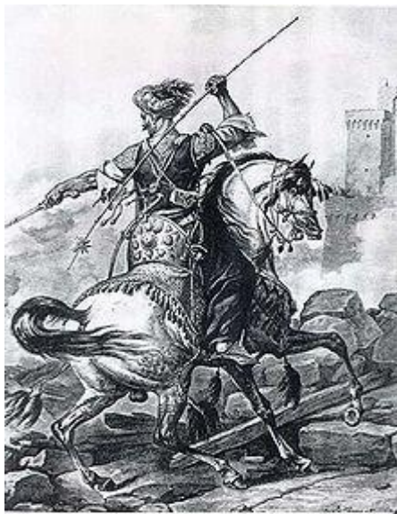
Otoman Mamluk, 1810, Carle Vernet

Všude kolem bylo vidět, že zde panuje napětí. Na ulicích vojáci v plné zbroji s připravenými automaty, za každým výkladem a ve všech novinách na první stránce nebojácný prezident Násir. Nebo také Izrael coby sedmihlavý drak, který požívá Egypt a další arabské země. Ptali jsme se našeho arabského průvodce, co to znamená. Odpověděl: