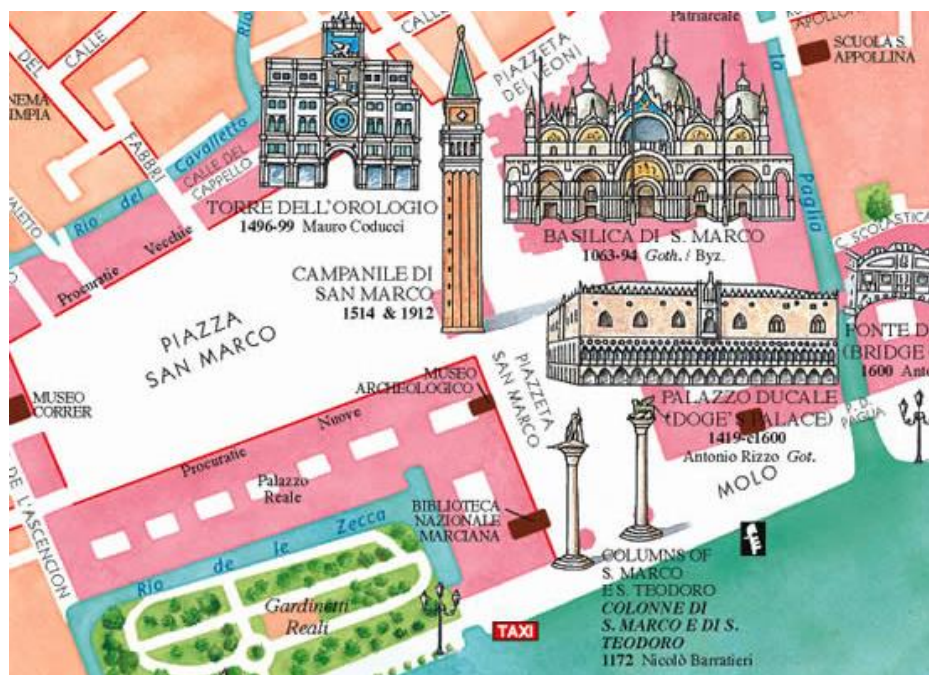
Obrázek: Mapa nám. sv. Marka a okolních budov

Hlavní část je samotná Piazza (náměstí) di San Marco – tedy hlavní náměstí, kterému vévodí bazilika sv. Marka a je lemováno dvěma řadami budov, zvanými Procuratie Vecchie a Procuratie Nuove . Samotné náměstí uzavírá tzv. Ala Napoleonica nebo též Královský plác (dnes Museo Correr ). Náměstí sv. Marka je jediným místem, které používá v Benátkách název náměstí. Ostatní se jmenují Campo (plácek), nebo Piazzeta (náměstíčko).