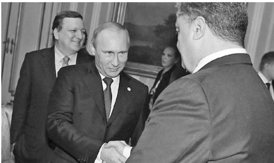
Stisky rukou a lišácký úsměv: Vladimír Putin a Petro Porošenko v Minsku.