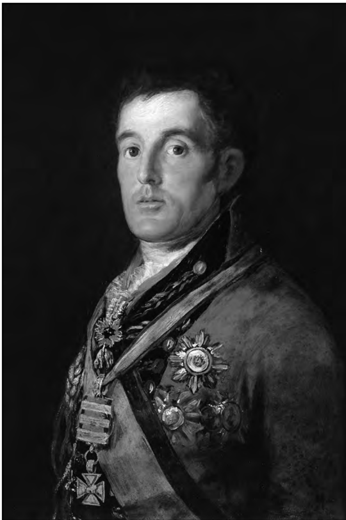
„Vévoda z Wellingtonu“, obraz Franciska Goyi. Když byl vévoda roku 1814 tázán, zda lituje, že se dosud s francouzským císařem neutkal v bitvě, odpověděl: „Nelituji, naopak jsem tomu velmi rád.“ Pobrdal Napoleonem jako člověkem, ale obdivoval ho jako vojáka.