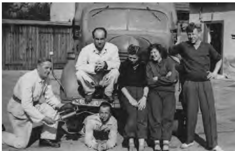
Táta u hasičů