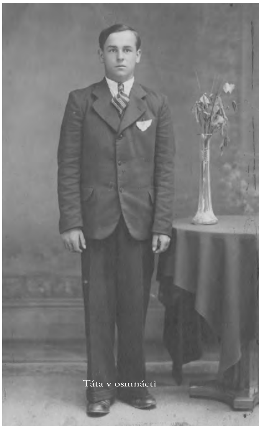
Táta v osmnácti