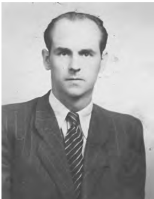
Táta v Úpici