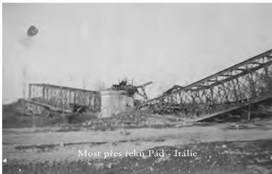
Most přes řeku Pád - Itálie