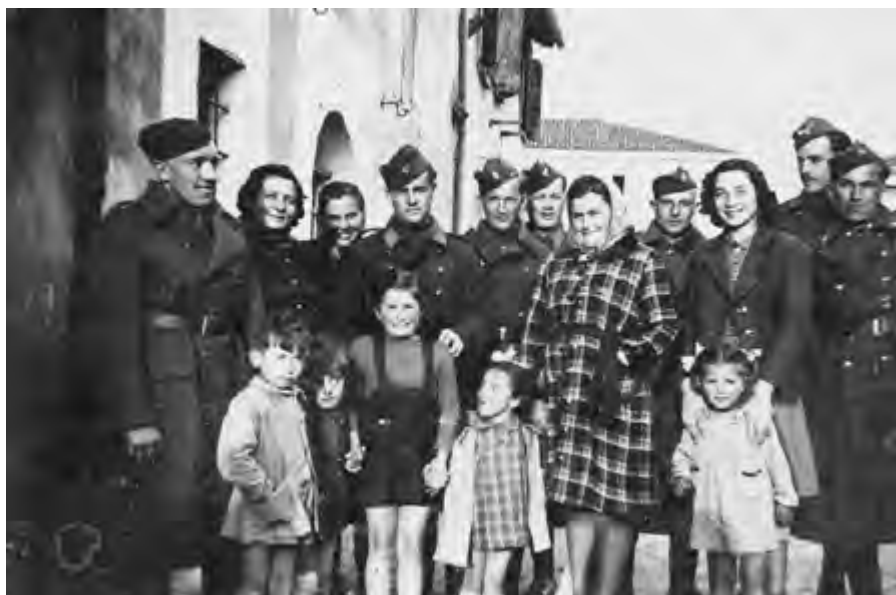
Itálie v zajetí