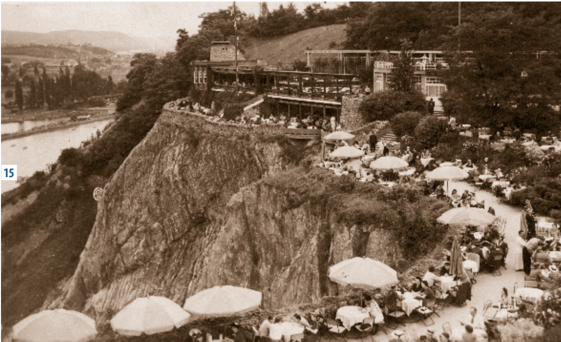
15 Trilobit bar ve svých začátcích...