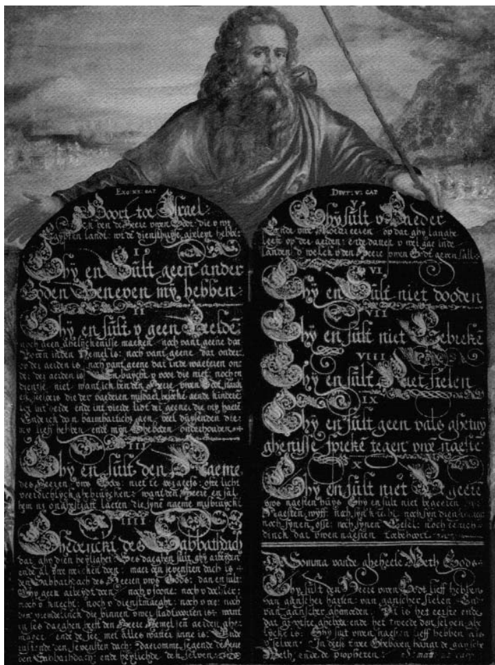
Mojžíšovo Desatero je dodnes základním věroučným kánonom jak pro Židy, tak křesťany.

O obrovském významu této legendární starozákonní osobnosti pro židovský národ a jeho kulturu svědčí tato tři zásadní fakta: