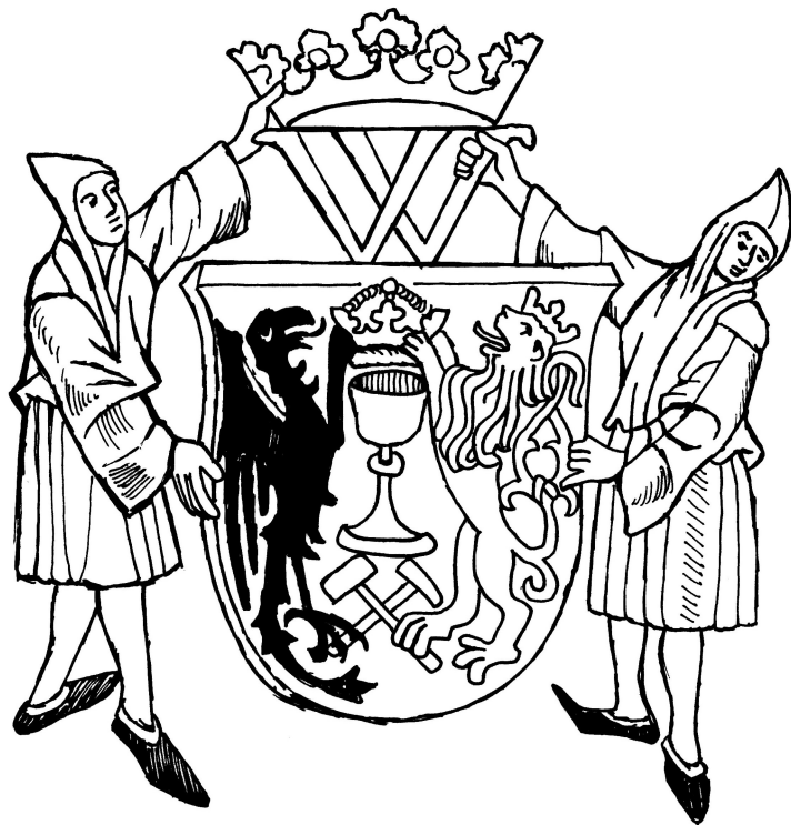
Miniatura z Kutnohorské bible, na níž horníci v perkytlích drží kutnohorský městský znak z 15. století. Kutnohorští měšťané si na něj bez souhlasu pánovníka přidali kalich.

O vzniku první části názvu* tohoto města existují dvě legendy. Podle údajné Libušíny věštby je odvozena od kutání horníků , zatímco podle ji-