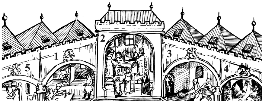
Ukázka z Kutnohorské iluminace zachycující nejdůležitější provozy kutnohorské mincovny.

V této souvislosti je velmi zajímavá tzv. Kutnohorská iluminace , která zachycuje těžbu rudy, její drcení, promývání, prodej rudokupcům a hutnění, díky němuž se z rudy získává stříbro sloužící k ražení mincí. Jde zřejmě o nejstarší dochované vyobrazení zmíněného celého technologického procesu, který probíhal v Kutné hoře od 13. do 17. století a z nějž nabízím alespoň výřez.