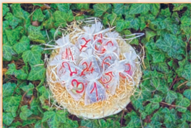
Látkový adventní kalendář