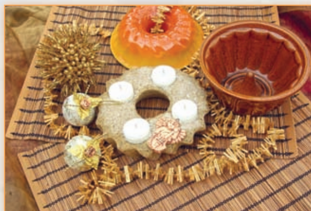
Pískový adventní svícen