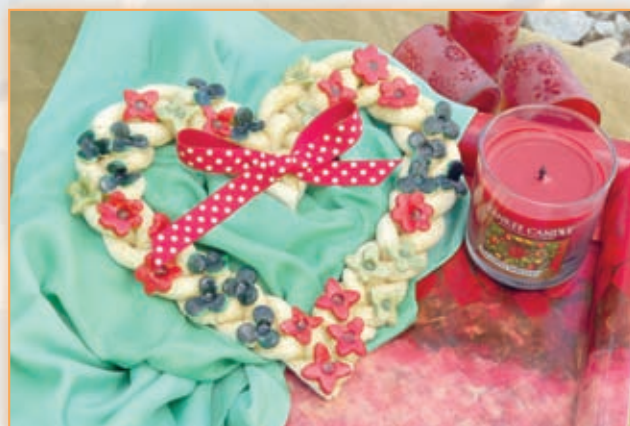
Srdce ze slaneho testa