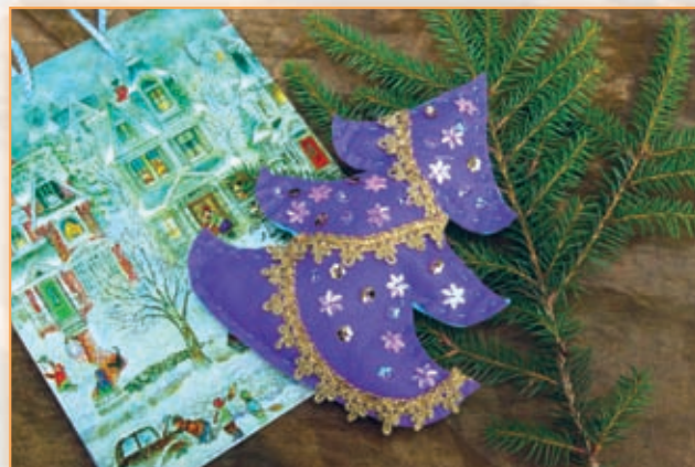
Stromeček z plsti