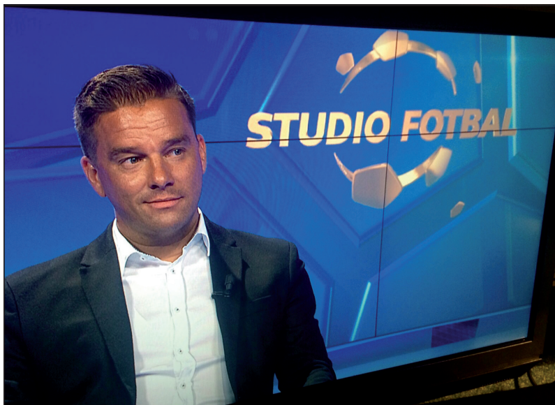
Jako fotbalový expert ve studiu ČT Sport