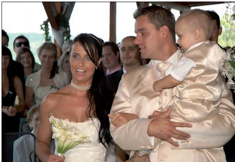
S Luckou jsme měli svatbu 6. června 2008 na Brněnské přehradě. Daneček už byl na světě.