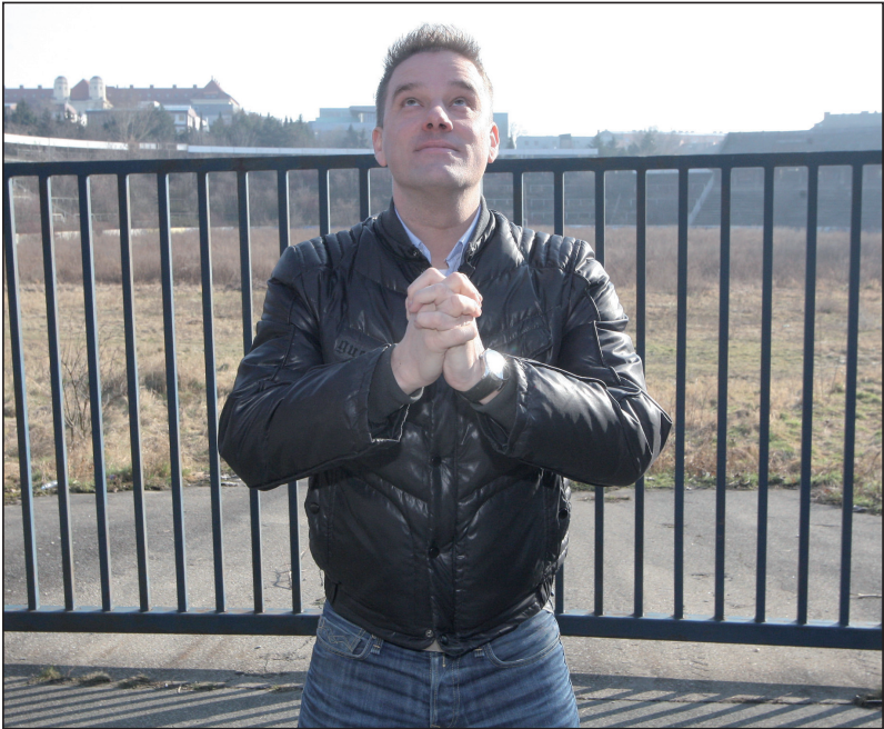
Modlení za rozlučku s kariérou na zchátralém stadionu za Lužánkami