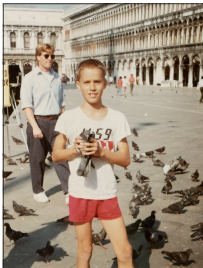
Během fotbalového turnaje v Itálii