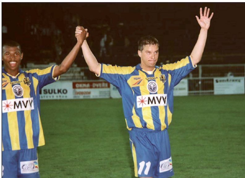
V Opavě jsem za sezónu nastřílel 20 gólů.