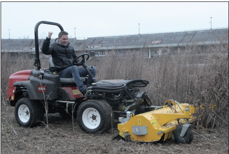
Dalo nám to hodně práce...