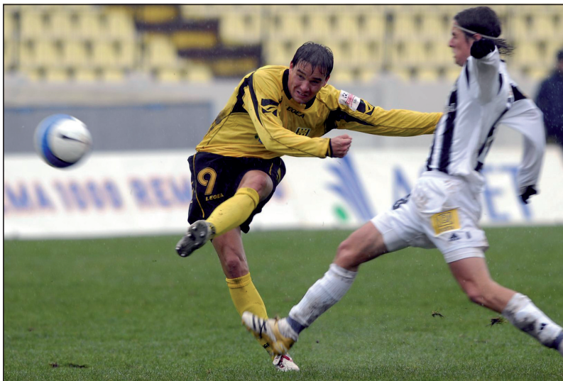
Na Slovensku jsem vydržel jen půl roku.