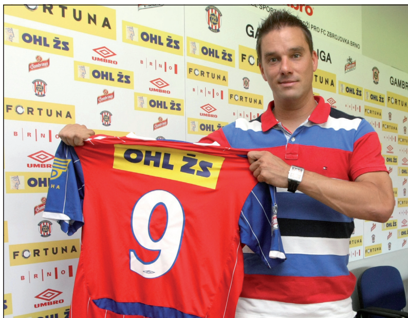
Léto 2011 a další návrat do Brna