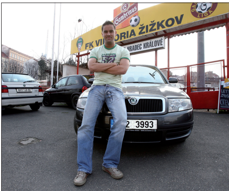
Rok 2007 a návrat do Prahy