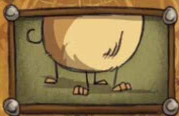
KERBÍK PEKELNÝ PES