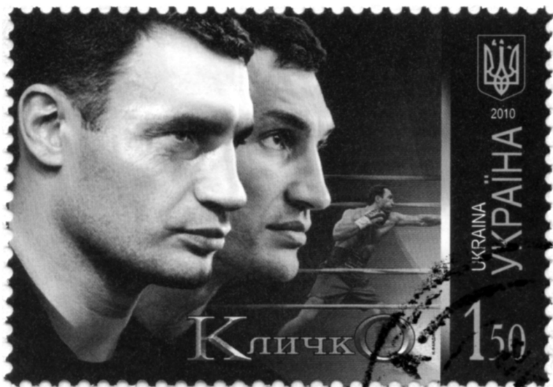
Vitalij a Vladimír Kličkové na ukrajinské poštovní známce z roku 2010

Bratři Bluesové...? Podívejme se na to pořádně. Kličkové těžší z odvěkého mýtu o dvou bratrech, který je v každém člověku hluboko zakořeněn. Profitují z toho, že toho mýtu velmi účinně využívají. Pro každého soupeře je přítomnost druhého bratra skličující, je to noční můra: jsou totiž pořád dva. A když jsou dva, jsou neporazitelní – jeden vyvažuje nedostatky toho druhého, a pokud jeden stojí v ringu, je tu s ním i ten druhý. Cítíte, že ačkoli nad jedním vyhrájete, budete muset poslat k zemi i toho druhého.