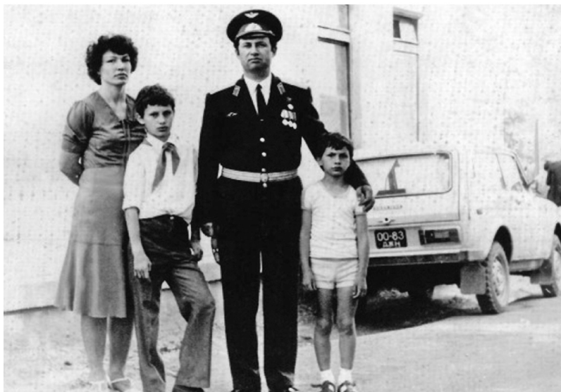
Rodina Kličkových kolem roku 1980

Můžeme se domýšlet, jaké další věci provázejí jejich dětství. Brutální, holá krajina, bezútěšnost vojenských základen, nepříznivé přírodní podmínky a nezdravé podnebí. Tenhle svět není zrovna místem stvořeným pro děti.