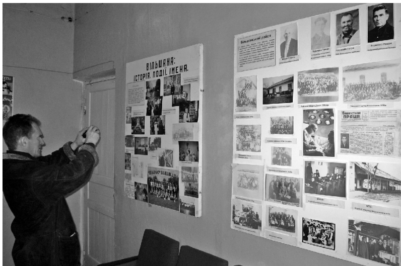
Muzeum ve Vilšanech dokumentuje historii Kličkových daleko do minulosti.

ve Vilšanech, kterého se zúčastnil, dozvěděl hodně nového. A třeba i tušil, proč se jejich otec nechal pohřbít raději na malém hřbitůvku v obci Gnydin po boku své tchyně Bulinové, a ne na nějakém pompéznějším místě a s patřičnými poctami mocných.