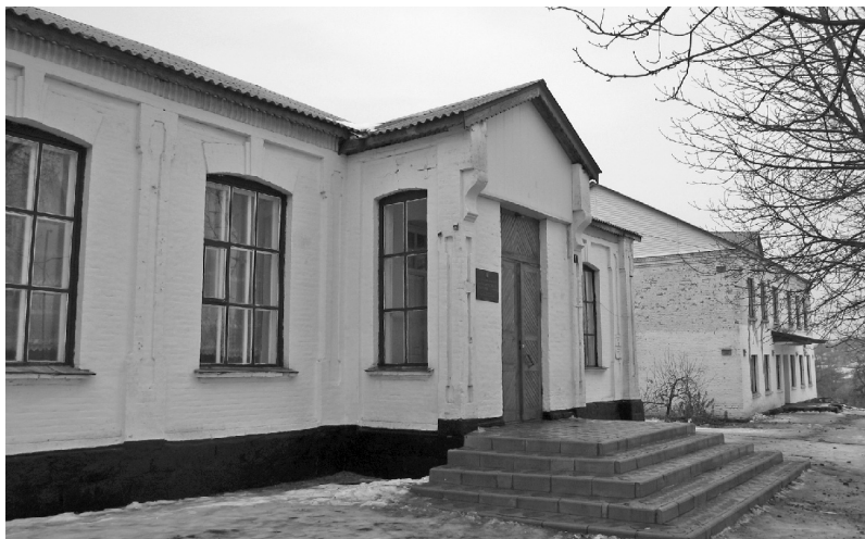
Muzeum bratrů Kličkových ve vesnici Vilšany severně od Kyjeva

Vesnice Vilšany (rusky Olšany) leží 180 kilometrů severně od hlavního města Ukrajiny. Od těch dob, co začali být bratři Klič-