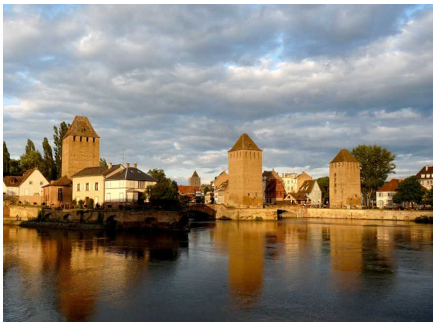
Štrasburk, Vaubanova hráz

V katedrále Notre-Dame, na pozvání kardinála Ludvíka Rohana, od roku 1769 působil český skladatel a hudebník František Xaver Richter jako kapelník chrámového orchestru. Větší část duchovní hudby napsal právě zde, mnoho jeho rukopisů je uloženo hned vedle, v Grand Séminaire. Ke stému výročí připojení Štrasburku ke Francii, roku 1781, zkomponoval slavnostní Te Deum . Kromě pravidelné chrámové hudby také řídil koncerty v blízkém Rohanském paláci, Richter zemřel ve Štrasburku roku 1789, těsně po začátku Revoluce