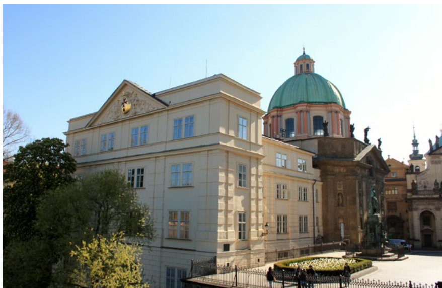
Kostel svatého Františka z Assisi

naštěstí zůstal natrvalo. Dvorní intriky způsobily, že Barrande raději dvůr opustil a začal pracovat jako stavební inženýr na vyměřování koněšprežné dráhy z Prahy do křivoklátských lesů. V roce 1833 pod Dívkými hrady u Zlíchova našel první silurské zkameněliny, které ho natolik zaujaly, že je začal systematicky sbírat, a výsledkem jeho celoživotního bádání je 24svazkové dílo Système silurien du Centre de la Bohême . Díky finanční podpoře svého bývalého žáka, hraběte ze Chambordu, mohl své dílo začít vydávat tiskem. Barrande původně bydlel na Malostranském náměstí, v domě u Splavínů, ale v roce 1845 se přestěhoval na Újezd do rohového domu čp. 419, kde je dnes také umístěna jeho busta. Domácnost starému mláďenci obstarávala „madame Babette“, kterou znal již z dřívější doby, když ještě na Hradě sloužila jako pokojská vévodovi de Guiche. Byla to matka Jana Nerudy. Barrande svou osobností Jana Nerudu bezpochyby ovlivnil. Ten se na jeho radu naučil francouzsky a jako mladý žurnalista se v květnu 1863 vypravil na studijní pobyt do Paříže. Své zážitky z procházek městem i ze setkání s krajany bezprostředně zasílal do redakce pražských novin Hlas, o rok později také vyšly knižně pod názvem Pařížské obrázky . Jedna z jeho vzpomínek na Paříž se znovu promítla do fejetonu, který vyšel v dubnu 1865 v Hlasu. Neruda v něm navrhuje postavit na Petříně gloriety ze dřeva a kamene, ze kterého by byla krásná vyhlídka na město: