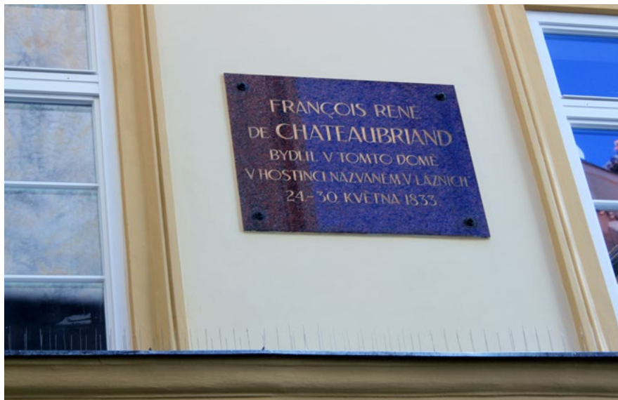
Pamětní deska na bývalém hotelu v Lázeňské ulici

Nedaleko odtud Na Příkopech, na rohu Panské ulice, stával hotel „U modré hvězdy“, kde se v roce 1846 ubytoval skladatel a dirigent Hector Berlioz . V restauraci vedlejšího hotelu „U tří lip“ se pak konal velký banket k počtě jeho provedení Romea a Julie . Pražané Berliozovi tehdy na rozloučenou věnovali stříbrný pohár. V hotelu „U černého koně“ zase v lednu 1882 bydlel