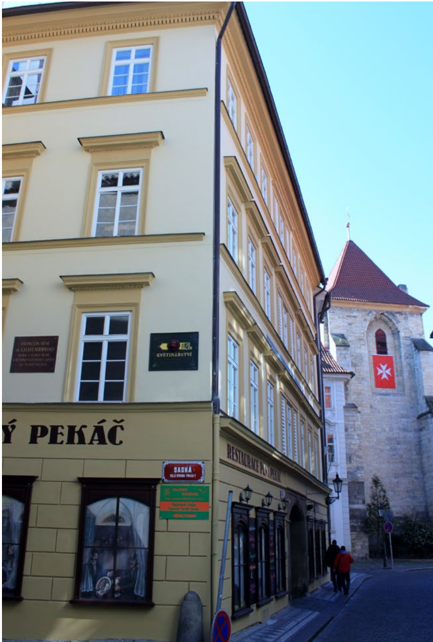
Dům na rohu Saské a Lázeňské ulice