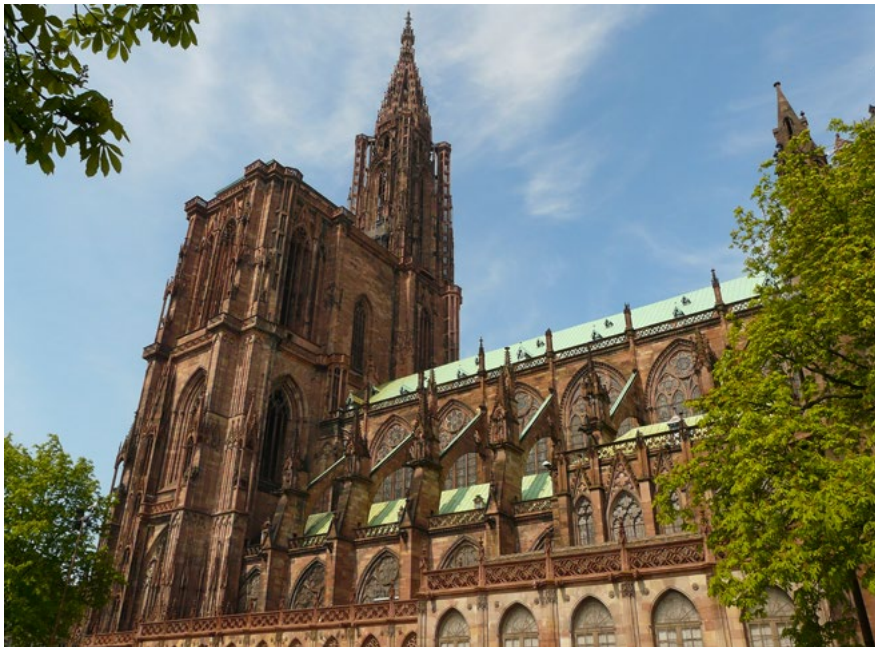
Štrasburk, katedrála Notre-Dame

Pýchou Štrasburku je gotická katedrála Notre-Dame. Ve slunečních paprscích nejlépe vynikne barva narůžovělé žuly z Vogéz, ze které byla stavěna od roku 1176 zhruba tři století. Západní průčelí je zakončeno pouze jedinou věží, vysokou 143 metry, a jeho výzdoba patří k nejcennějším památkám francouzské gotiky. Ke konci 14. století v čele stavební huti katedrály Notre-Dame stanul Michal z Freiburgu, pravděpodobně bratr stavitele svatovítské katedrály Petra Parléře. Během krátké doby (1383–1387) vystavěl tzv. westwerk (západní průčelí kostela) a základ oktogonu severní věže se schodištěm. Věž pak ozdobil velkými sochami krále a mnicha, které údajně znázorňují českého a římského krále Václava IV. a samotného stavitele. Pod jménem Michel Böhem je v literatuře navíc uváděn jako řezbář a tvůrce velké dřevěné sochy Krista nesoucího kříž, která byla umístěna ve štrasburském dómu.