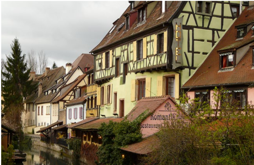
Colmar, Malé Benátky

Smlouva mezi oběma králi nakonec nebyla uzavřena. O rok později v září 1304 se Petr z Aspeltu vydal tajně do Francie, aby znovu jednal o navázání spolku proti Albrechtovi, ale ve Švábsku byl zajat. Václavovy listy mu byly odňaty a Petr navzdory své hodnosti basilejského biskupa byl několik měsíců vězněn. Do českého království se opět vrátil až s Janem Lucemburským. Thiébaud de Ferrette žil ještě několik let a byl pochován ve františkánském kostele ve starém Thannu, na jehož místě dnes stojí nemocnice. S tímto rodem se však setkáme v našich dějinách ještě jednou. Thiébaudova vnučka Jeanne, poslední dědička panství v přímé linii, se stala ženou Albrechta Moudrého (syna Albrechta I. Habsburského, proti němuž kdysi Thiébaud bojoval) a dva ze čtyř jejich synů se stali zeti císaře Karla IV. Rudolf IV. si vzal Kateřinu Lucemburskou a Albrecht III. zase Alžbětu Lucemburskou.