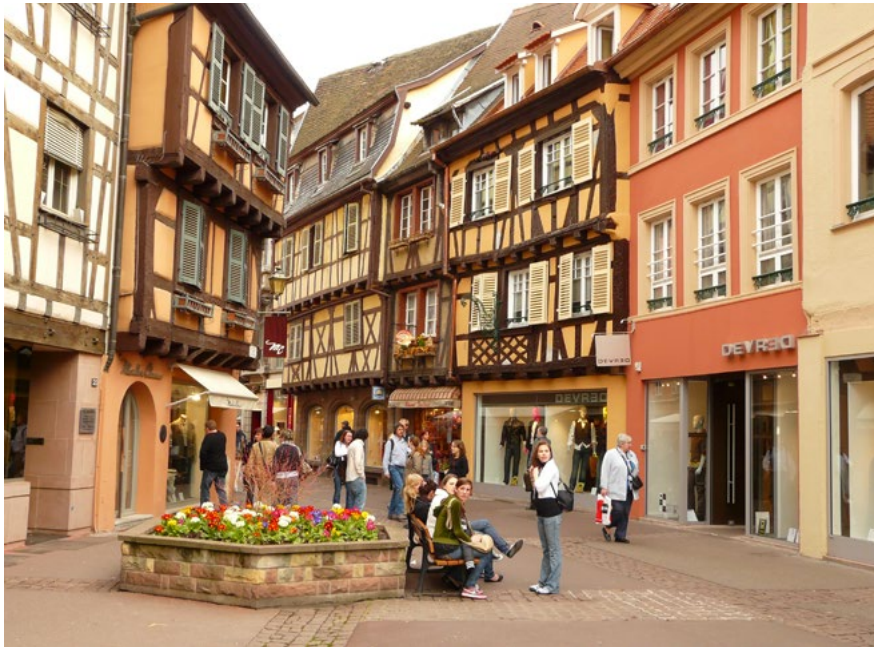
Kolmar, na pěší zóně

muzea byl zcela náhodou nalezen kus pláště, který údajně patří Mistru Janu Husovi. Provedené testy potvrdily, že látka skutečně pochází ze středověku.