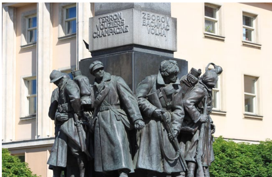
Zitkovy sady, legionářský pomník

Naopak jméno Praha se objevuje v mnoha francouzských městech – Avenue de Prague je v La Rochelle, Boulevard de Prague je v Nîmes, Impasse de Prague v Lille, Place de Prague v Nantes, Rennes a Lezoux, Quai de Prague v Orléans, Rue de Prague v Agde, Amiens, Belfort, Bobigny, Colmar, Colombes, Drancy, Guegnon, Lorient, Narbonne, Noisy-le-Grand, Paris, Perpignan, Saint-Brieux a Salon-de-Provence.