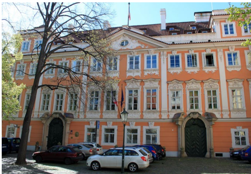
Buquoyův palác, Francouzské velvyslanectví

Součástí gotického paláce Pražského hradu byla také kaple Věch svatých, kterou v 70. letech 14. století stavěl Petr Parléř. Dvouposchoďová dispozice stavby byla patrně volnou inspirací Sainte-Chapelle v Paříži, kterou Karel IV. tak dobře