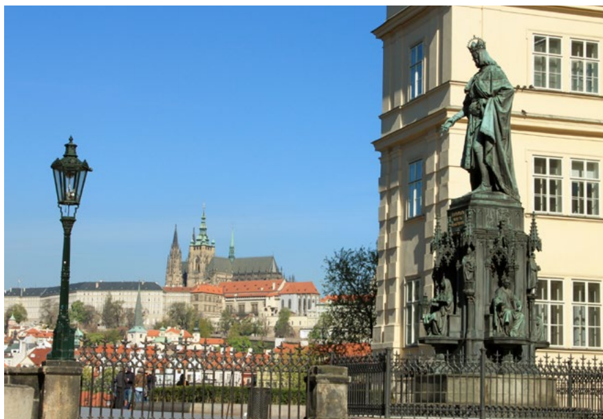
Pražský hrad a socha Karla IV.

Pádným důvodem pro neodkladné zahájení stavby bylo očekávané povýšení pražského biskupství na arcibiskupství, které brzy měli od papeže získat. Matyáš pravděpodobně přijel do Prahy nejprve na obhlídku staveniště, aby pak vypracoval stavební plán chóru, inspirovan jihufrancouzskými katedrálami ve městech Narbonne a Rodez . Základní kámen chrámu byl slavnostně položen dne 21. listopadu 1344 za přítomnosti Jana Lucemburského, jeho dvou synů Karla i Jana Jindřicha a nově jmenovaného arcibiskupa Arnošta z Pardubic. Během dalších osmi let stačil Matyáš z navrženého chóru zbudovat pět kaplí závěru, dvě boční kaple na jihu a jednu boční kapli na severu s přilehlými poli ochozu i pilíři vysokého chóru s arkádami a zdívkou nad nimi až pod úroveň triforia. Pravděpodobně je i autorem půdorysného rozvrhu Nového Města pražského. Do Francie se už nevrátil a po své smrti byl pohřben na místě svého díla. Náhrobní deska s jeho jménem byla v roce 1928 nalezena v severním ochozu chrámu jako součást dlažby pod zpozdnicemi a přenesena do Valdštejnské kaple. Matyášovu přibližnou podobu známe z dolního triforia v katedrále, zbudované Petrem Parléřem, busta posloužila i jako předloha k menší soše na pomníku Karla IV. u křížovnického kostela sv. Františka.