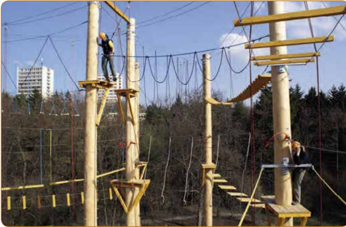
▲ Lanové centrum nabízí spoustu překážek