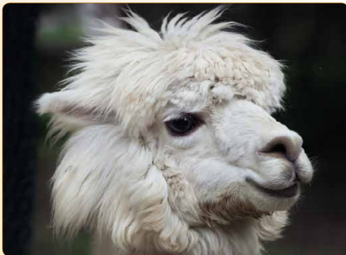
▲ V Lamacentru si lamy můžete i pohladit

V bývalém vápencovém lomu Džungle na Hádech na okraji Brna můžete každý víkend (a od listopadu do února pouze v neděli odpoledne) navštívit lamí farmu. Na lamy se nemusíte jen dívat, ale můžete si je také pohladit, nakrmit nebo vyčesat. Průvodci vás kromě lam seznámí i s místní vzácnou přírodou a zajímavou historií lokality. Než se sem vypravíte, nechte si poradit na webu Lamacentra, jak se sem dostanete – nabízí se totiž několik tras, některé vhodnější pro kočárky a jiné zase pro batolata, co už alespoň kousek chtějí ujit samostatně.