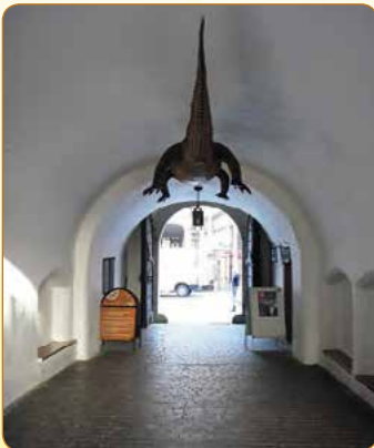
▲ Proslulý brněnský drak

Na radnici sídlí turistické informační centrum a galerie. V letní sezoně jsou k vidění historické sály a také 63 metrů vysoká věž s vyhlídkovým ochozem. Vstupenky seženete v informačním centru a po jeho uzavření v pokladně v prvním patře vyhlídkové věže.