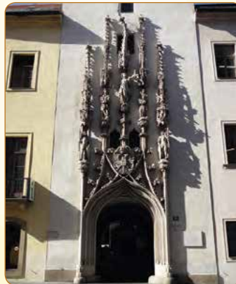
▲ Portál Staré radnice se zakřivenou věžičkou