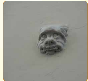
▲ Je to pes, nebo trpaslík? Kdepak, jde o zazděného radního, který prý chtěl Brno zradit nepříteli, a dočkal se proto zaslouženého trestu. Svrastělou tvářičku objevíte na zdi Staré radnice vlevo od průchodu do Mečové ulice, asi 4 metry nad zemí.