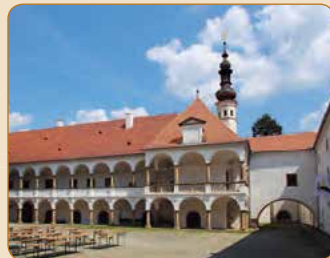
▲ Zámek Oslavany