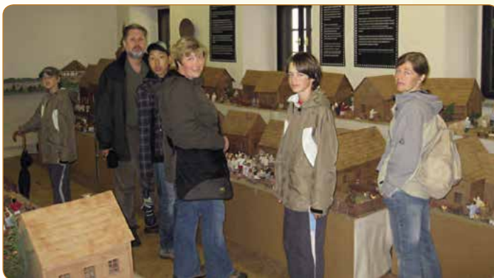
▲ Moravskou vesničku si užijete s celou rodinou.