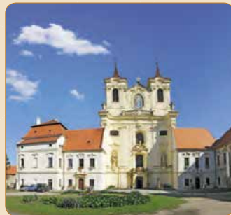
▲ Benediktinský klášter v Rajhradě

v případě hornického muzea je název slibnější než samotný obsah. Pokud ale budete mít cestu kolem, stavte se. Více na webových stránkách www.rosicko-oslavansko.cz v menu Expozice.