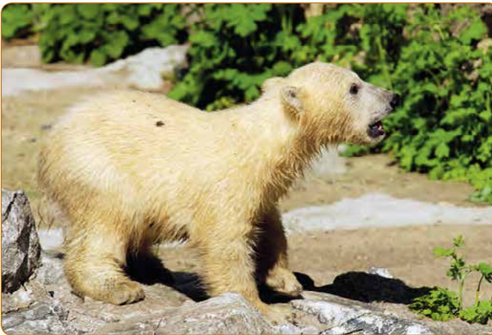
▲ V roce 2016 přivítala brněnská zoo další mládě ledního medvěda