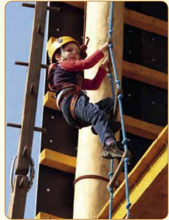
▲ Na své si přijdou jak děti, tak dospělí