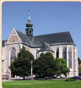
▲ Bazilika Nanebevzetí Panny Marie, která přiléhá k augustiniánskému opatství na Starém Brně