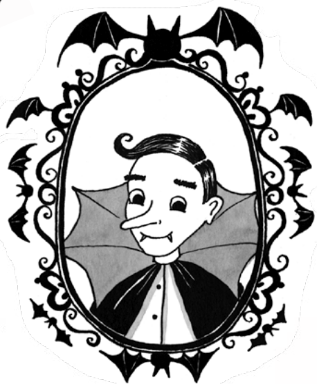
Můj tatínek hrabě Bartoloměj Měsíčekový