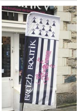
bretaňská vlajka u obchodu