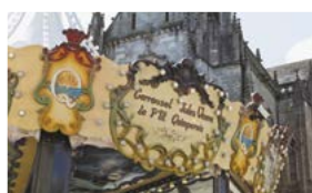
kolotoč Jules Verne