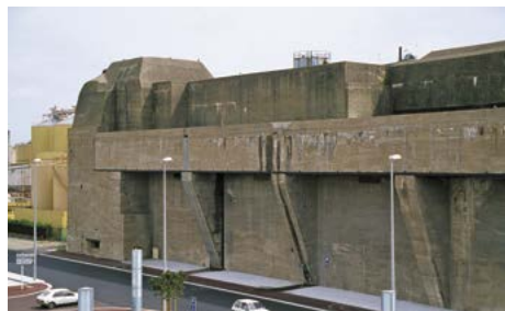
pohled na bunkry

Současné město nemá žádné historické památky, jeho historie se začala psát až po 2. světové válce. Že se jedná o přístav, zjistíme podle pobřežního majáku, k němuž se dostaneme, projedeme-li okolo jedné části původní zástavby.