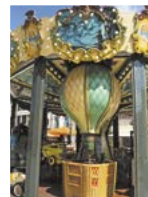
Pět neděl v baloně