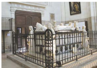
náhrobek v katedrále

Bývalá vstupní brána do města se dodnes nazývá „ Zlatá koruna “. Původní stavba pochází z doby vévody Františka II. Jeho dcera Anna Bretaňská ji však nechala zvýšit ještě o jedno patro. V 17. století pak proběhla celková rekonstrukce, takže dnes při pohledu na tuto památku jen těžko poznáme původní stavbu.