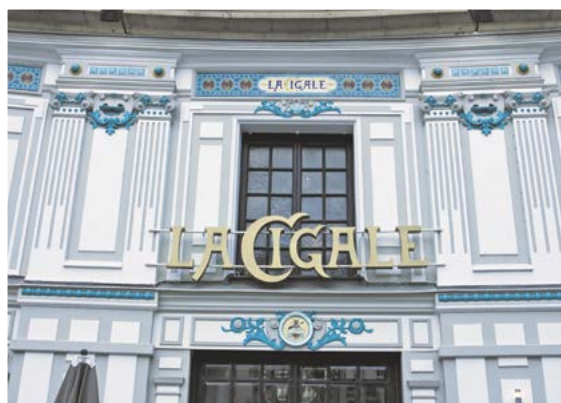
restaurace la Cigale