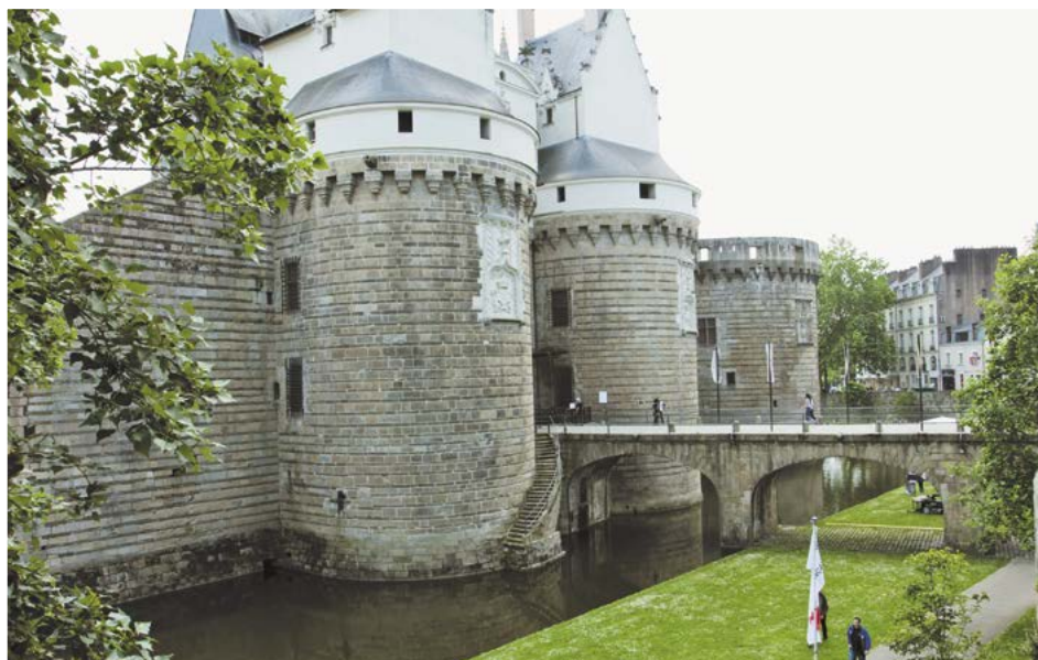
vstupní brána do hradu

Dnes zjistíme, že od dob Julese Verna se město dost změnilo. Ostrov Feydeau už není ostrovem, kanály mezi řekou Erdre a Loirou byly zasypany a řečiště řeky se proměnilo v bulváry, kde pulzuje každodenní život.