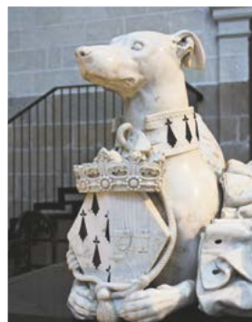
pes na náhrobku

Jedna z nich je velmi zajímavá. Na jedné straně je obličej ženy, na druhé straně obličej vousatého muže. Přední stranu náhrobku hlídá pes s obojkem, na němž jsou vyobrazeny hrnostaří ocásky.