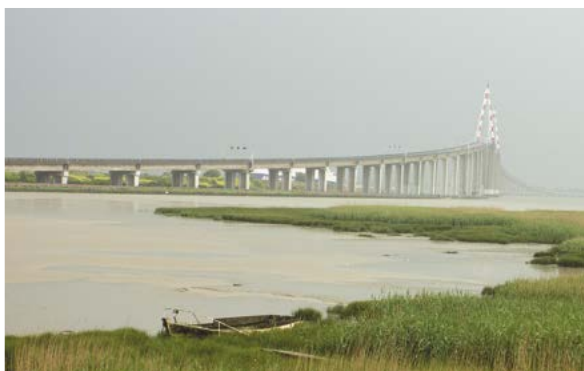
záliv s novým mostem

Bretaň je kraj spjatý s mořem, jež ho z větší části obklopuje. Možná právě proto nazval František Kožík tento nejzápadnější region Francie „Dcera oceánu“. Má rozlohu přibližně 30 000 km 2 , je o něco málo větší než Morava. Je to území, které se tak trochu vymyká představě, již o Francii všichni máme, jako by ani k Francii nepatřilo. I přírodní podmínky jsou tu odlišné. Často tu prší a fouká vítr, který bičuje společně s Atlantikem divoké skály. Hodně slunce, teplé moře, v letních měsících nekonečné řady automobilů s turisty, to tu zkrátka nenajdeme. Bretaň je středně rozvinutou oblastí Francie. Z celkového počtu 60 milionů obyvatel celé Francie tu žije pouze něco málo přes tři miliony. Přesto se jedná o 4. nejnavštěvovanější oblast Francie. Proč tomu tak je, to se určitě během našeho putování dozvíme.