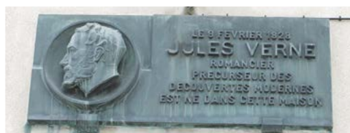
pamětní deska Jules Verne

A mají tu také slavného rodáka. 8. 2. 1828 se zde narodil Jules Gabriel Verne . Na domě v ulici Olivier de Clisson číslo 4 najdeme pamětní desku. Dodnes se jedná o oblíbeného a nejprekládanějšího francouzského autora. A má ještě jedno prvenství – je zakladatelem vědecko-fantastického románu.