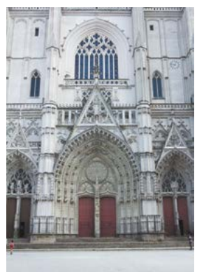
katedrála sv. Petra a Pavla