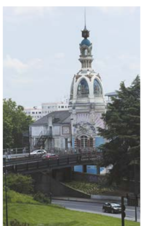
maják přístavní budovy