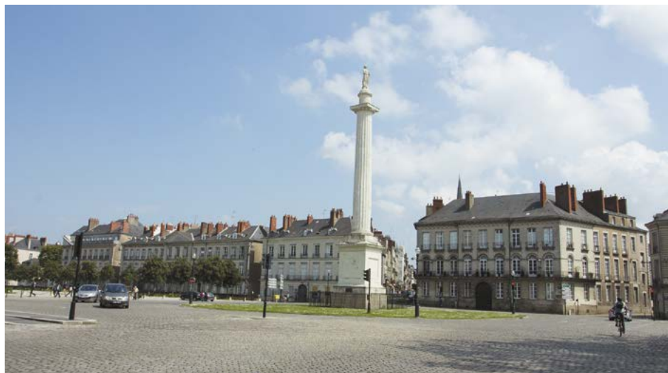
náměstí v Nantes

Naším cílem je objevování Bretaně, ale přesto nemůžeme opominout město a další zajímavé lokality, které dnes už do oblasti Bretaně administrativně nepatří. Znaky Bretaně jako vlajka a jiné se používají na celém území od Brestu po Nantes, jež reprezentuje Bretaň jako historickou, kulturní a tradiční a v minulosti byly s její historií pevně svázány. A jako první zmíníme Nantes , město, které bylo od 11. do 18. století správním střediskem Bretaně. Postupem času při různých administrativních změnách bylo v roce 1941 přeřazeno do regionu Pays de la Loire. Dodnes se místní obyvatelé pyšní tím, že město je vstupní branou do Bretaně. V minulosti k Bretani patřil ještě departement Loire-Atlantique, jehož dnešní hlavní město Nantes bylo hlavním městem Bretaně. Dnes je centrem Bretaně město Rennes. K rozdělení provincie na dva regiony – Bretaň a Pays de la Loire – došlo bohužel kvůli vzájemné rivalitě obou měst. Mnozí obyvatelé „staré“ Bretaně s tím však dodnes nejsou spokojeni a v roce 1980 založili organizaci Bretagne Réunion, která neúnavně usiluje o opětné začlenění města Nantes a celého departementu Loire-Atlantique do Bretaně. Proto také naše putování začneme právě v tomto departementu.