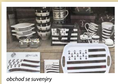
obchod se suvenýry

Je to černobílá vlajka „Gwenn ha Du“, která byla vytvořena v roce 1923. Pět černých pruhů symbolizuje stará biskupství: Dol, Nantes, Rennes, Saint-Malo a Saint-Brieuc. Čtyři bílé pruhy představují kraje Dolní Bretanë, kde byly dříve biskupské oblasti: Trégor, Leon, Cornouaille a Vannes. V levém horním rohu je jedenáct černých hranostajích ocásků na bílém podkladu. Někde se uvádí, že představují bretaňské vévodů. Hermelin je heraldický symbol, který se v Evropě vyskytuje už od pradávna. Zpravidla se zobrazuje jako kříž se třemi výstupy směrem dolů. Původně byl používán na výzbroji vévodů z Montfortu, postupně se změnil na hlavní charakteristický znak bretaňské symboliky. Dnes se vyskytuje ve znacích většiny měst. Můžeme ho vidět také na vývěsních štítech obchodů, které prodávají místní zboží, a na etiketách typických bretaňských suvenýrů.