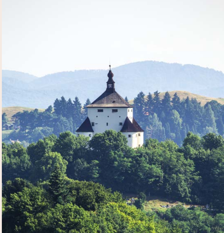
Nový zámok v Banskej Štiavnici

Web: www.banskastiavnica.sk , www.banskastiavnica.travel , www.muzeumbansko.sk , www.bajkomktajchom.sk