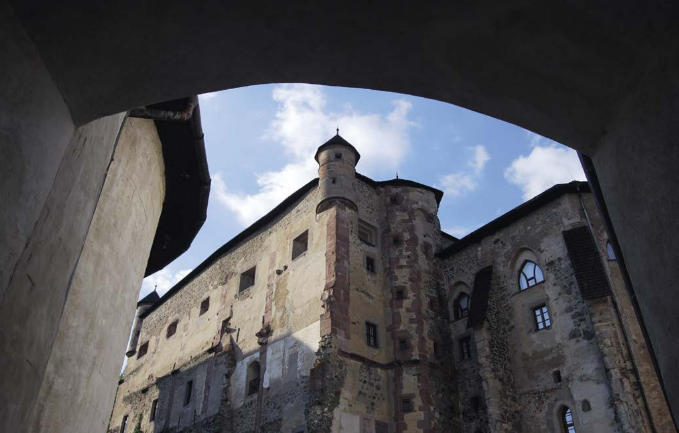
Pohľad na vnútornú časť Starého zámku.