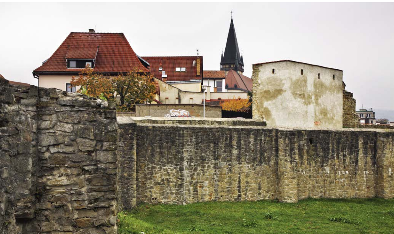
Mestské hradby Bardejova

uprostred námestia; väčšina z nich je súčasťou radovej zástavby lemujúcej námestie.