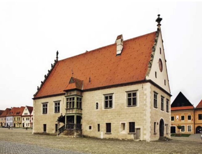
Bardejovská renesančná radnica

renesančný ráz. Od začiatku 20. storočia, kedy prebehli na radnici úpravy, slúži budova ako múzeum. Dnes v nej sídli Šarišské múzeum . Radnica je nielen pekná, ale v porovnaní s inými stredovekými radnicami aj tak trochu zvláštna. V európskych krajinách totiž nie je veľa radníc, ktoré by stáli osamotene