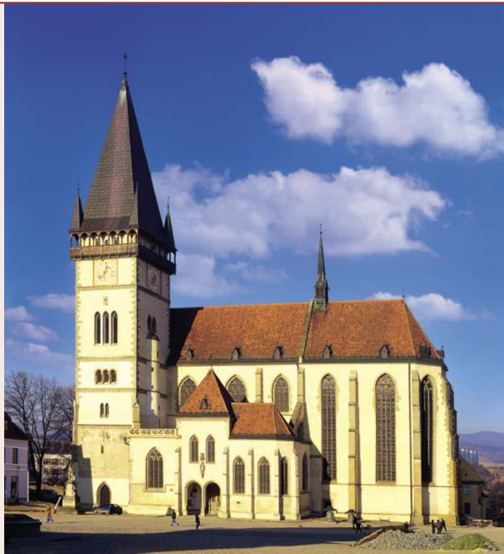
Kostol sv. Egídia

Web: www.bardejov.sk , www.e-bardejov.sk