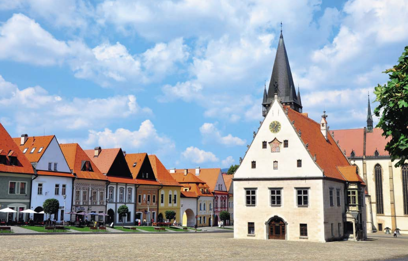
Historické námestie v Bardejove s renesančnou radnicou

Námestie – jadro stredovekého mesta – má obdĺžnikový pôdorys s rozmermi 260 × 80 metrov. Na troch stranách je lemované 46-timi meštianskymi domami so štítmi, ktoré majú gotický pôvod a neskôr boli čiastočne upravené v renesančnom štýle. Domy sú postavené tak, ako to bolo v stredoveku zvykom, na úzkych podlhovastých pozemkoch, často ústiacich do ulice paralelnej s osou námestia. V prednej časti domu sa nachádzal mázhaus (z nemeckého označenia starej objemovej jednotky mass, zodpovedajúcej 1,4 litra, a slova haus, t. j. dom). Mázhaus slúžil majiteľom, ktorí mali právo čapovať pivo, ako hostinec; v prípade, že bol majiteľ obchodník alebo remeselník, tak objekt slúžil ako obchod. Na mázhaus nadväzovali v prízemí dielne alebo sklady, prípadne dvor. Obytná časť domu sa nachádzala na prvom poschodí. Táto štruktúra domu