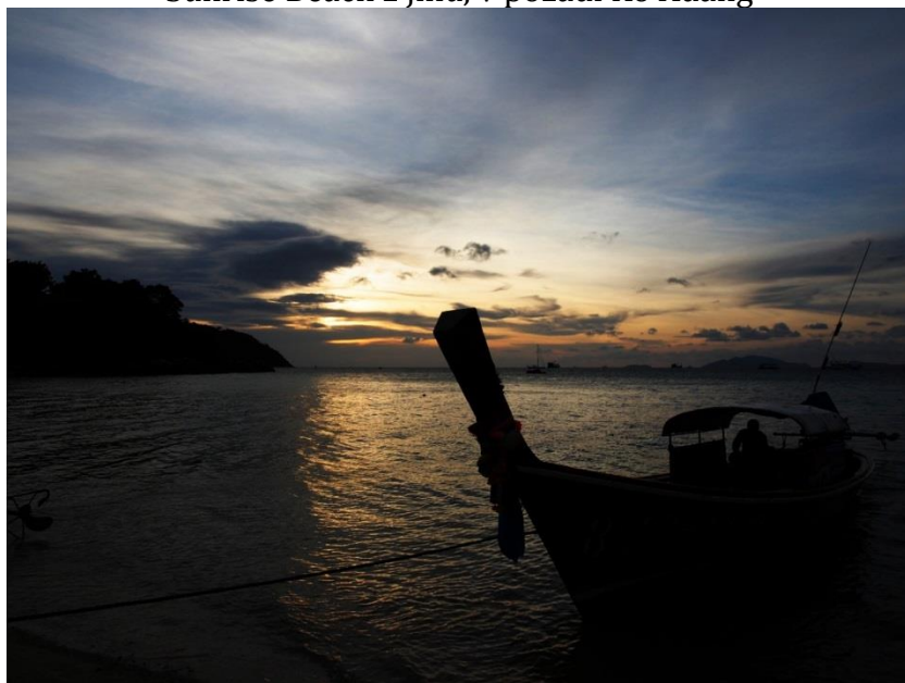
Západ slunce na Sunset Beach