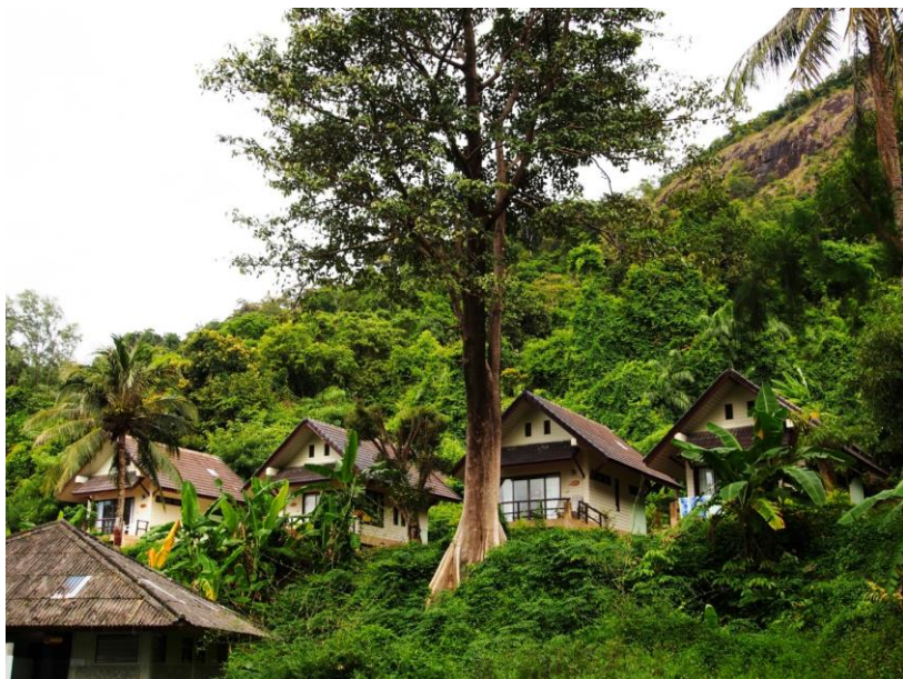
Bungalovy Národního parku ve stráni nad pláží