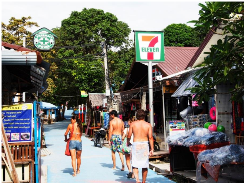
I na Ko Lipe už dorazil supermarket „7-Eleven“