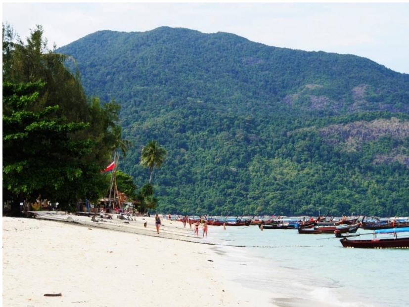
Sunrise Beach z jihu, v pozadí Ko Adang