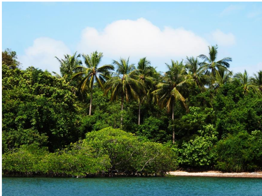
Tropická džungle je všude