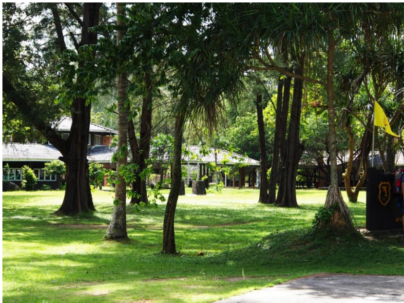
Bungalovy Národního parku