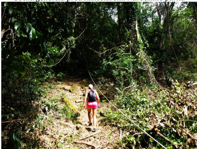
Džungle je velmi hustá, ale vedou v ní značené cesty