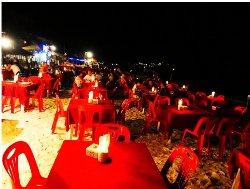
Každý večer se Pattaya Beach zaplní restauracemi