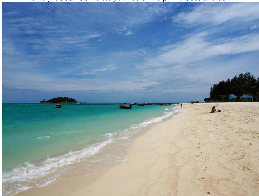
Sunrise Beach ze severu