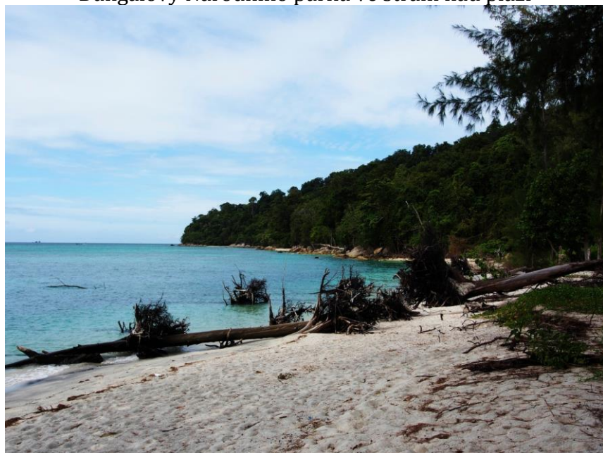
Pohled směrem na západ z jižní pláže.