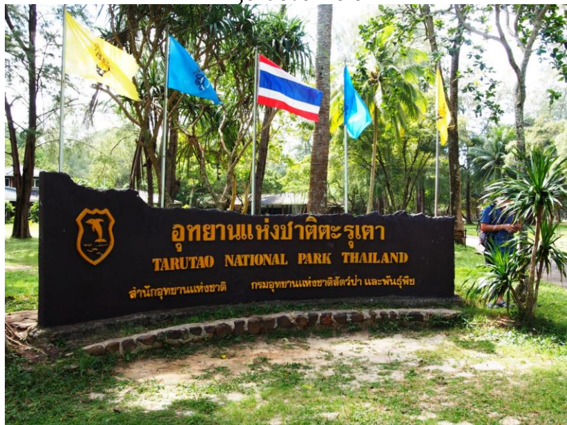
Nápis u příchodu do kempu Národního parku