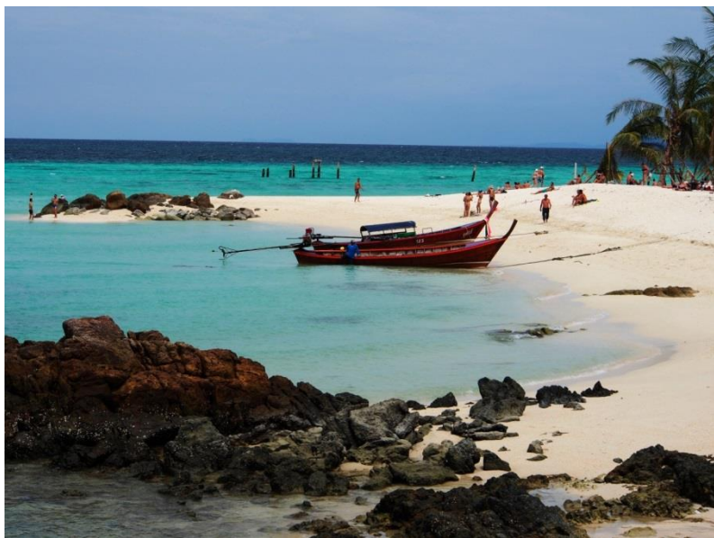
Výběžek na severu Sunrise Beach