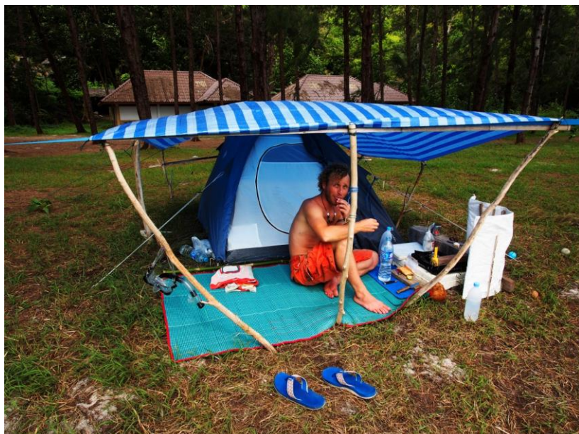
Jeden ze stanujících v kempu