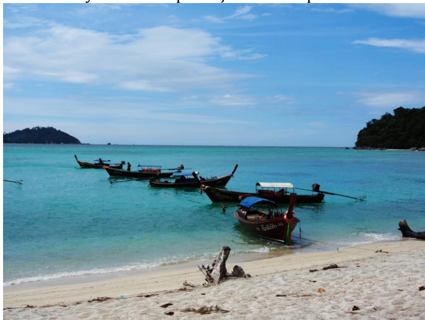
Vodní taxi z Ko Lipe kotví na jihu ostrova