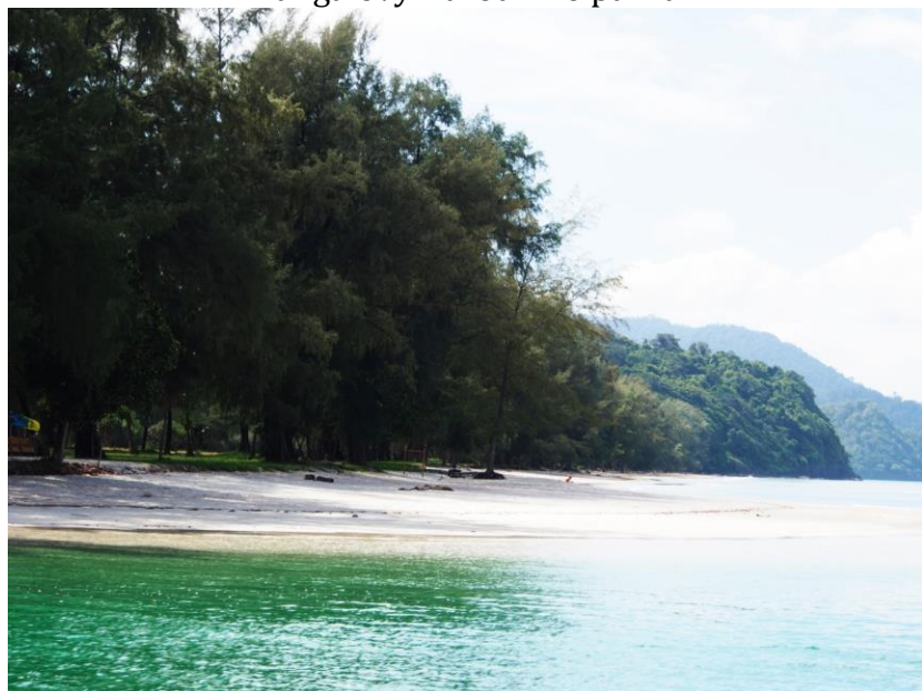
Pláže na tomto ostrově jsou liduprázdné