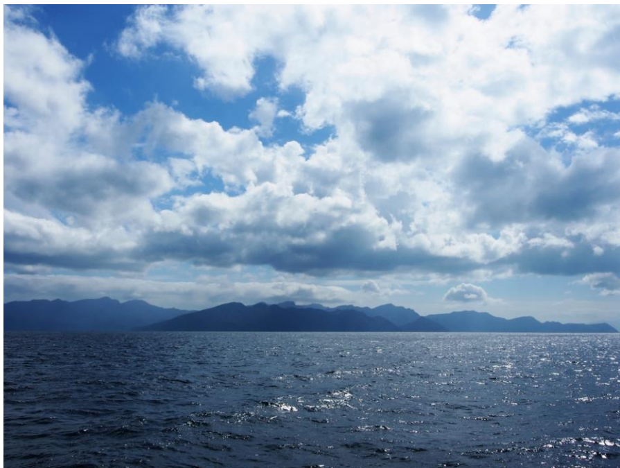
Ko Tarutao směrem od západu

Jednou denně na ostrově staví speedboat z Ko Lipe nebo Pak Bary, nutno se na něj doptat v cestovní kanceláři.