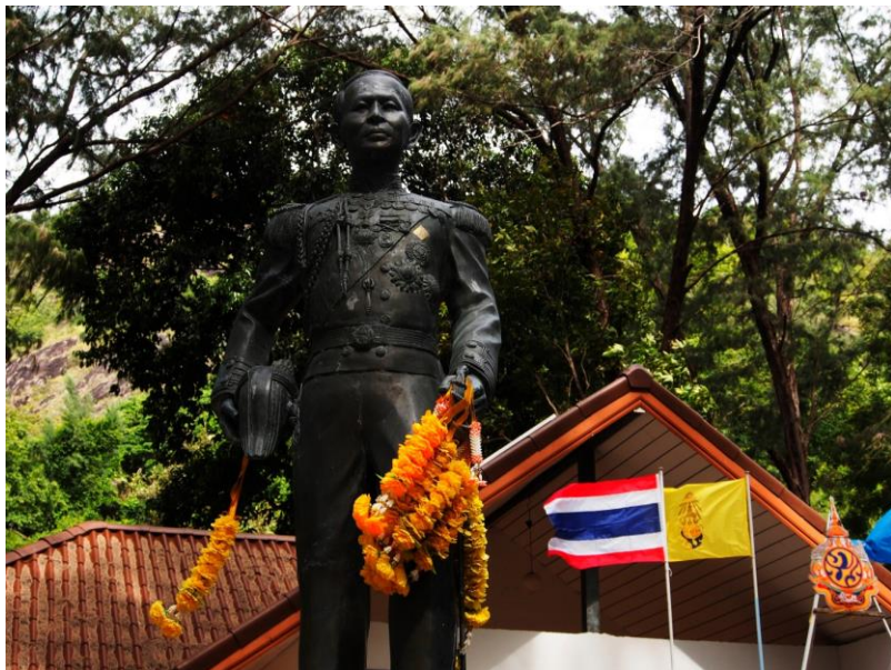
Socha generála před kanceláři Národního parku