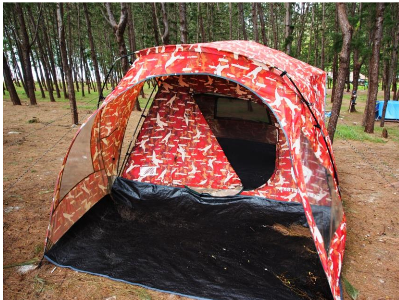
Stany Národního parku jsou levné a prostorné