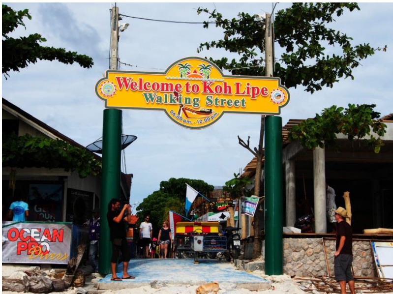
Brána do nákupní ulice Walking street