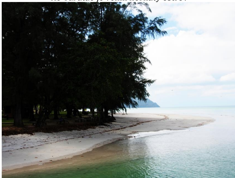
Pláž Ao Pante Malaka