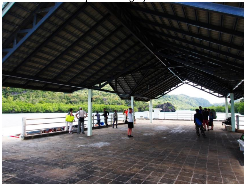
Příjezdové molo je poněkud předimenzované