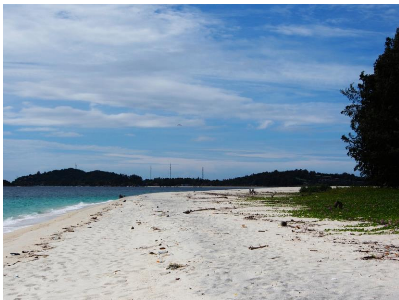
Pohled na Ko Lipe z jižní pláže