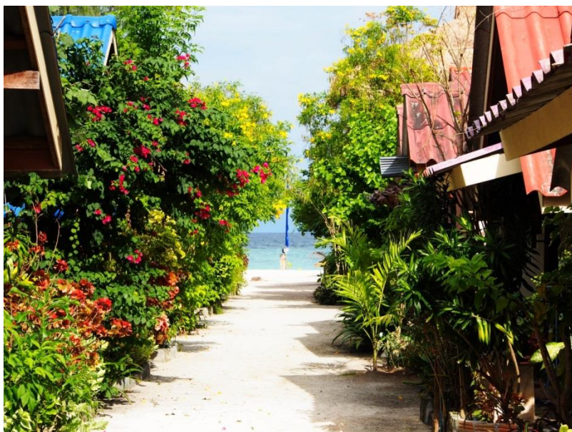
Průhled na Sunrise Beach