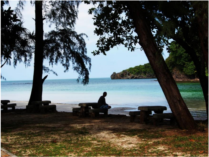
Klid a pohoda bez turistů, proto se na Tarutao jezdí