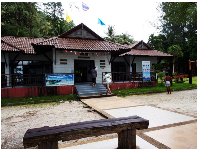
Kancelář správy Národního parku