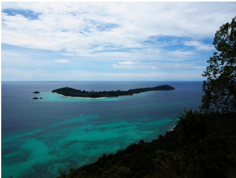
Pohled na Ko Lipe z jihu, z Ko Adangu