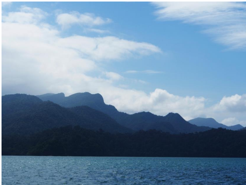
Ko Tarutao je velmi hornatý ostrov