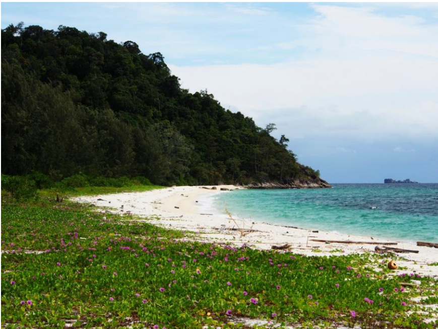
Pláž na sever od staveb Národního parku

Jak se na ostrov dostat: Long-tail boat (tradiční dřevěná loď) z Ko Lipe je na Ko Adangu za cca 30 minut.