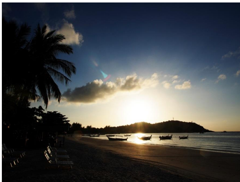
Východ slunce na Pattaya Beach