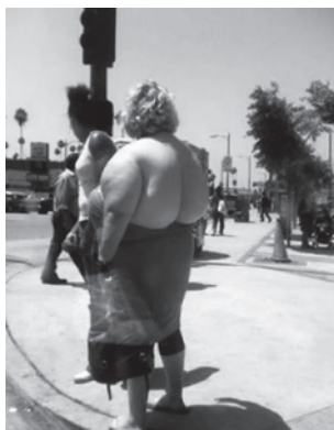
Výsledek úspěšné plastické operace: transpozice věhlasného zadečku