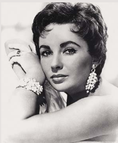
Leonardo da Vinci Elizabeth Taylorová