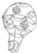
Letecká převrava Eso