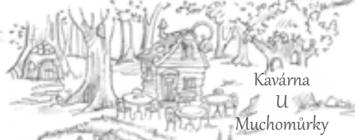
Kavárna U Muchomůrky