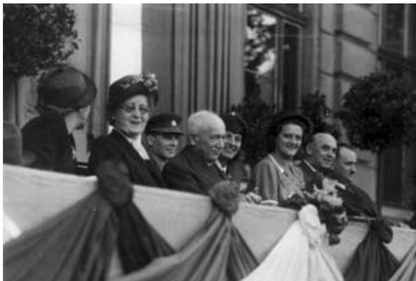
Prezident Edvard Beneš začíná své druhé období od 2. dubna 1945 do 7. června 1948.