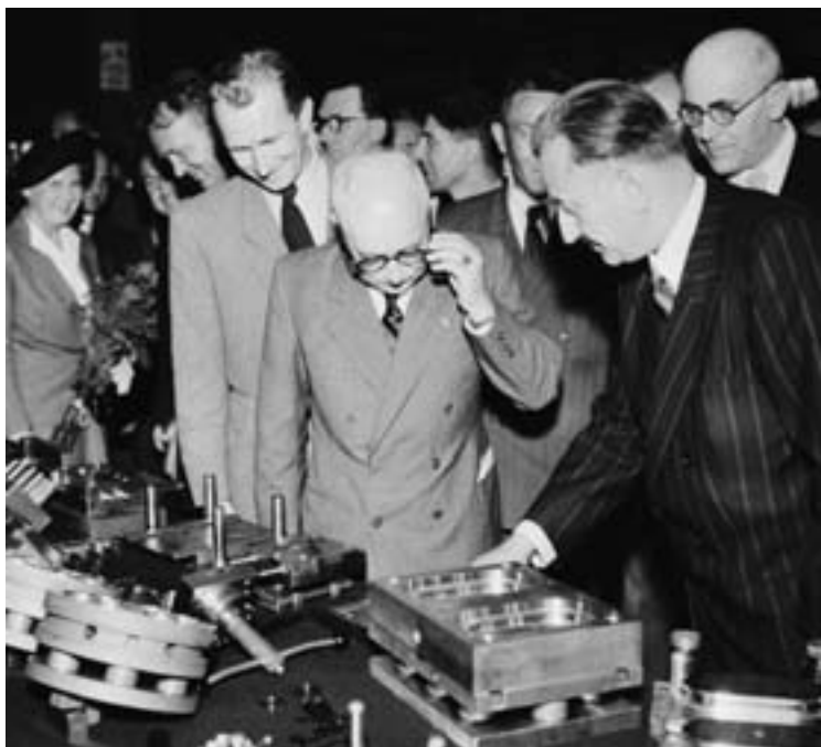
Zbrojovka Brno byla častým cílem návštěvy našich prezidentů. Navštívil ji i Edvard Beneš.

pušky Mauser a Mannlicher a později svoje vlastní. Nejznámějším symbolem úspěchu byl automatický kulomet Bren Gun, jehož výrobu se podařilo přemístit do Británie a upřít jej ve válce Německu. Bren byl pak po celou válku vyráběn v Enfieldu.