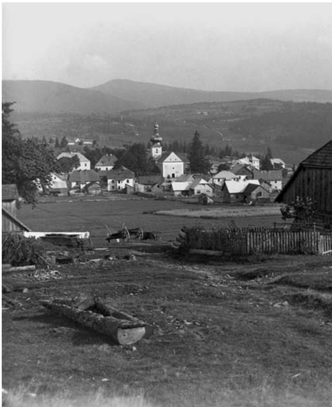
Srní, horská osada s barokním kostelíčkem založená počátkem 18. století