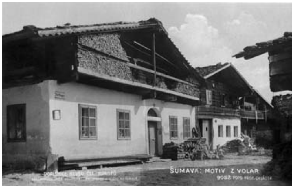
Volary, osada založená na přelomu 13. a 14. století u Zlaté stezky z Pasova do Prachatic

místních jmen, z nichž některá vznikla právě v době knížecích Čech. Za nejstarší osady se považují obvykle ty, jejichž označení končí příponou –ice či –ici, dále pak vesnice, v jejichž názvu se objevuje slovo Újezd. Ty považuje teorie za lokality předkolonizační. Ve 13. století se pak v souvislosti se středověkou kolonizací a změnou právního postavení rolníků objevují spíše názvy s příponou –ov a ve složených jménech je často označení Lhota (lhůta – typická investiční pobídka ve středověku, znamenala dobu, po kterou se odpouštěly kolonistům daně a další poplatky).