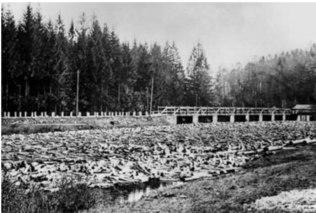
Plavení dřeva po Otavě, most u Dlouhé Vsi

vrchnost na své panství nalákala. Opuštěné a spálené usedlosti vrchnost přenechávala bez vstupního poplatku (zákupu) také svým služebníkům, podruhům a místy dokonce i Židům. Za své osedlé prý některé vrchnosti dokonce platily zpočátku kontribuci, poskytovali jim zdarma dřevo na výstavbu obydlí, půjčovali jim obilí na osev polí, potahy na polní práce a dokonce jim zdarma rozdělovali chléb. V berní rule se k těmto praktikám připomínalo, že tak činili hlavně ze strachu, aby se zbytek osedlých nerozutekl. Nedostatek lidí byl totiž citelný všude, a pokud by nějaká rodina uprchla na jiné panství, tam ji ochotně přijali a nedalo se počítat, že by ji vrátili původnímu pánu (navíc v té době neplatily ještě striktní nevolnické zákony).