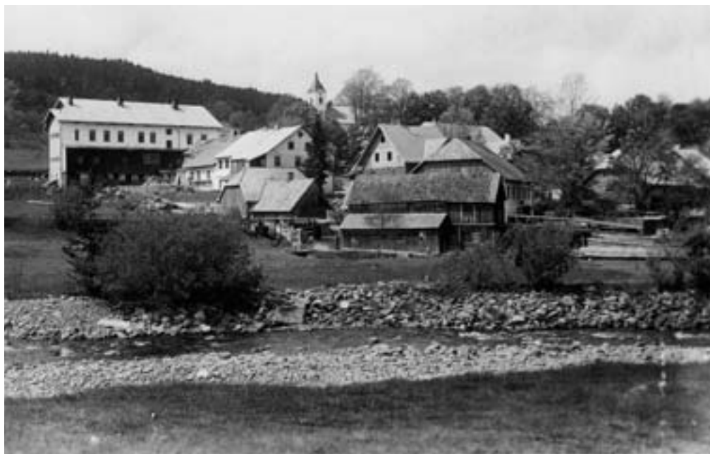
Prášíly, osada založena na konci 18. století v blízkosti sklářské hutě (působila zde od roku 1739)

Šumavy patřil mezi nejmvlivnější rod Vítkovců. K podpoře kolonizační činnosti založil Vok z Rožmberka roku 1259 ve Vyšším Brodě cisterciácký klášter.