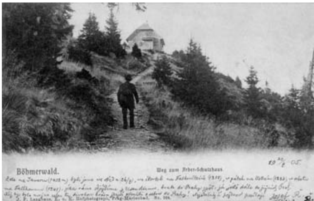
Výstup na Velký Javor k horské chatě založené roku 1885

Obživa lidí v hornictví, hutnictví, sklářství, dřevařství či plátenictví poznamenala i vzhled vesnic, v nichž převládala chalupnická zástavba s malým počtem hospodářských budov (na rozdíl od zemědělských statků v podhůří tyto provozní prostory velká část obyvatel v horách nepotřebovala).