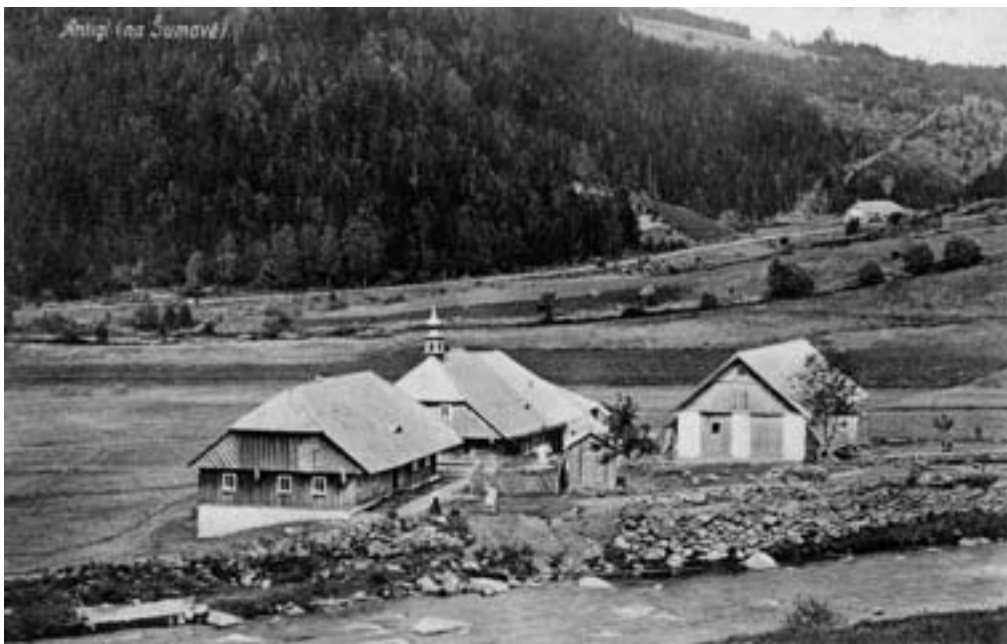
Antýgl, královácký dvorec, nejstarší zmínka kolem roku 1500

O rozmachu lesní kolonizace svědčí i nejstarší dochované spory, které propukaly mezi sousedy, jejichž zájmy se křížily při klučení jen nepřesně vytyčovaných záborů. K prvému dochovanému sporu došlo roku 1315 mezi klášteřem Zlatou Korunou a vlastníky vitějovického statku o území frantolské. Četné spory vznikly pak v průběhu 14. století mezi vyšebrodským a zlatokorunským klášteřem. O iniciativě církevních institucí svědčí, že do roku 1360 vybudoval zlatokorunský klášteř v lesích mimo hranice svého panství, a tedy v podstatě nelegálně, více než dvacet osad.