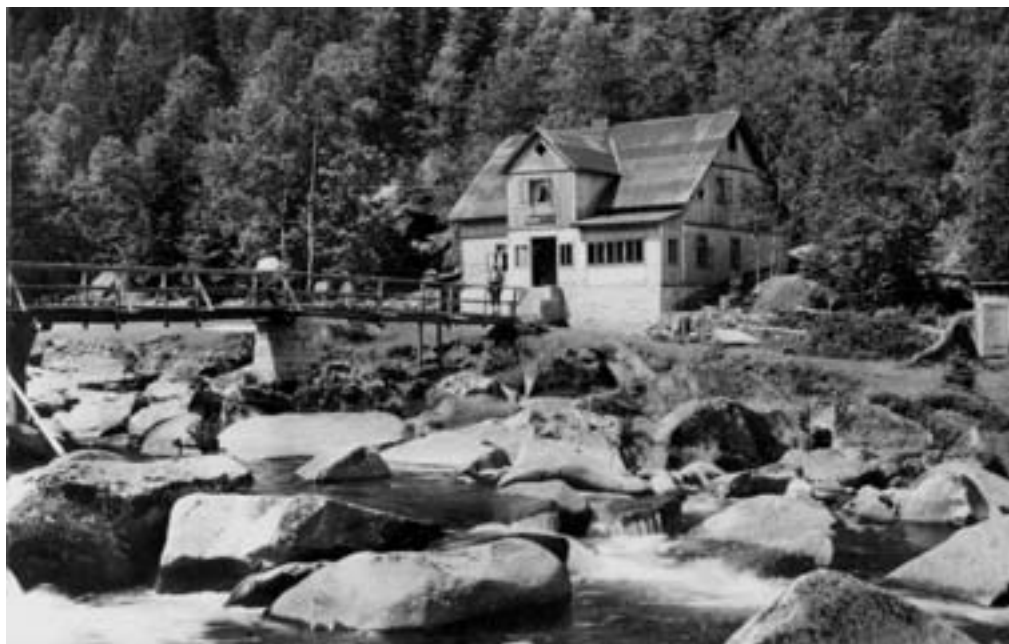
Hálkova chata postavená Klubem českých turistů na místě Puknerovy chalupy. Do roku 1939 jediná turistická chata v Povydí

Podstatnou změnou prošla v době třicetileté války i vrstva feudálních vlastníků půdy. Česká šlechta a mnohá města byla za účast ve stavovském protihabsburském odboji (1618–1620) potrestána ztrátou majetku. Z obavy před dalšími represemi, uplatňovanými s důslednou rekatolizací, odešly mnohé šlechtické i měšťanské rodiny dobrovolně ze země. Některá panství byla prodána, věnována či zastavena cizincům, kteří ve válce podporovali císařskou stranu. To platilo i na Šumavě, kde své statky získali generálové Buquoy a De Hoeff-Huerta, stejně jako vojenský dobrodruh Marradas. K poněmčení šlechty přispělo i to, že po smrti posledního mužského příslušníka rodu Petra Voka (1611) přešla rožmberská država (ještě před třicetiletou válkou) na štýrský rod Eggenberků.