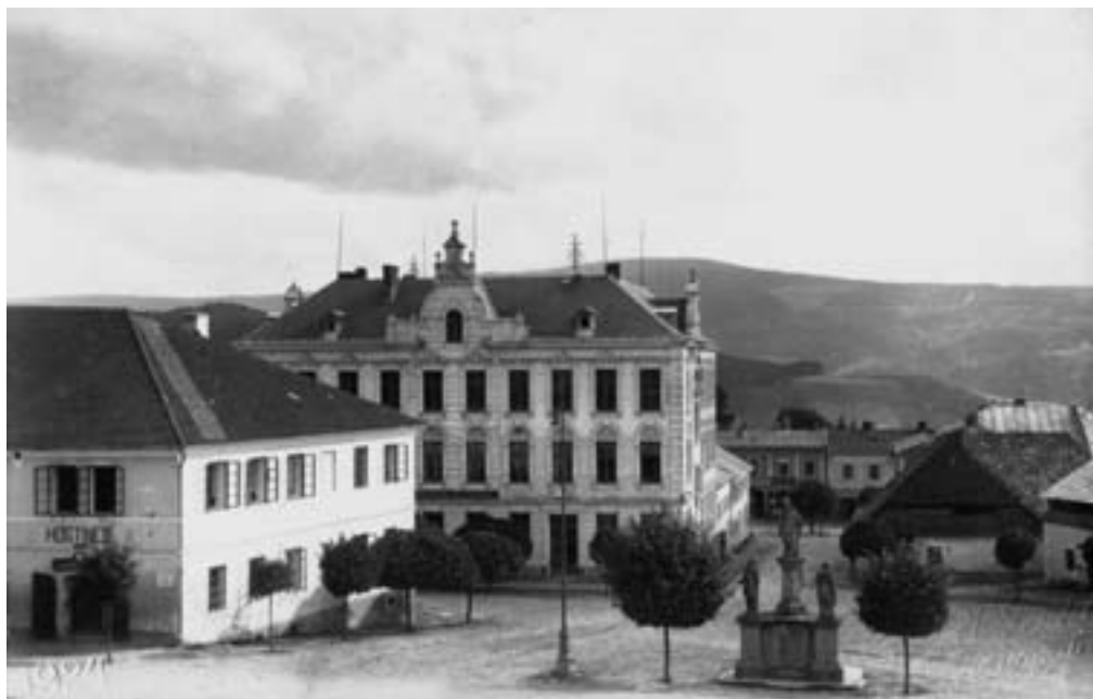
Náměstí v Kašperských Horách, osada založena ve 13. století, roku 1584 povýšena na královské horní město

dištní jsou však stále otevřeným problémem a mají zatím spíše spekulativní charakter (neboť většina dokladů jsou hmotné památky, které na tento problém odpovědět neumějí).