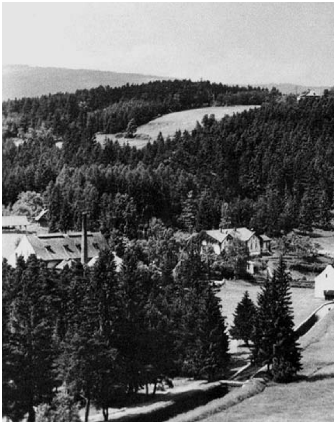
Sklárna v Anníně