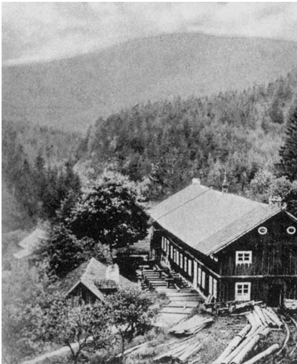
Čeňkova pila založená v polovině 19. století Čeňkem Bubeníčkem