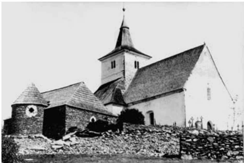
Pozdně románský kostelík sv. Mořice na Mouřenci u Annína

čtyři – Kněží hora u Katovic, Hradec u Řepic, Hradiště u Sousedovic a Hradec u Němčtic. Slovanské osídlení zabralo celou starší a zemědělsky již kultivovanou oblast v povodí Otavy a Volyňky, ale nejspíše pronikalo i do vyšších a dosud neosídlených krajin, jak dokládají slovanské artefakty nalezené na Čenkově pile, v okolí Kašperských Hor, Vlachova Březí, Sedla u Albrechtic a jinde.