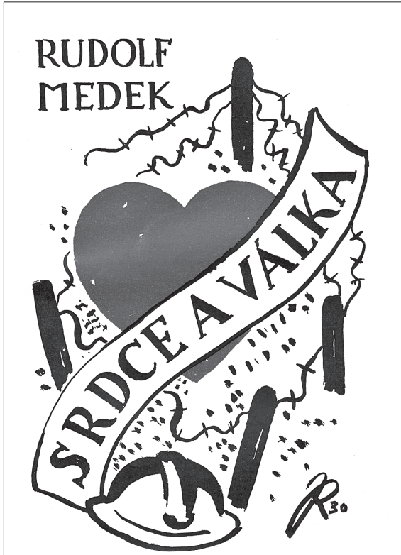
Hrou Srdce a válka Medek opět vykročil na divadelní prkna

v myšlenkách, postojích a jejich vyjadřování. 198 Stanovit míru skutečné sebereflexe v pamětech psaných s jistým odstupem a určených k publikaci je vždy obtížné a v případě věcných nebo jiných deformací nemusí vždy jít o vědomý proces. Přesto lze odhadovat, že Medek atentát a jeho význam pro budoucnost chápal, stejně tak viděl v počátku válečného konfliktu možnost získání výhod pro České země. Zatímco doba těsně před vypuknutím ničivého válečného konfliktu bývá v mnoha vzpomínkách označována za poklidnou, rozmarnou a veselou, k čemuž přispívá optika zákopového pekla, u Medka lze najít odlišnou interpretaci, která však také