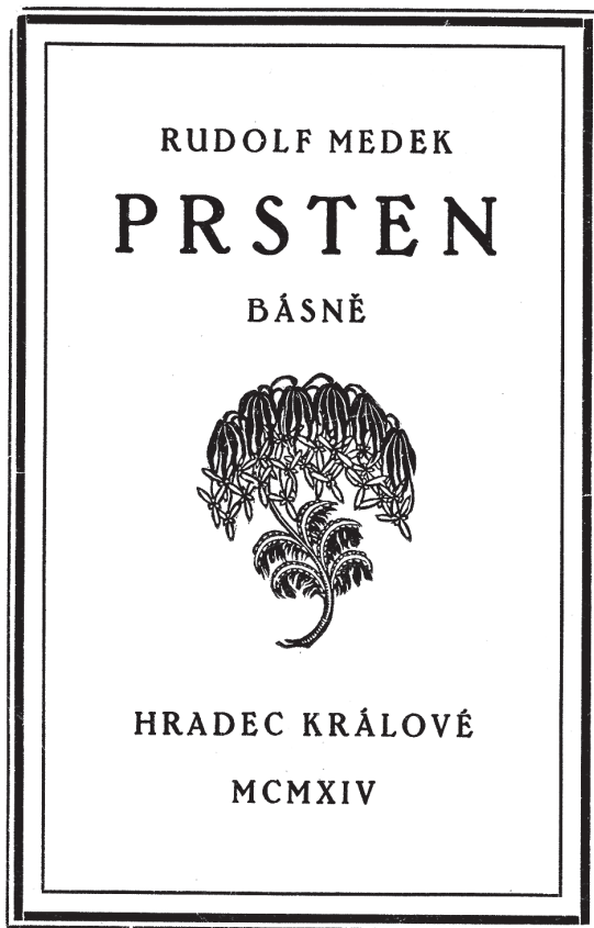
Prsten, druhá Medkova básnická sbírka

revue různými recenzemi a kritikami, prvním otištěným příspěvkem byla Meditace nad jednou z knih Jiřího Karáska ze Lvovic. Později glosoval Vrchlického nebo Březinovy práce, podobně jako sbírky básní S. K. Neumanna a Karla Tomana.