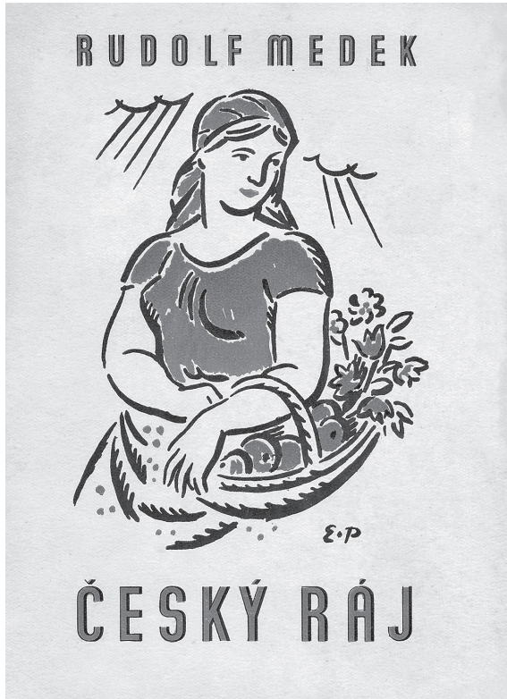
Básnická sbírka Český ráj obsahuje Medkovy básně sepsané v letech 1926–1936

Svatopluk Machar. Ze zahraničních to byli například George Gordon Byron, později Henrik Ibsen, Fjodor Michajlovič Dostojevskij nebo Gabriele d'Annunzio. Nebyl rozhodně žádnou výjimkou, budoucí spisovatel, ruský zajatec a legionář František Kubka vzpomínal, že četl podobně, rozsahem i zaměřením, 79 podobnou strukturu, zejména v kontextu české literatury, měla i četba Josefa Hory. 80