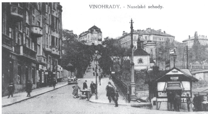
Nuselské schody s kaplí Svaté rodiny v roce 1900

Tomuto neradostnému osudu nakonec ušla. Roku 1970 ji dostali do správy pražští starokatolíci a vlastními silami se pustili do její opravy. Díky nim je tento drobný, nenápadný klenot dosud využíván k občasným mším; škoda že odlehlost místa svádí sprejery, aby se vyřádili na jejích stěnách.