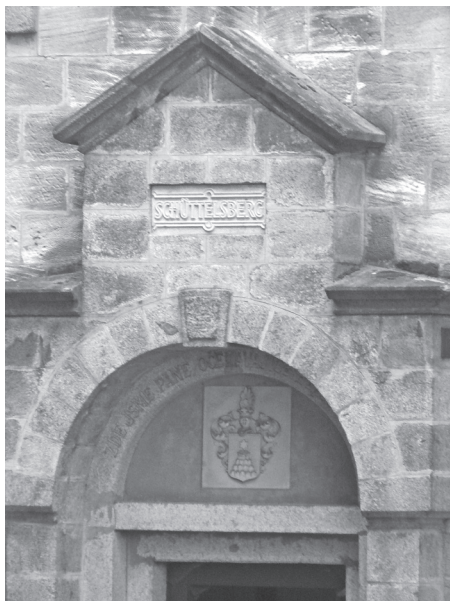
Detail hrobky Schüttelsbergů v Nebřenicích