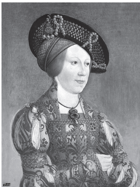
Hans Maler zu Schwaz: Anna Jagellonská, královna česká a uherská (1519)

Kromě toho byl jeden z reliéfů na Královském letohrádku dříve interpretován jako předávání dobudované stavby Ferdi-