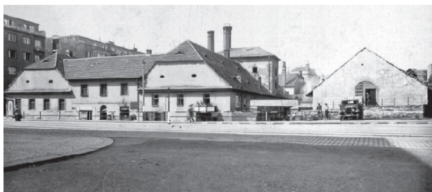
Vodní tvrz, přestavěnou na pivovar, už ve Vršovicích nenajdeme, Jitřenku však našťěstí ano