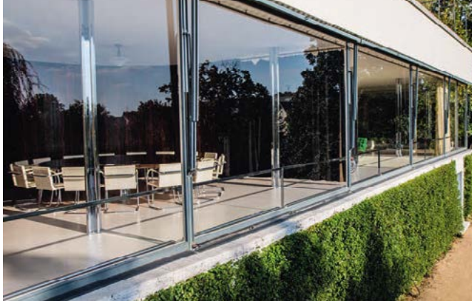
Pocitu propojení vnitřního prostoru se zahradou napomohla velkoplošná skla

Vila Tugendhat se dostala také do literatury a je hlavní „hrdinkou“ románu Skleněný pokoj, který napsal anglický spisovatel Simon Mawer. Zmínka o vile, respektive nábytku z ní, se objevuje také v románu Utz anglického romanopisce a autora cestopisů Bruce Chatwina Utz, jehož děj se odehrává v Praze.