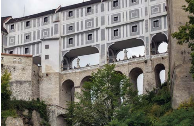
Plášťový most spojuje Horní hrad se zámeckou zahradou

Druhé nádvoří získalo svou podobu ve druhé polovině 16. století za velké přestavby gotického hradu na renesanční zámek za vlády Viléma z Rožmberka. V této době tady byla postavena