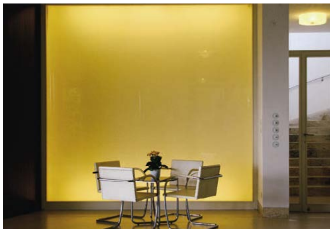
Vstupní hala vily Tugendhat

V tomto patře se kromě obývacího prostoru nacházela také promítací místnost, kuchyně, místnost pro přípravu jídel, místnost pro skladování