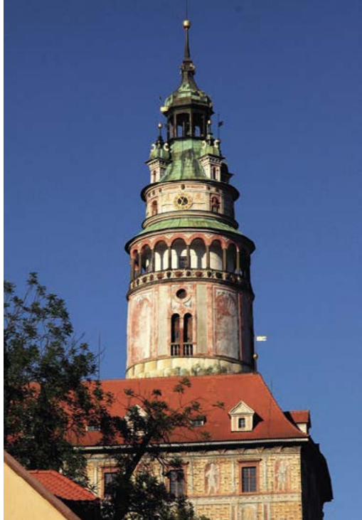
Zámeckou věž nelze přehlédnout