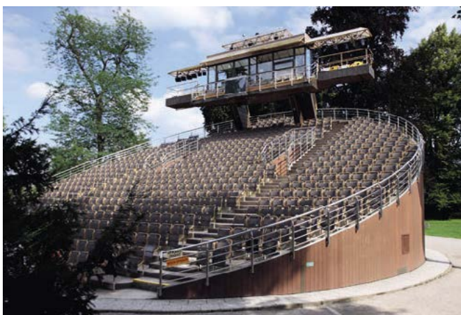
Otáčivé hlediště v zámecké zahradě

budova Nového purkrabství, kde sídlila administrativa spravující rožmberské dominium. Dnes se tady nachází knihovna čítající více než 40 000 knih.