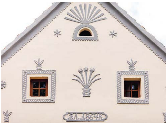
Štíty domů mají tvar oblouku s vykrojenými bočními hranami nebo tvar trojúhelníku