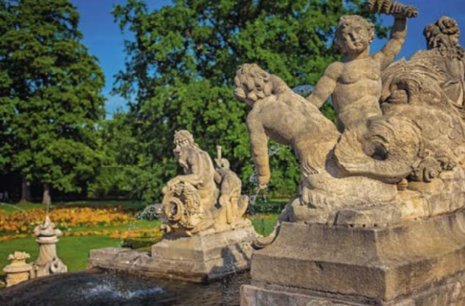
Detail fontány v zámeckém parku

Z rozlehlého druhého nádvoří se vstupuje do tzv. Horního hradu . Dnes se ze druhého nádvoří dostanete do malého a intimního třetího nádvoří chodbou pocházející z doby renesanční přestavby. Až do poloviny 17. století vedl do Horního hradu padací most.