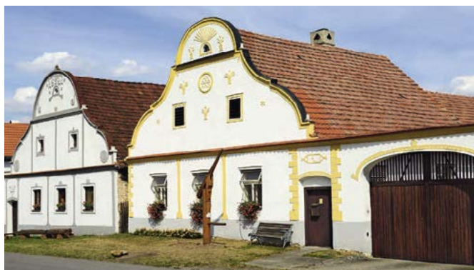
Holašovice jsou unikátní dochovaným selským barokem

nebo lehce do oblouku vykrojeného trojúhelníku s bílým lemováním. Pokud se budete chtít přenést do doby, kdy tyto hezké domy vznikaly, přečtěte si román Karla Klostermanna „ Mlhy na Blatech “, který takto popisuje život vesnic na blatech v 70. a 80. letech 19. století: „ Kraj rovný jako stůl, vyplněný bohatými, žírnými lány, posetý nesčíslnými velkými i malými rybníky, pánev jakási, zalitá v dávnověku vodou, která tu tvořila, jak se zdá, obrovské jezero, z něhož tu a tam ostrůvek vystupoval a jehož břehy na severu a jihu sotva stanovití lze... “