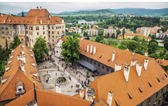
Pohled na nádvoří ze zámecké věže