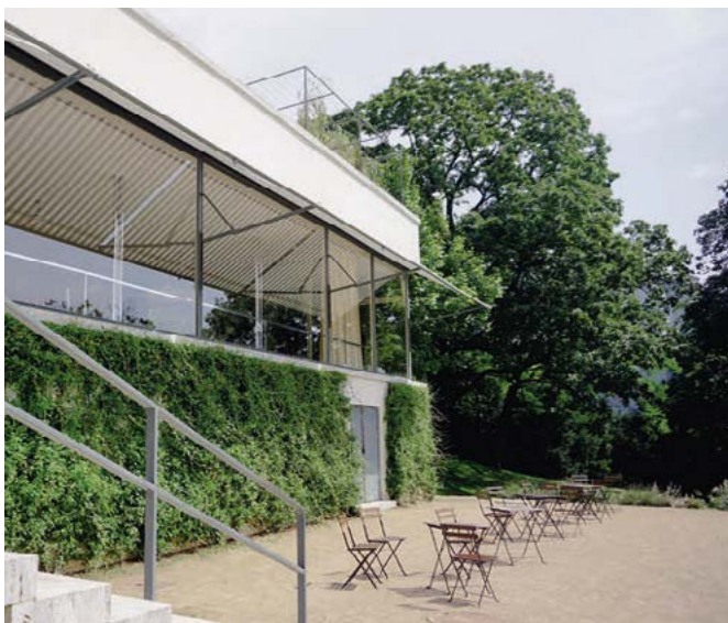
Pohled na vilu ze zahrady

v roce 1929 v Barceloně a současně také zakázku na soukromou vilu v Brně. Těmito dvěma stavbami si vybudoval jméno jako neortodoxní modernistický architekt. Protože stavba pavilonu v Barceloně byla dočasného charakteru (Barcelonský pavilon, který tam stojí dnes, je replikou z roku 1986), je vila Tugendhat Miesovým prvním trvalým dílem, kterým na sebe upozornil odbornou veřejnost.