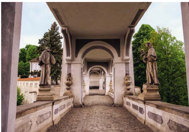
Spodní část mostu