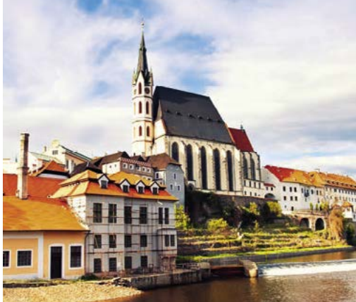
Kostel sv. Víta se tyčí nad Vltavou

se církev definitivně rozhodla náhrobek odstranit. Náhrobek vadil jezuitům, kterým dal kostel sv. Víta do správy právě Vilém z Rožmberka. Náhrobek jim byl trnem v oku i před tímto datem. Prý byl blízko oltáře a bránil věřícím při pohledu na něj. Jezuité ale naráželi na nesouhlas majitelů panství. Tentokrát však majitel souhlasil, a tak byla část náhrobku nacházející se na úrovni podlahy katedrály odstraněna. To ale nestačilo, a tak jezuité otevřeli také podzemní kryptu, kde objevili cínové rakve Viléma a jeho manželky. Rakve byly otevřeny, těla přemístěna do dřevěných rakví, vrácena do hrobky a cín z rakví o váze přibližně 500 kg byl v dražbě prodán. A zbyly ještě dvě náhrobní mramorové desky. Co s nimi? Kupce zřejmě nebyl, a tak byly vsazeny do zdi kaple sv. Jana Nepomuckého, kde jsou dodnes. To bylo „poděkování“