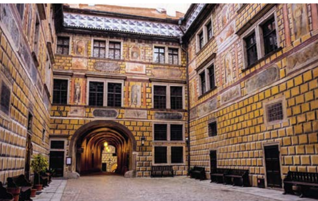
Zámecké nádvoří se zdobou fasádou

stavby, budované v centrech měst v období socialismu. Ekonomická stagnace Krumlova v průběhu 19. a 20. století měla, jako vše negativní, také své pozitivní aspekty. Staré budovy sice chátraly, ze světa ale nezmizely. Město se jako Šípková Růženka probudilo ze svého spánku zejména po zapsání na Seznam kulturního a přírodního dědictví UNESCO v roce 1992. Začalo se tady ve velkém restaurovat, ve velkém začali přijíždět turisté a rozjel se turistický byznys. Podnikatelé, které tento turistický rozmach živí, si současný stav nemohou vynachválit, obyčejným obyvatelům města a staromilcům se zase stýská po prázdných večerních uličkách a době, kdy mohli přejít po mostě sami a v klidu.