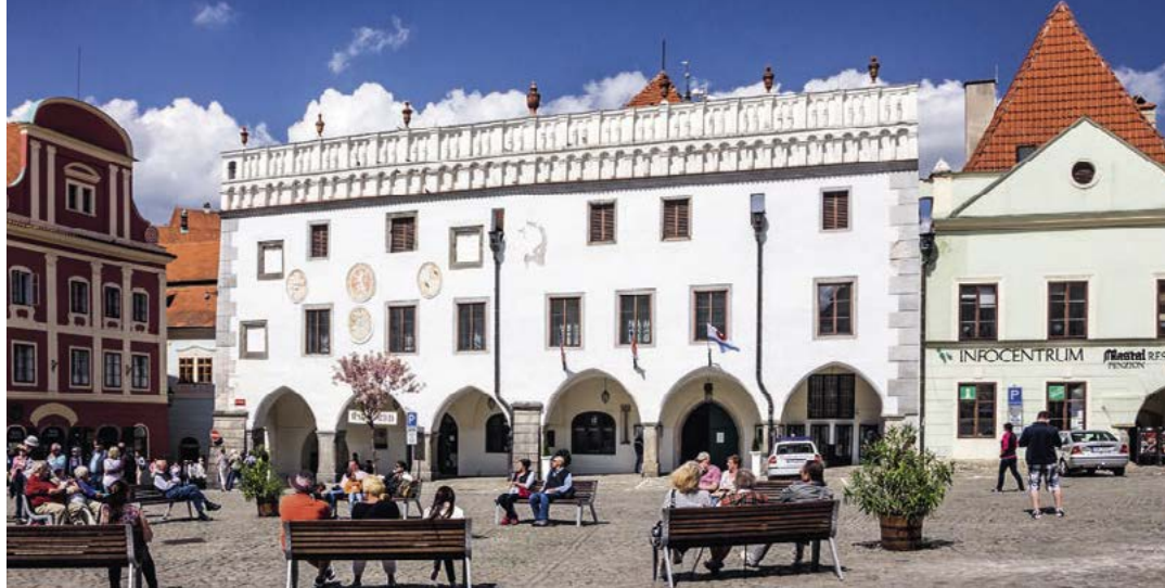
Renesanční fasáda radnice patří mezi nejkrásnější na náměstí

barokní divadlo u nás, jehož dnešní stav pochází z úpravy provedené v roce 1766. Podobné zámecké divadlo se zachovalo v Litomyšli, to je ale asi o 30 let mladší.