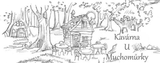
Kavárna U Muchomůrky