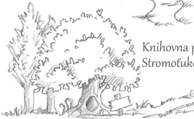
Knihovna paní Stromotukové