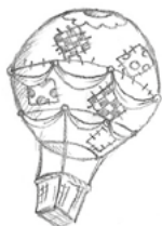
Letecká přeprava Eso