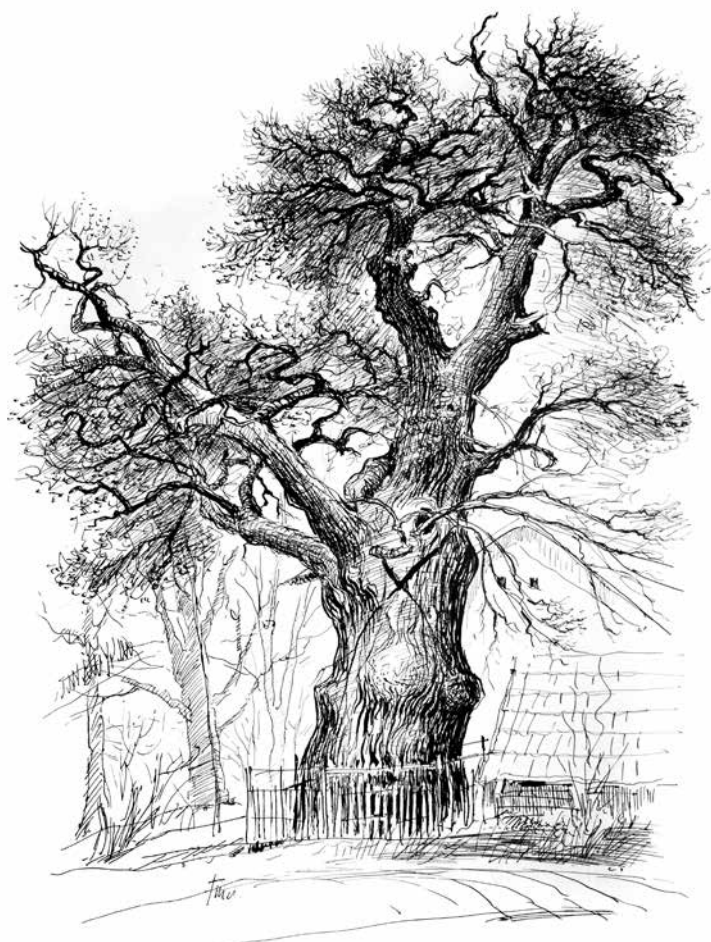
Myšlín u Mnichovic – Žižkův dub (J. Turek).