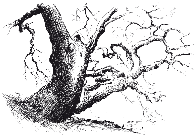
Dub nad Rožmberkem ( J. Turek ).

Příjem vody kořeny je ovlivňován například teplotou půdy (v teplé půdě buňky intenzivně dýchají a mohou přijímat více vody), obsahem kyslíku v půdě (při nedostatku kyslíku je znemožněno dýchání a příjem vody, zastavují se i metabolické procesy), obsahem nerostných látek (na zasořených půdách rostliny trpí nedostatkem vody, na půdě přehnojené minerálními látkami dochází k tzv. fyziologickému