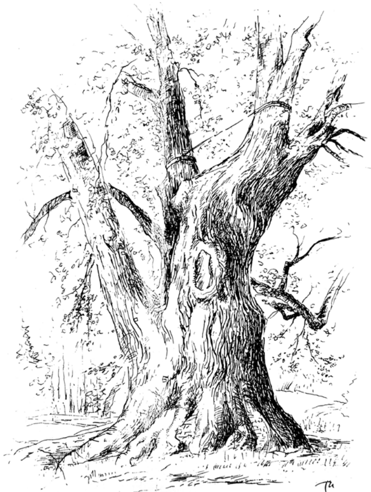
Kotel na Liberecku – památná lípa (J. Turek).