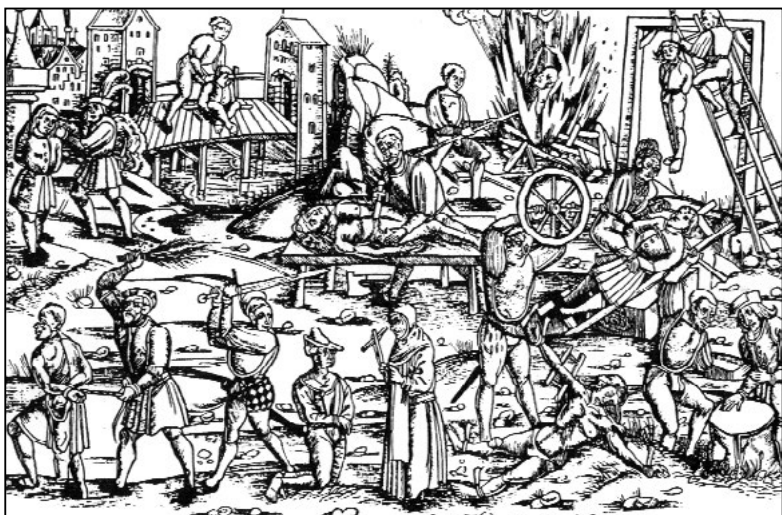
Středověké způsoby poprav