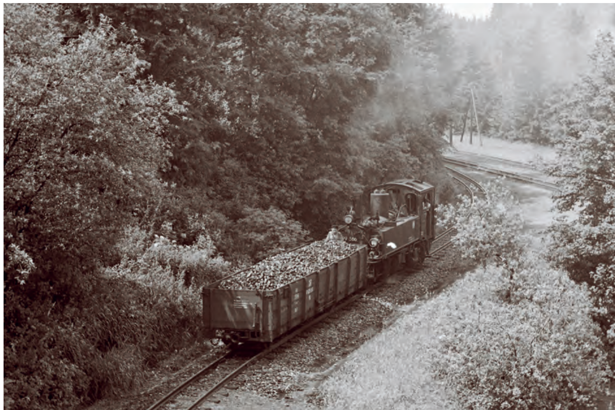
„Meyerka“ řady IV K v blízkosti Carlsfeldu v roce 1967.

Tato dráha byla nejen nejstarší, ale i nejdelší úzkokolejkou v Sasku. Její výstavbu požadovali především majitelé textilních továren v městě Kirchberg. Koncesi k jejímu vybudování vydal zemský sněm v Drážďanech až na třetí pokus v roce 1879. Trať vznikala postupně po etapách a po celkovém dokončení až do Carlsfeldu měla délku 42 km. Stavební práce na prvním úseku do Kirchbergu začaly 10. května 1881 a provoz tam pak byl zahájen 16. října 1881. Poslední úsek malodráhy byl zprovozněn 22. června roku 1897.