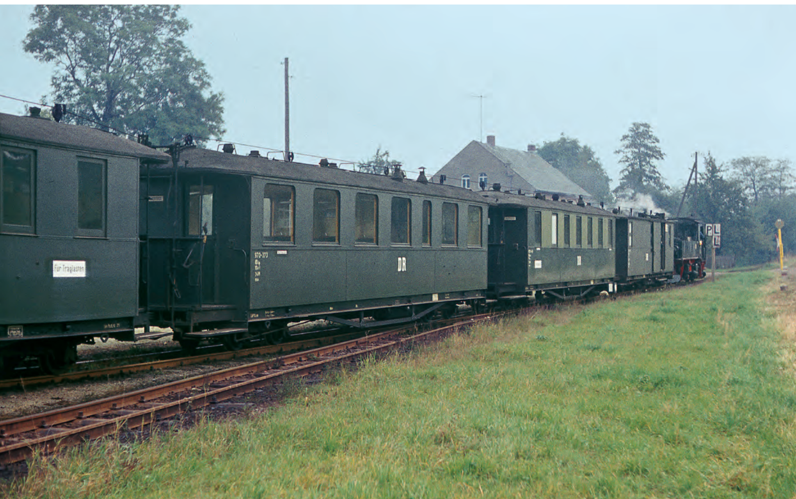
Osobní vlak vedený lokomotivou původní saské řady IV K opouští v roce 1972 stanici Nebitzschen na Mügelnské úzkorozchodné síti.