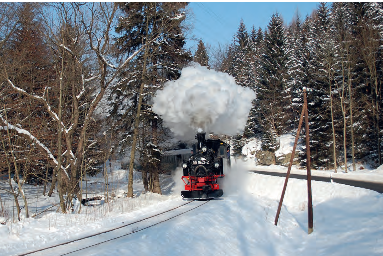
Krušnohorská zimní scenérie s „meyerkou“ 99 1542-2 vedoucí osobní vlak po kolejích přísečnické muzejní malodráhy. Snímek vznikl v únoru roku 2012.