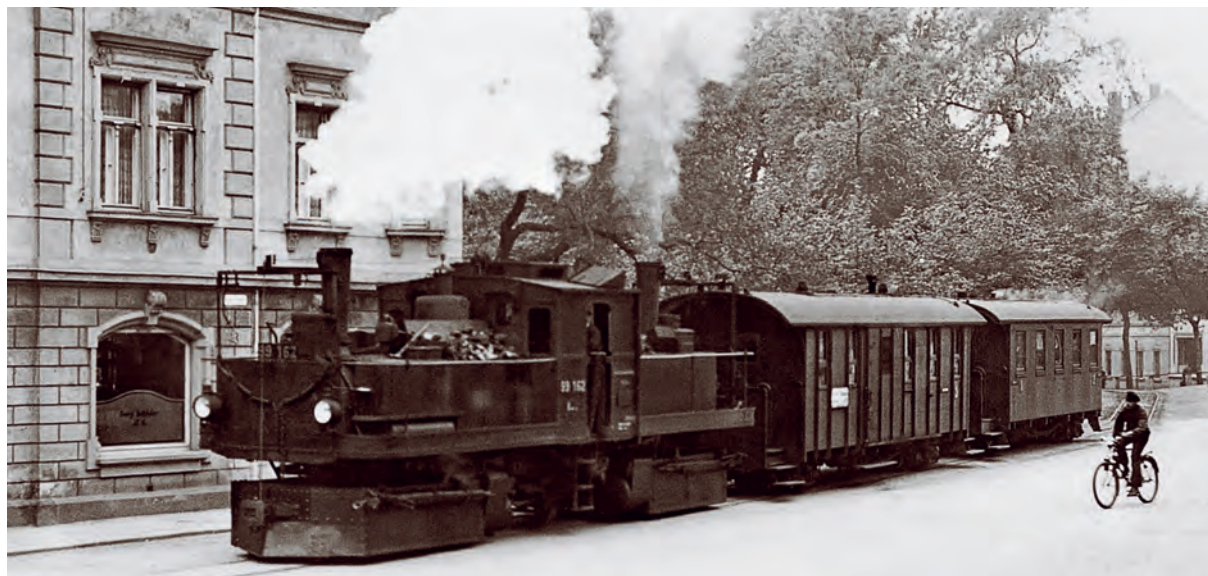
Na dráze z Reichenbachu do Oberheinsdorfu jezdily zvláštní lokomotivy systému fairlie se dvěma kotly, pojezdy a parními stroji. Na snímku je lokomotiva 99 162.

Tato zcela výjimečná malodráha se nacházela na západě Saska u zemské hranice s Durynskem. Měřila jen 5 km a měla pro Sasko netypický rozchod kolejí 1000 mm. Uvedena do provozu byla 15. prosince roku 1902. Díky jinému rozchodu kolejí byl na ní veškerý lokomotivní i vozový park odlišný od ostatních úzkokolejek.