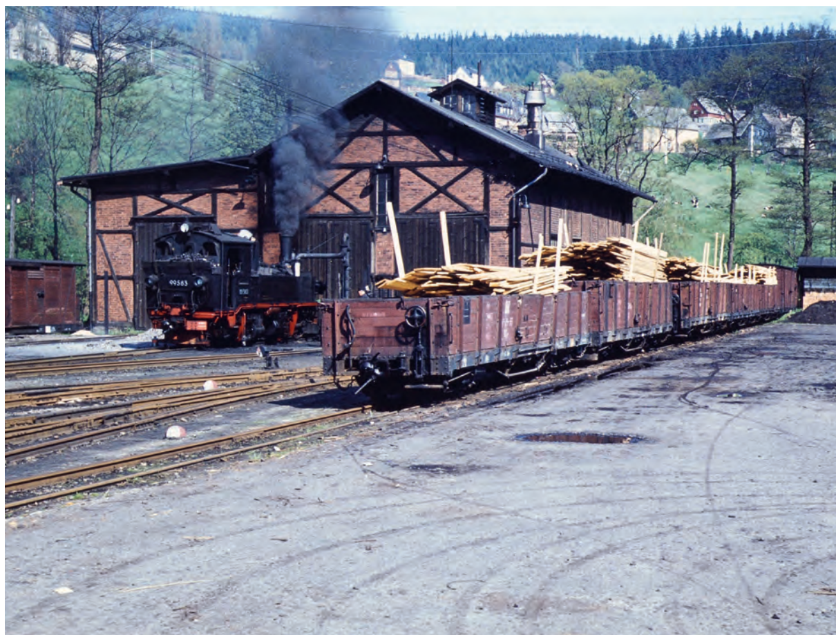
Atmosféra všedního dne v koncové stanici Rittersgrün. Snímek byl pořízen v dubnu roku 1970.

V roce 1977, tedy ještě v časech existence NDR, bylo na ploše někdejšího rittersgrünského nádraží a přilehlé výtopny zřízeno malé železniční muzeum, které existuje dodnes. Mezi jeho hlavní exponáty patří lokomotiva 99 579 někdejší saské řady IV K.