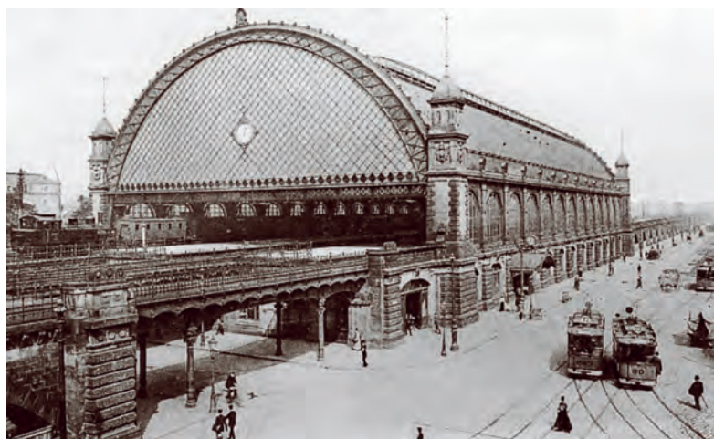
Takto vypadalo v roce 1908 wettinské nádraží v Drážďanech. Dnes se tato stanice jmenuje Dresden Mitte a má úplně jinou podobu, protože zobrazená původní secesní hala byla zcela zničena při spojeneckém náletu na město 13. února 1945.

Budování pak nabralo mnohem rychlejší tempo. Do roku 1915 bylo v Sasku postupně postaveno až 1027 km normálněrozchodných vedlejších tratí. Přestože se u těchto drah od prvopočátku počítalo jen s nízkou rentabilitou, ukázalo se velmi záhy, že v některých lokalitách by výstavba tratě