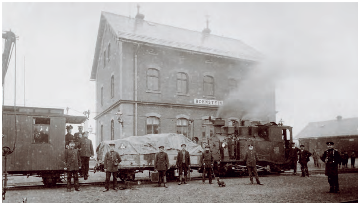
Takhle vypadalo koncové hohnsteinské nádraží před více než sto lety.

Dráha, zvaná též Schwarzbachbahn, se nacházela na severním okraji dnešního národního parku Saské Švýcarsko, jen pár kilometrů od známých labských pískovců. Dána do provozu byla 1. května roku 1897. Měla délku jen 12 km a byl na ní jen nevelký provoz smíšenými vlaky. V roce 1951 byl na dráze provoz zastaven, trať byla zrušena