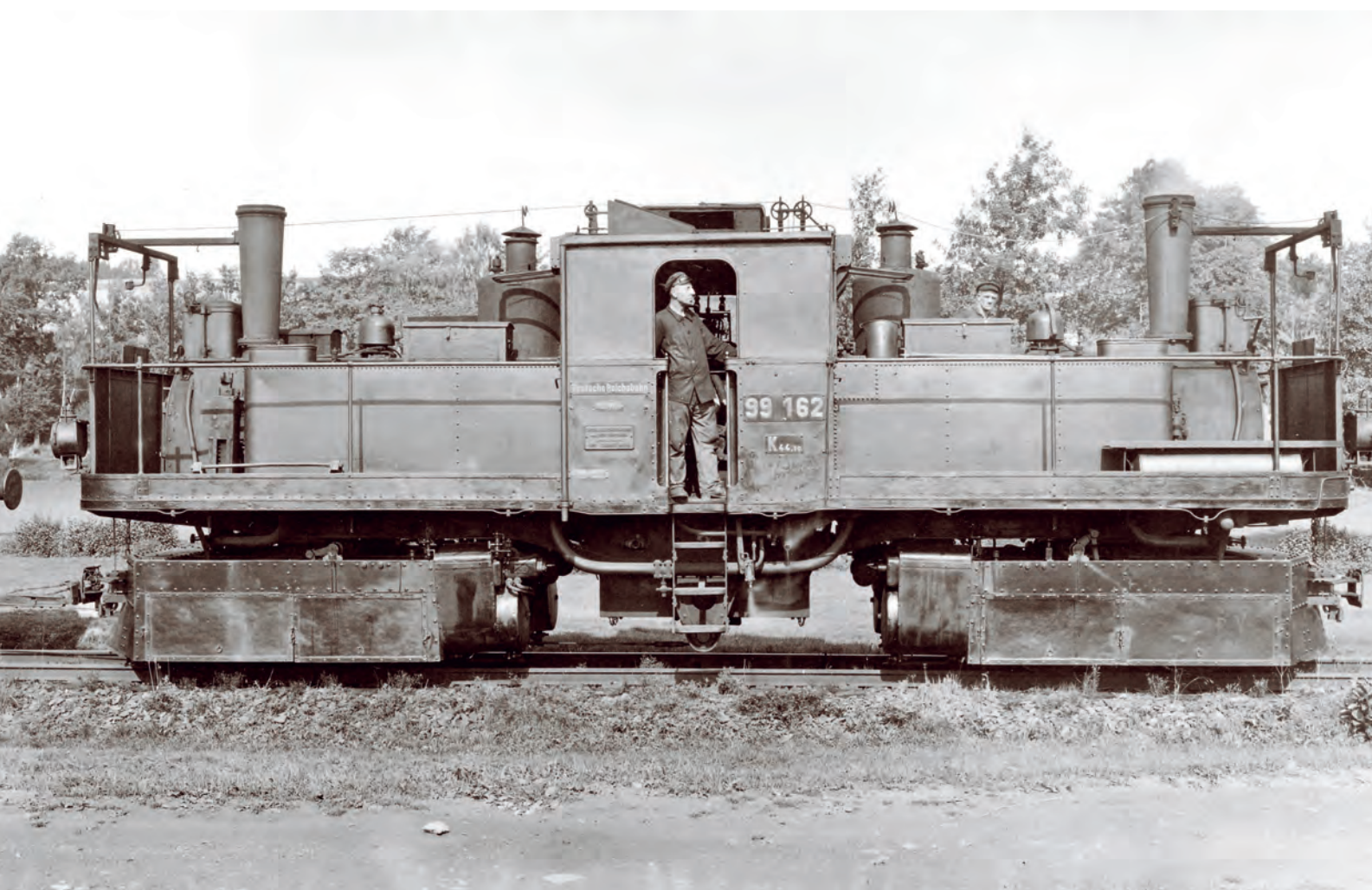
Ještě jeden pohled na lokomotivu 99 162 někdejší dráhy z Reichenbachu do Oberheinsdorfu. Tento stroj dodnes existuje coby exponát místního železničního muzea.

Od roku 1997 se na ploše někdejšího oberheinsdorfského nádraží nachází velmi pěkné muzeum této jedinečné saské úzkokolejky, kde je mimo jiné vystavena i lokomotiva 99 162.