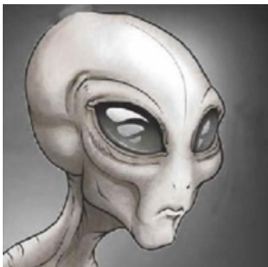
Obr. 1: Jedna z podob Grays

Zdá se, že tehdy byl podprostor příčinou a základem kolapsu Greys civilizace. I když nebylo možné úplně pochopit všechny události, které vedly k tomuto kolapsu, není pochyb o tom, že Greys zničili svou domovskou planetu. Pak museli vymýšlet strategii, jak přežít.