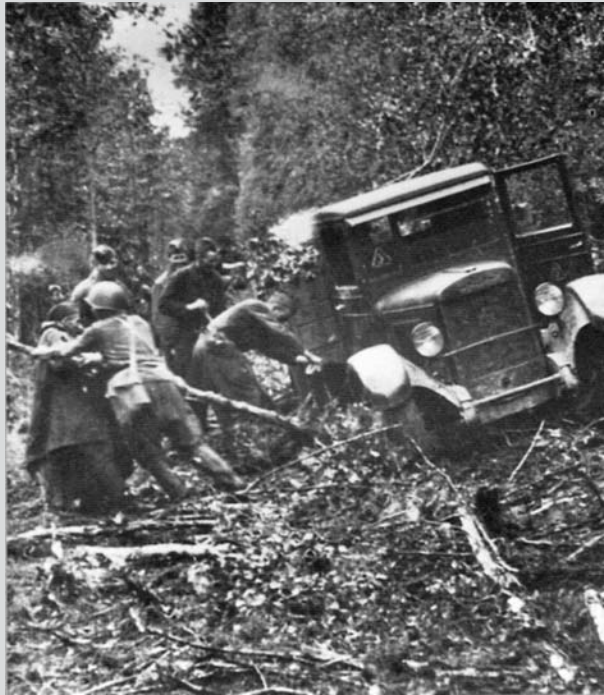
Podzim 1941. Vojáci z 311. divize vyprošťují nákladák.