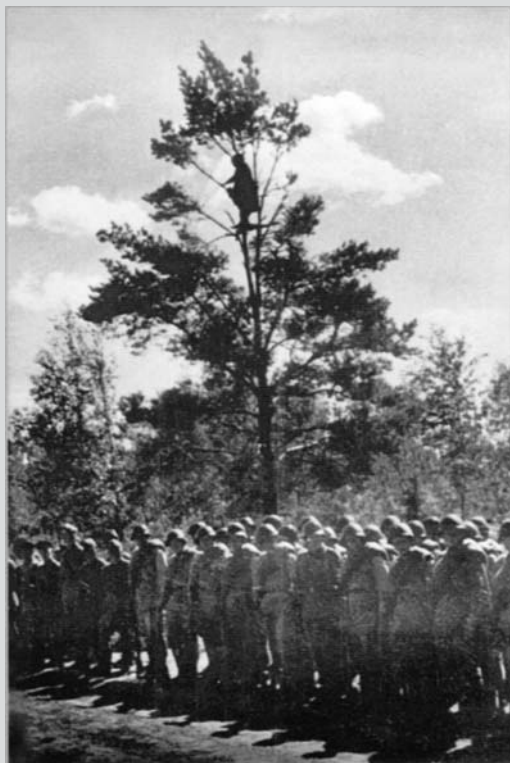
Tři sta jedenáctá střelecká divize zformovaná v Kirově byla převeleň v srpnu roku 1941 ke stanici Čudovo. Hlášení po boji. Na stromě sedí pozorovatel.