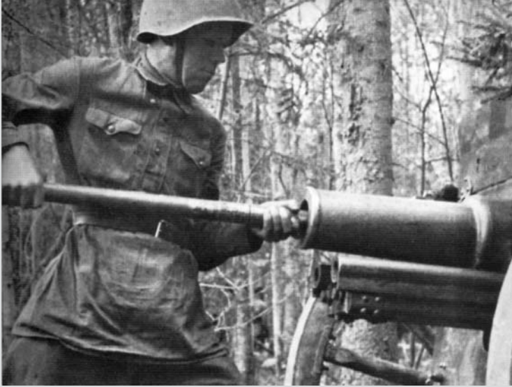
Podzim 1941. 311. divize. Čištění děla.