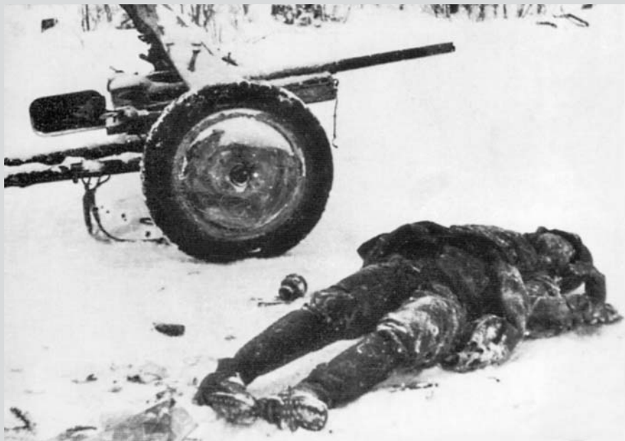
Prosinec 1941. Zabitý německý dělostřelec.