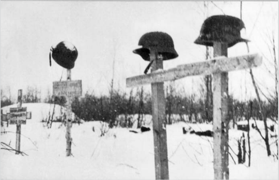
30. listopadu 1941, po vítězné bitvě s Němci v sovchoze Rudý říjen.