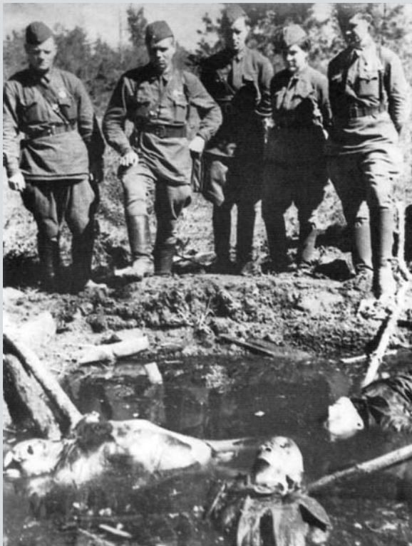
Podzim 1941. V příkopě plném vody leží rudoarmějci, které Němci umučili. (Snímek pro komisi, zabývající se zkoumáním německých zločinů.)