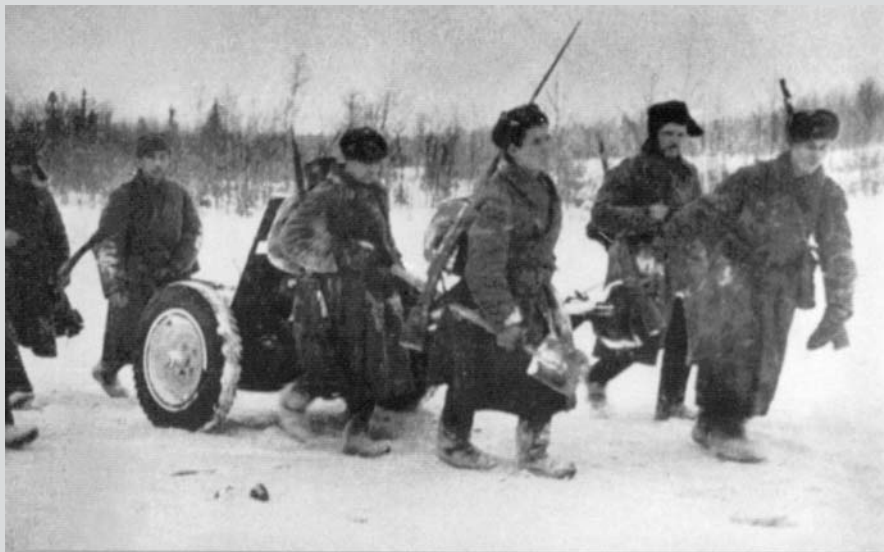
V létě 1943 v Mhinské operaci byl autor zaměřovačem tohoto děla ráže 37 mm. Dělo bylo ukořistěno Němcům v prosinci 1941.