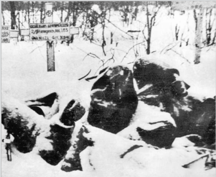
Prosinec 1941. Německý hřbitov u sovchozu Rudý říjen. Nebylo dost času k tomu, aby pohřbili všechny mrtvé.