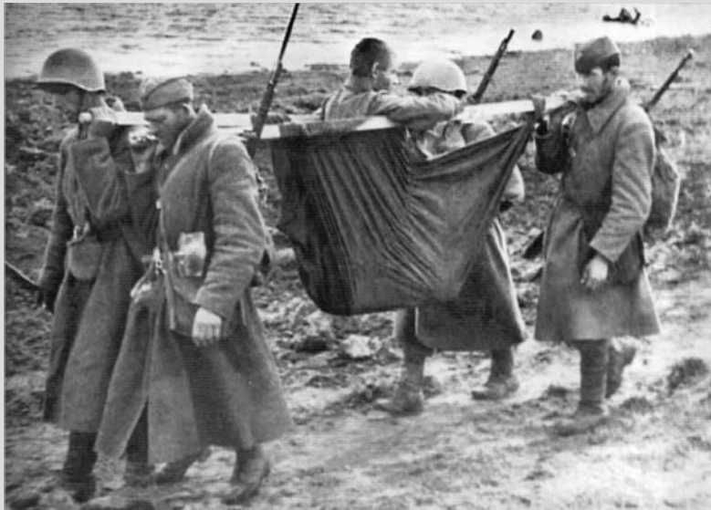
Podzim 1941. Neseme raněného.