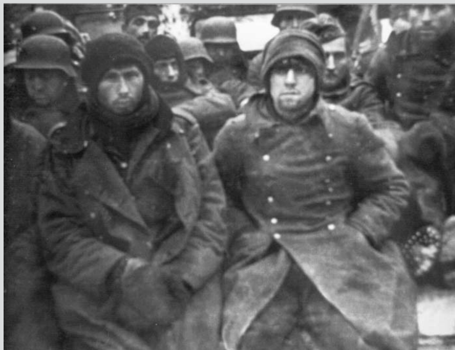
Němečtí vojáci, které zajala 311. divize v sovchoze Rudý říjen.