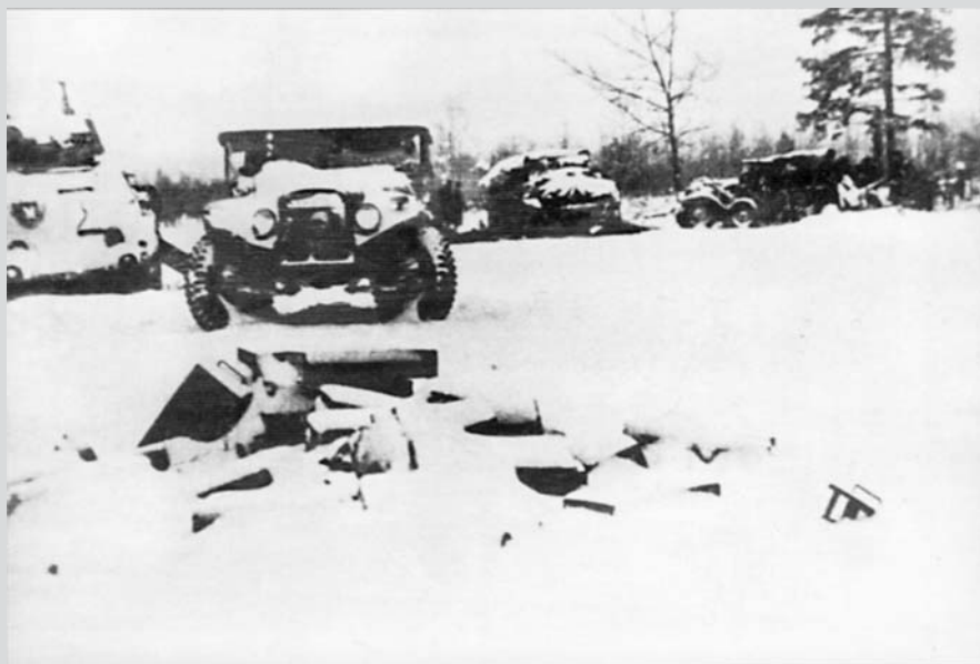
Ukořistěná německá technika.