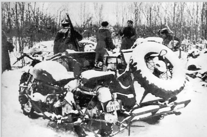
Ukořistěná německá technika po bojích, v nichž u sovchozu Rudý říjen 311. divize zvítězila nad Němci.