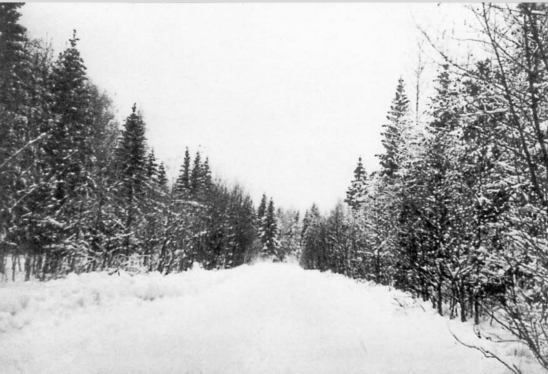
Zima 1942. Cesta v oblasti Dubovik – Lipovik v Pohostínském kotli.