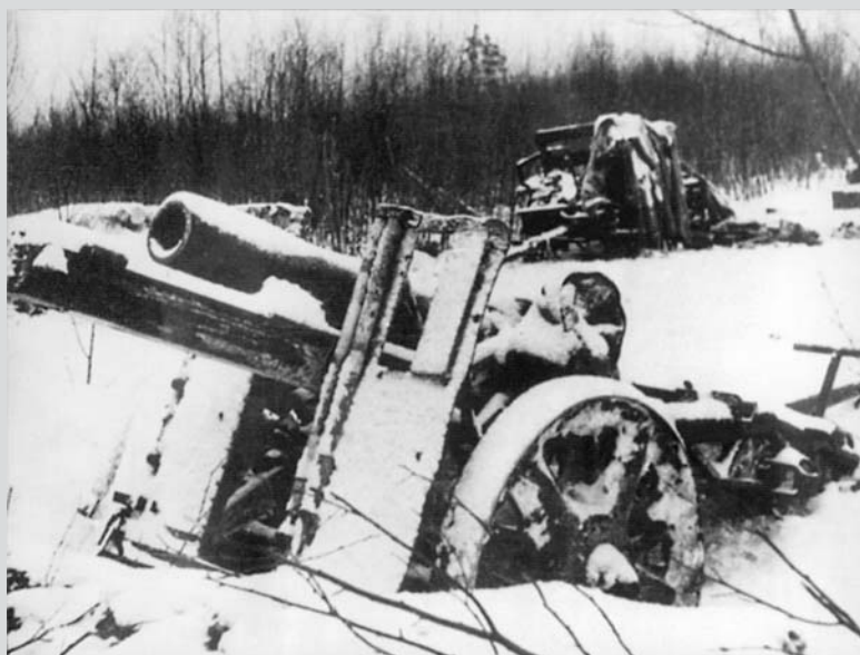
Německá děla, ukořistěná v bojích u sovchozu Rudý říjen v prosinci 1941.