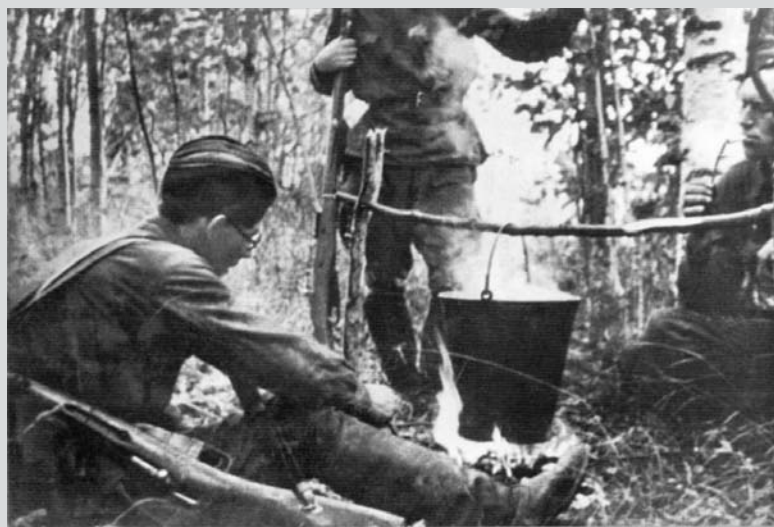
Srpen 1941. 311. divize v lese u Volchova.