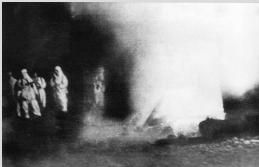
24. prosince 1941 osvobodila 311. divize ves Memino. Ustupující Němci zapalovali domy. V jednom z nich zavřeli starou ženu. Vojákům 311. divize se ji už nepodařilo zachránit.