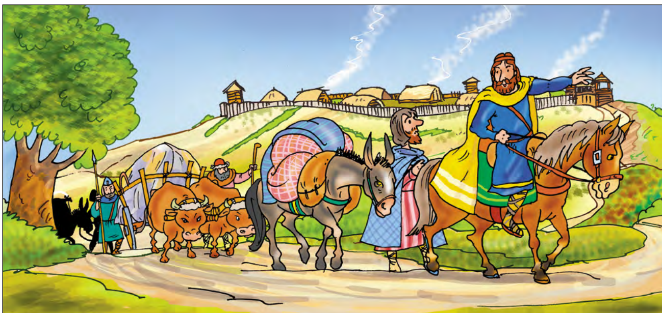
Kupecká karavana v čele se Sámem

Trpělivost Slovanům došla počátkem 20. let 7. století, kdy se rozhodli pro