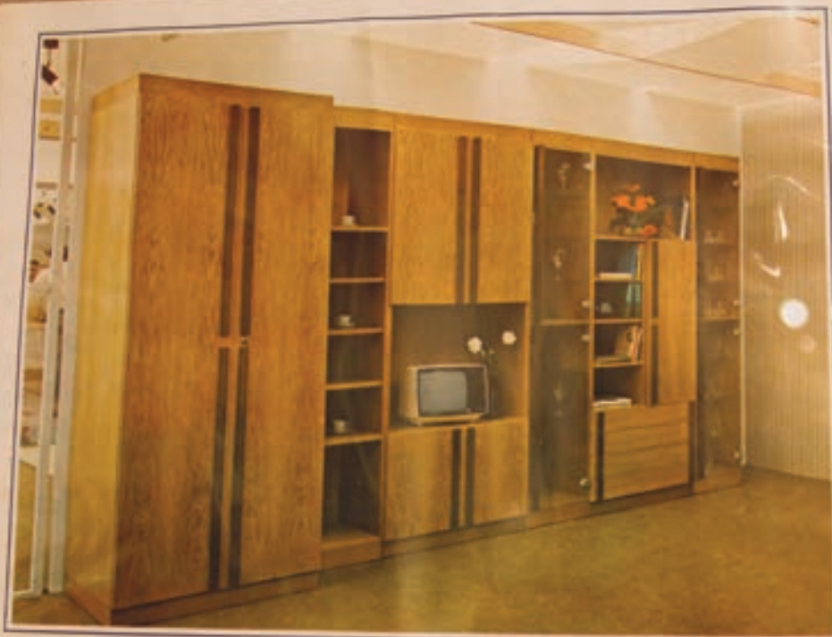
OBÝVACÍ STĚNA U-84