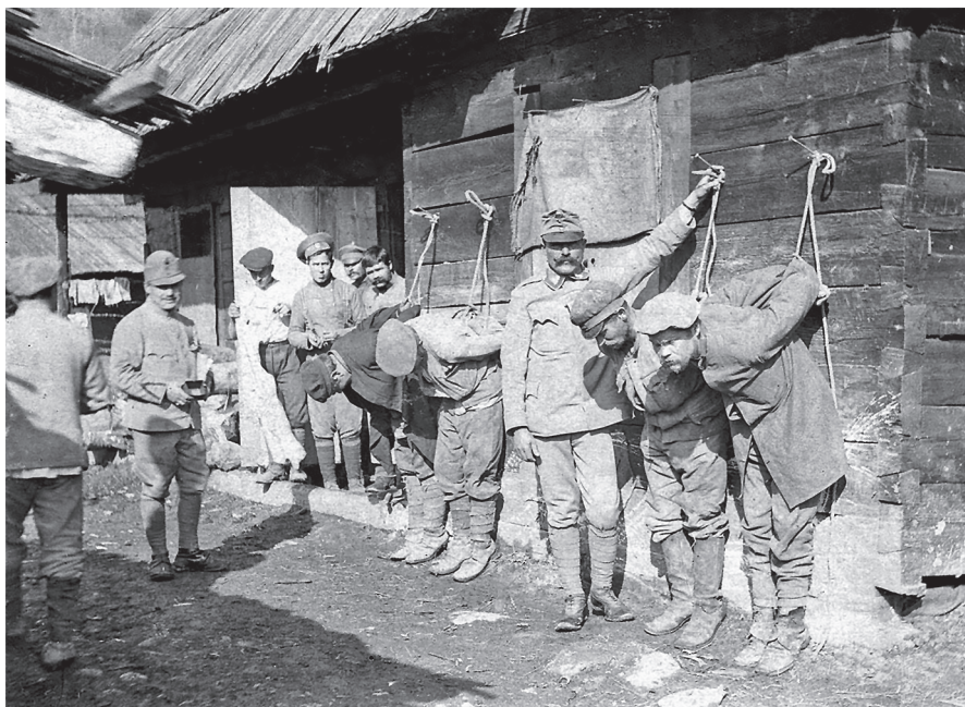
Se zajatci bylo často zacházeno velmi nevybíravým způsobem – zde rakouští vojáci týrají své ruské vězně

Kompetenci těchto výborů rozšiřovala další konference, konající se tentokrát v Kodani na podzim roku 1917. Konference předpokládala postavit na stejnou úroveň zajatce vojenské s občanskými a v práci srovnat výděly zajatců s platy místních dělníků. Obě zmíněné konference vycházely z iniciativy Ruska a Centrálních mocností. Ostatní země, Francie a Anglie, uzavíraly s centrálními zeměmi smlouvy po vzoru předchozích konferencí. Tak tomu bylo v Bernu roku 1917 mezi Francií, Německem a Rakouskem a v Haagu téhož roku mezi Anglií a týmiž zeměmi.