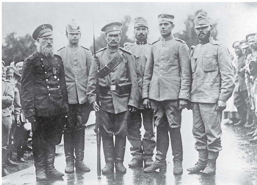
Zajatí rakouští a němečtí vojáci (sbírka ČsOL)

K USA se ovšem přidaly i další státy: Španělsko (vykonávalo dozor nad francouzskými zajatci v Německu, nad ruskými zajatci v Rakousko-Uhersku a nad rakouskými zajatci v Itálii a v Rusku), Holandsko a Švýcarsko. Tato posledně jmenovaná neutrální země navrhla v říjnu 1914 Mezinárodnímu Červenému kříži, že bude na svém území poskytovat lékařskou péči zraněným vojákům a zajatcům všech válčících zemí a umožňovat jejich výměnu. V průběhu války prošly léčbou ve Švýcarsku desetitisíce vojáků a zajatců.