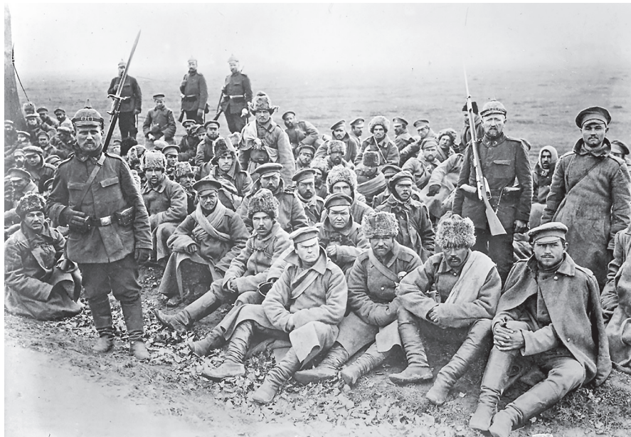
Hned v prvních měsících války padly do zajetí desetitisíce ruských vojáků

početního stavu dobrovolnického vojska, které se stalo nepostradatelným a určujícím faktorem v diplomatickém vyjednávání o existenci nového československého státu.