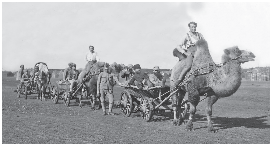
Někdy však nebylo co přikrášlovat, jelikož zajatci v některých oblastech namísto koní využívali exotických velbloudů

doplňovány údaji a poznatky z doby, kdy je jejich autoři psali. Číselné údaje jsou většinou nepřesné. Autoři se pochopitelně do jisté míry přizpůsobovali čtenářské poptávce, tj. často popisovali více exotické krajiny a zvyky tamních obyvatel, než samotný zajatecký tábor a život v něm.