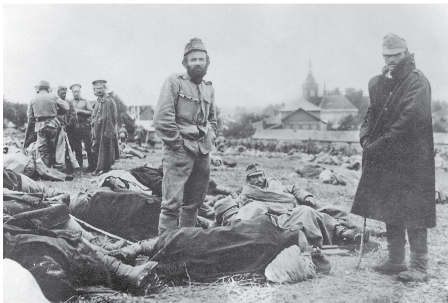
První chvíle v zajetí, září 1915

nepřátelských obchodních lodí, váleční novináři, všichni, kdo v dnešní terminologii zajišťují logistiku armády. A zároveň byla tímto nařízením zakotvena i povinnost zajatců bezplatně pracovat. O půl roku později, v březnu 1915, bylo přijato doplnění tohoto dokumentu, které přece jen dovolovalo jisté odměny za práci.