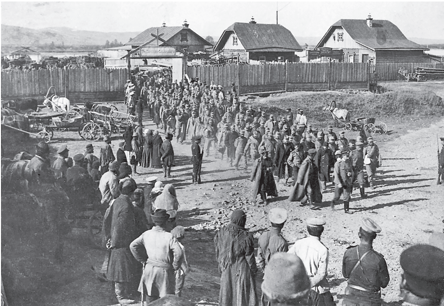
Rakousko-uhersští vojáci pochodují do ruského zajetí, podzim 1914

Zajatecké tábory byly v Rusku podřízené Hlavní správě Generálního štábu, ve které od října 1916 fungoval evakuační a zajatecký oddíl. Svoje pobočky měl tento centrální orgán ve všech vojenských okruzích Ruska při velení těchto okruhů. Konkrétní zajatecké tábory pak přímo spadaly pod vojenské velení újezdů. Zajateckou problematikou se zabýval též Mezinárodní Červený kříž a jeho ruská pobočka, dále Výbor Jejího Veličenstva kněžny Tatjany Nikolajevny, Všeruský svaz měst a zemstev,