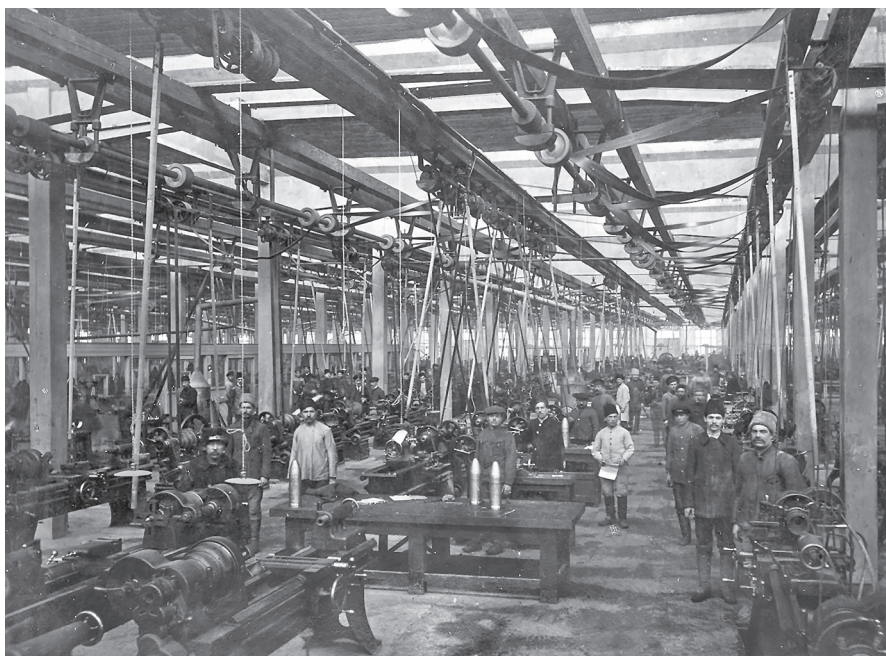
Čeští zajatci často disponovali odborným vzděláním v řemesle, a tak byli nasazováni ve významných zbrojních podnicích. Zde vidíme české dělníky v muniční továrně v Taganrogu

Zajatci byli ovšem používáni také k pracím čistě vojenským, tj. ve zbrojovkách, na vojenských stavbách apod. Také v tomto případě se porušovala