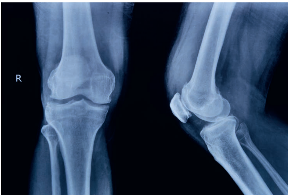
RTG projekce kolene

Pokud se díváte na svou vlastní nataženou dolní končetinu, pak je orientace možná ještě snadnější: stehenní kost nenahmatáte, je pod masou svalů stehenních, zato čěšku najdete poměrně snadno jako pohyblivou plochou kost přímo nad kolenním kloubem, kost holenní je z přední strany zakončena ostrou hranou, a pokud se posunete vedle kolene do vnější strany a trochu dolů, nahmatáte malý hrbolek, který je hlavičkou kosti lýtkové.