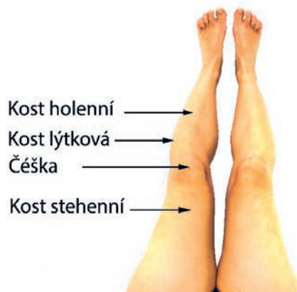
Pohled na natažené končetiny

Pokud se díváte na svou vlastní nataženou dolní končetinu, pak je orientace možná ještě snadnější: stehenní kost nenahmatáte, je pod masou svalů stehenních, zato čěšku najdete poměrně snadno jako pohyblivou plochou kost přímo nad kolenním kloubem, kost holenní je z přední strany zakončena ostrou hranou, a pokud se posunete vedle kolene do vnější strany a trochu dolů, nahmatáte malý hrbolek, který je hlavičkou kosti lýtkové.