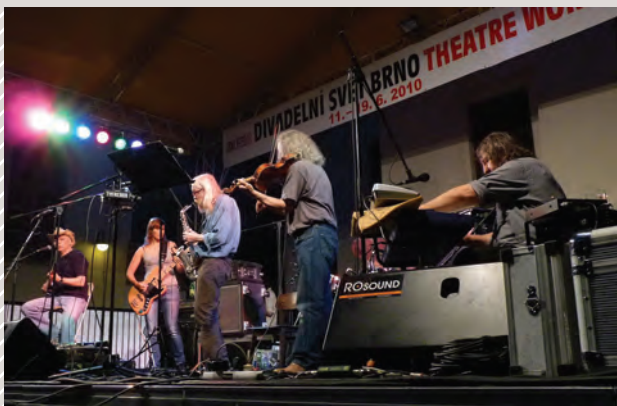
Plastic People of the Universe

V hudbě, kterou protagonisté undergroundu provozovali, můžeme vysledovat jeden podstatný rys: zvažnění. Bylo třeba zřejmě šokujícího bondyovského období u Plastic People of the Universe (PPU) a osvobozujícího smíchu u DG 307 , aby mohly vzniknout (v podstatě bez přímé zpětné vazby početnějšího publika) ucelené cykly PPU Pašijové hry (1978), Ladislavem Klímou inspirované Jak bude po smrti (1979), Co znamená vésti koně (1981) či program rustikální poezie Pavla Zajíčka s nezvykle ukázněným projevem DG 307 Dar stínů . U PPU se stal rozhodující textařskou osobností Vratislav Brabeneč. I hudba Mejly Hlavsy se odklání od rytmické složky rocku a svou podstatou se blíží liturgiím či oratoriu. ( Život v tahu aneb Třicet roků v rocku, Ondřej Konrád, Vojtěch Lindaur, 1990 )