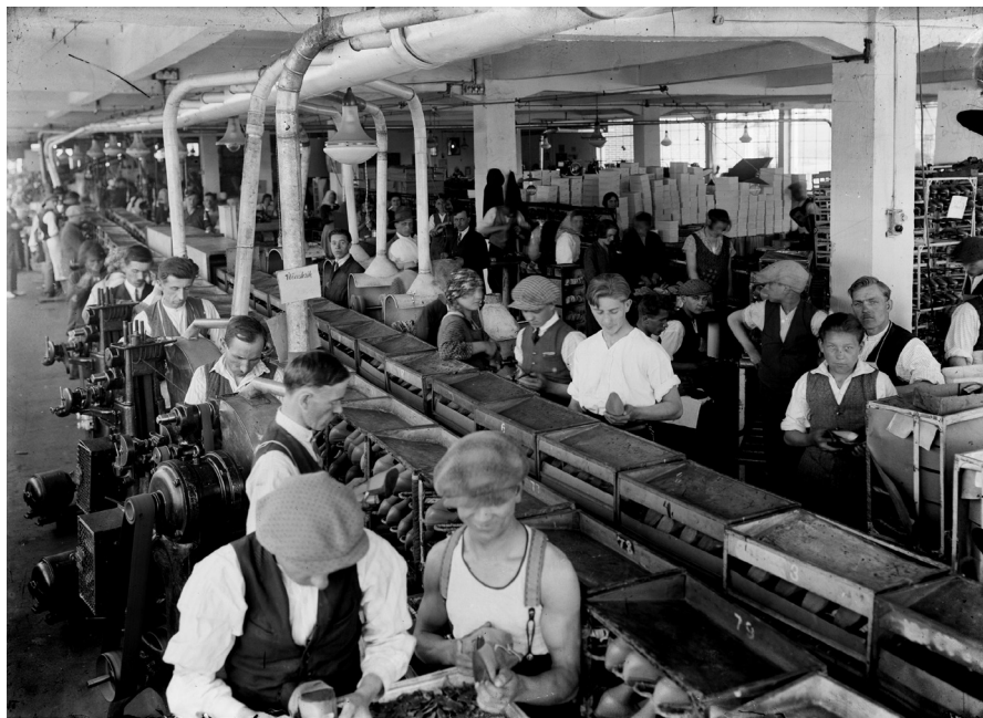
1933. Baťovy závody – pohled do jedné z obuvnických dílen na výrobu dámských střevíců