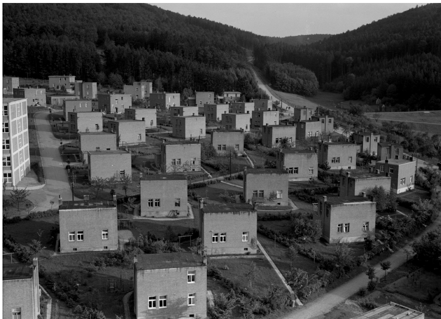
1935. Zahradní čtvrť rodinných domků Nad Ovčírnou ve Zlíně