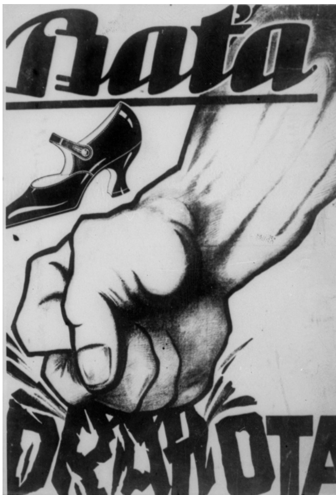
1922. Plakát, kterým firma Baťa oznámila zákazníkům snížení cen obuvi téměř o 50 % (Reklama Baťa, Moravský zemský archiv v Brně, Státní okresní archiv Zlín)