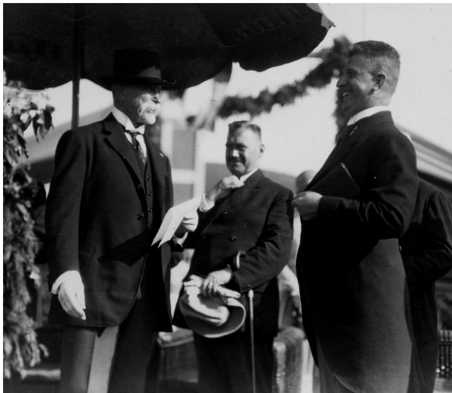
24. června 1928. Prezident Tomáš Garrigue Masaryk na návštěvě Zlína vítán Tomášem Baťou. Uprostřed ministr vnitra Jan Černý, zemský prezident země Moravskoslezské